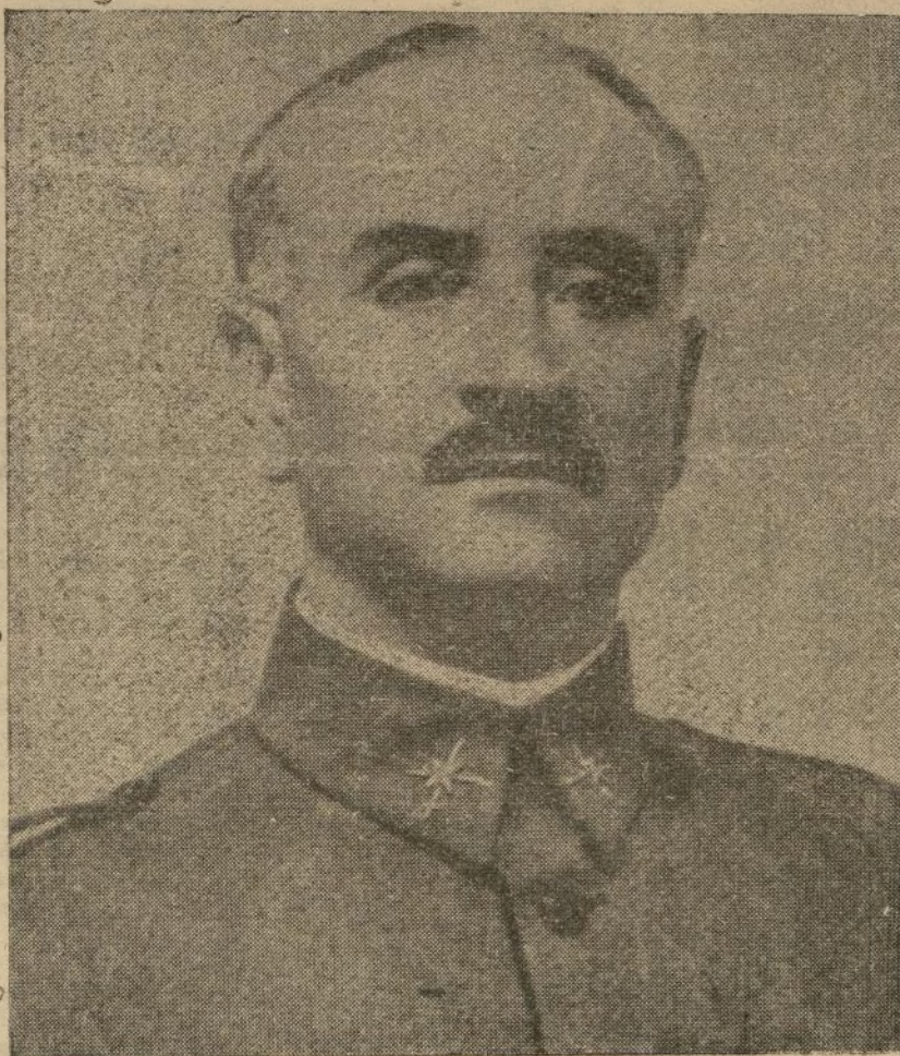
Excelentísimo señor General don Gonzalo Queipo de Llano, General en Jefe de los Ejércitos del Sur