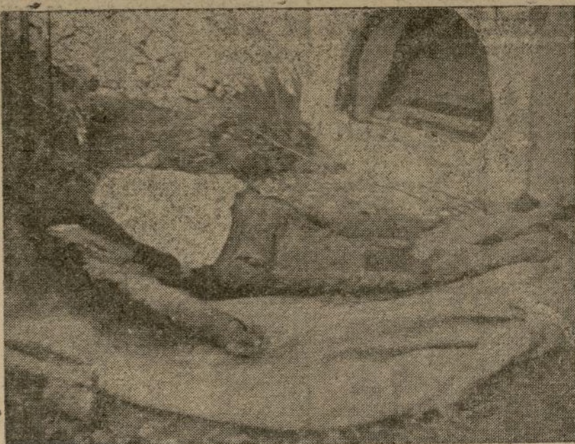
Infame sacrificio de un hombre bueno. Los rojos criminales, al huir de Málaga, le mataron, seccionándole la cabeza, de la que se sirvieron los miserables asesinos, en la plaza del pueblo de Villanueva del Rosario, como balón para jugar un fútbol macabro