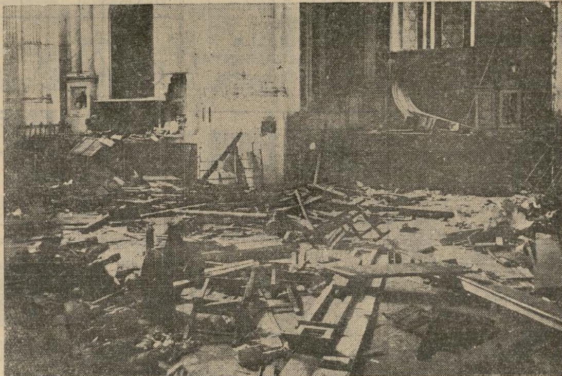
Barbarie, profanación, ruinas, marcan el paso maldito de la horda.—La iglesia de Santiago, de Málaga, sucumbió al furor iconoclasta de los modernos bárbaros marxistas.