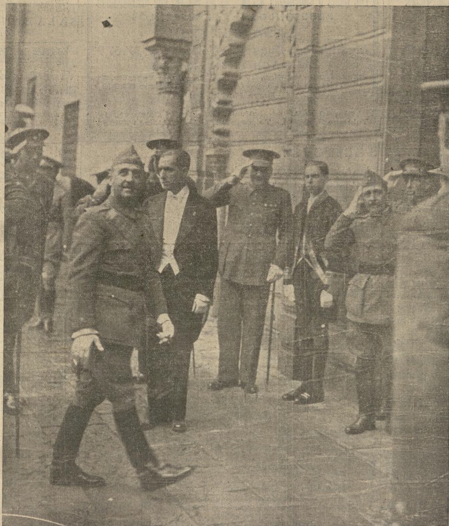
S. E. el Jefe del Estado y Generalísimo del Ejército español, don Francisco Franco Bahamonde, entrando en el Alcázar de Sevilla, adonde fué recientemente con motivo de la visita de los marroquíes que acudieron a rendirle homenaje de adhesión y gratitud, por haberles facilitado su viaje de peregrinación a la Meqa.