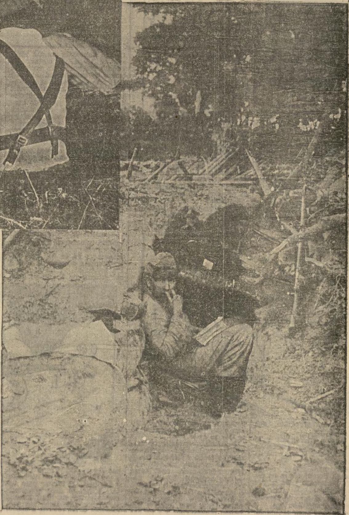
Das de nuestras posiciones en la Casa de Campo. En la foto superior se ve Madrid en la lejanía