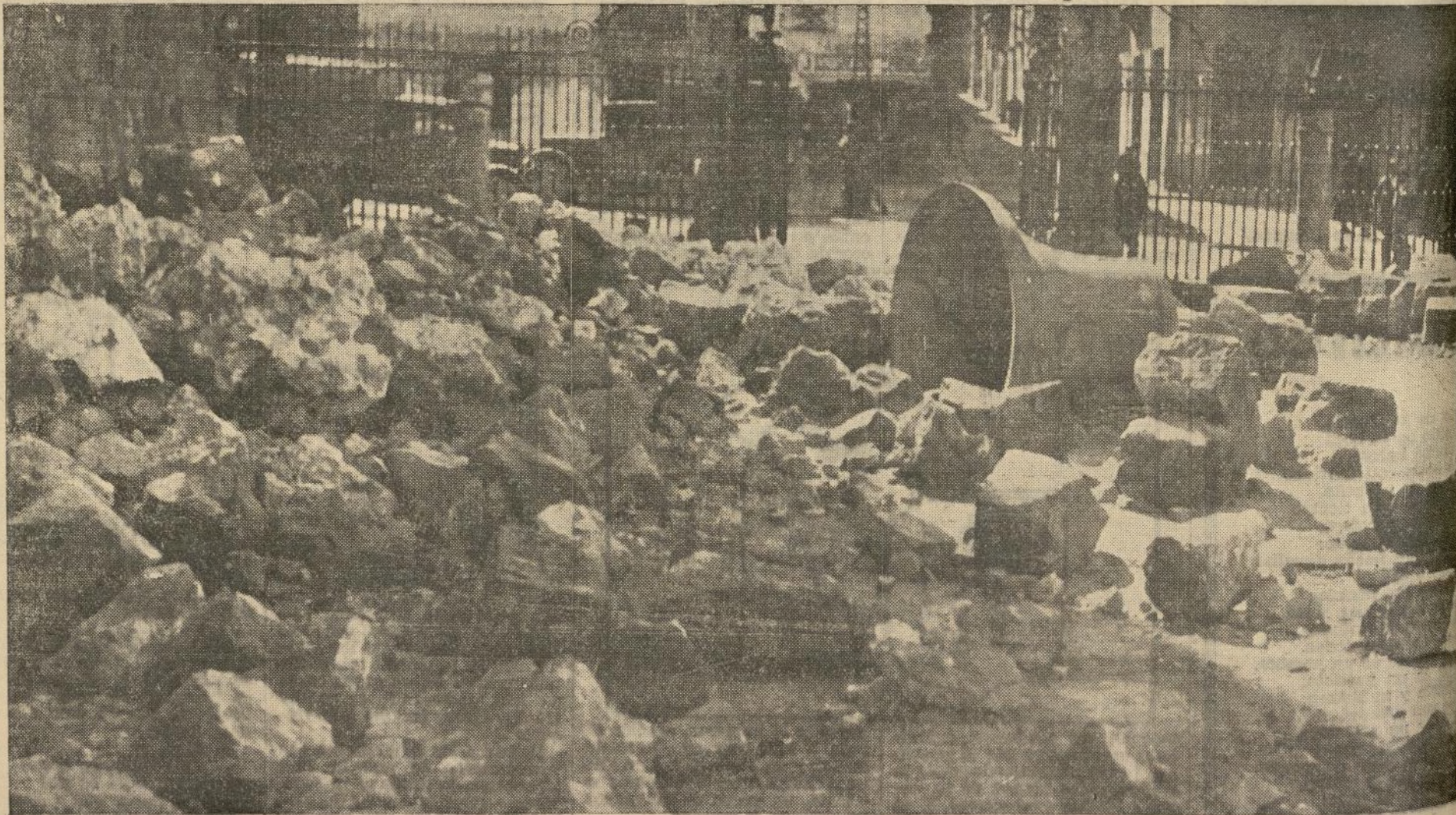
¡La pobre catedral de Sigüenza! Ved el altar plateresco y el pórtico, en qué estado de ruina los ha dejado la canalla roja. ¡Qué satisfechos se han quedado los muy hijos de Satanás!