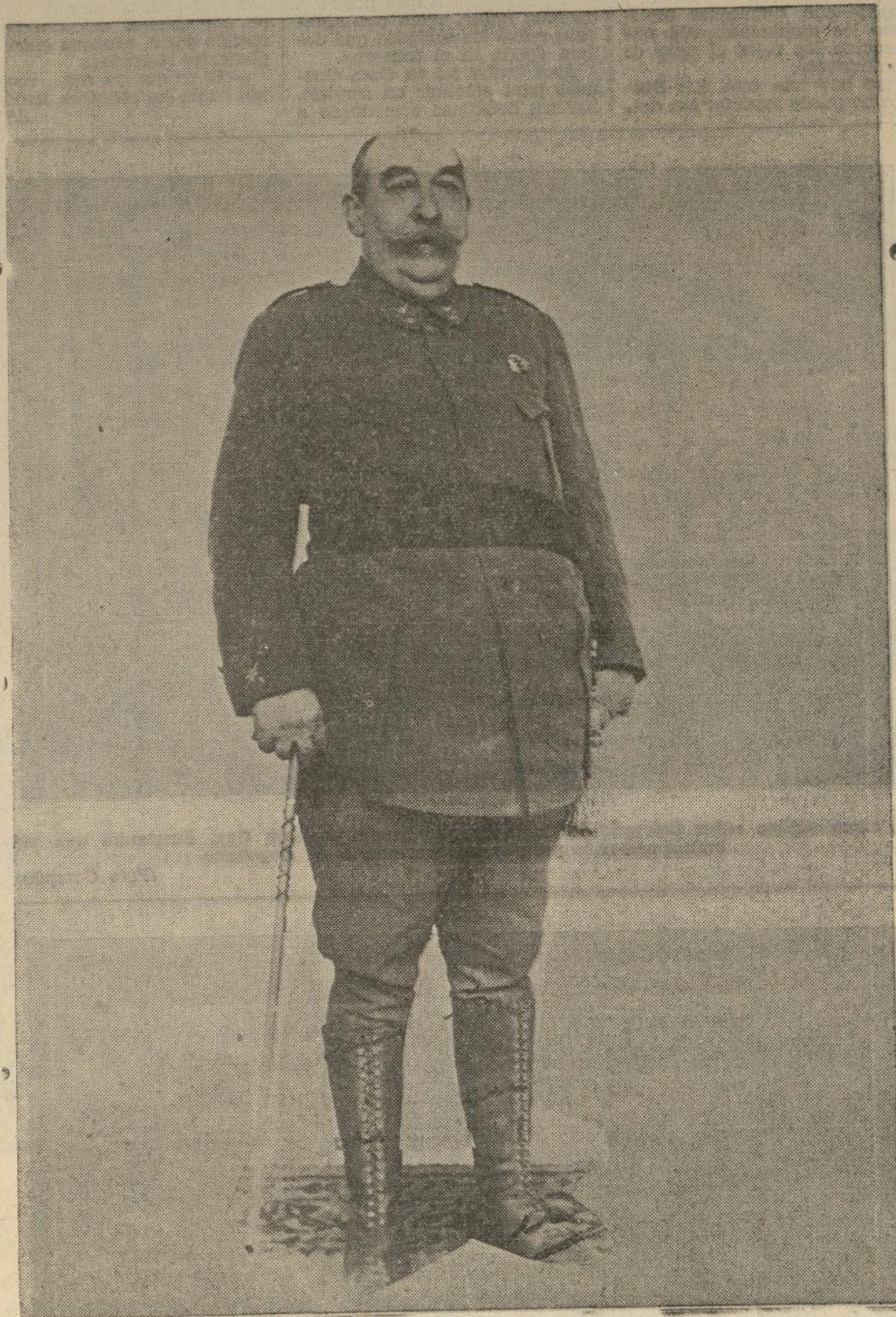
El excelentísimo señor general don Andrés Saliquet Zumeta, jefe de la División reforzada de Madrid y de las de Avila y Soria, y uno de los ilustres soldados que están forjando la gran victoria de España

Y les pronunció una conferencia sobre el «Derecho de asilo», digna de figurar como modelo