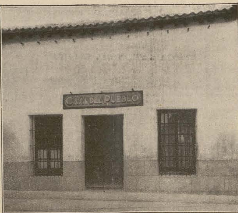
Domicilio social de los trabajadores de Vicálvaro, a los que ha prestado solidaridad la Federación Local para la posesión de esta Casa del Pueblo.