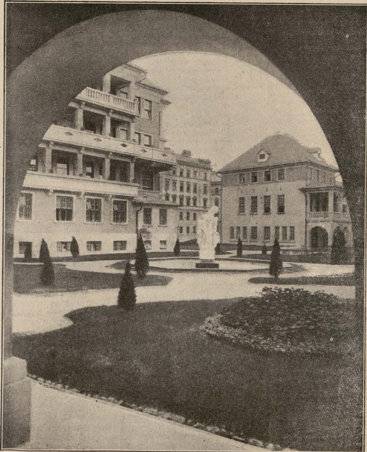
LA OBRA DEL AYUNTAMIENTO SOCIALISTA DE VIENA

Jardín y algunos de los edificios que forman parte de la Casa de Maternidad y Hospital para niños, edificados por el Ayuntamiento de Viena, que está realizando una grandiosa labor en beneficio de los trabajadores austriacos.