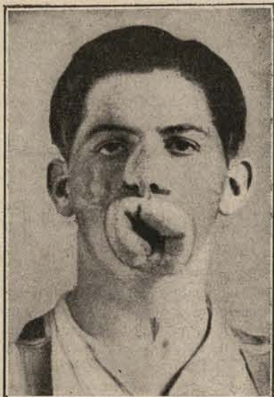
Boca y maxilar inferior arrancados por la metralla en un joven soldado de la guerra europea.

obreros, que quizá excede de la cifra de 1.800, son la de explanación de terrenos, desmonte y vaciado de tierras para adaptar la configuración topográfica de aquellos lugares a los proyectos de emplazamiento de edificios, parques y vías de comunicación de la Ciudad Universitaria. Tiene a su cargo la ejecución de estos trabajos, por contrato, la Empresa constructora Sociedad Anónima Agromán, que utiliza potentes máquinas excavadoras y el trabajo manual de muchos centenares de peones ocupados en la explanación y remoción de tierras, tareas penosas por el gran desgaste muscular que exigen y que no son recompensadas ni siquiera en las condiciones que determina el real decreto-ley relativo al trabajo en las obras públicas inserto en la «Gaceta» del 7 de marzo del año en curso.