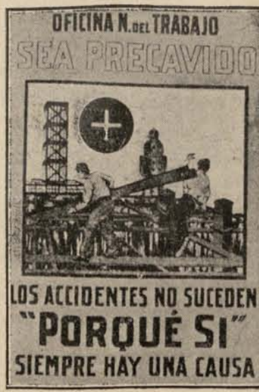
Cartel de propaganda del Uruguay para prevenir los accidentes del trabajo.