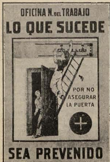
Cartel de propaganda del Uruguay para prevenir los accidentes del trabajo.