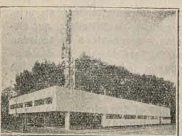
Casa de la prensa obrera en Colonia, Exposición 1928.