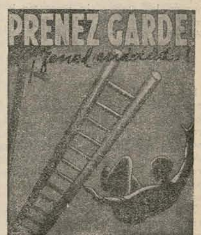
Sujetad bien las escaleras.

Pero dejemos a un lado estas debilidades que por cobrar dietas tienen estos elementos que se oponen a la ley de Asociaciones porque en ella se