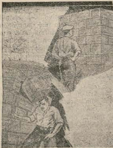
Utilizad la cabeza para colocar los objetos y no para detenerlos en la calda.

Como Federación, no podemos aquí dar un criterio que reflejase el que pudiéramos llevar al Congreso de la Unión. Como tal Federación, no tenemos personalidad para hacerlo; siendo las Secciones las que a ello tienen derecho. En este momento sólo queremos recoger esta impresión del Congreso del Partido Socialista, que tanto ha de influir en las decisiones del de la Unión. Sólo, como comentario final para uno y otro Congreso, nuestro criterio es de que, cualesquiera que sean los asuntos que apasionen nuestras discusiones, preferimos siempre que nos equivoquemos juntos a que acertemos por separado.