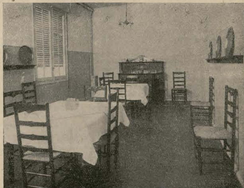
Confortable, moderno, limpio, con un servicio completo, que contrasta con otras dependencias de otros edificios análogos.

Seguimos esperando a que esta República de trabajadores nos dé donde ocuparnos. ¡Claro! Fuera de las cárceles y Juzgados de guardia.