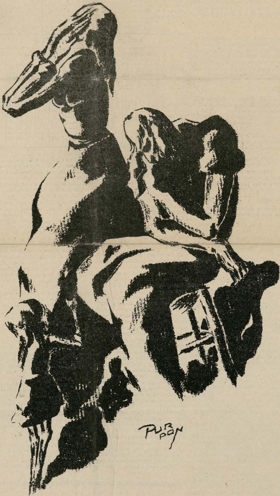
La falta de trabajo llega a estos estados de desesperación, con expresión trágica de la miseria

a este problema se refiere, una obra digna de la capital de España.