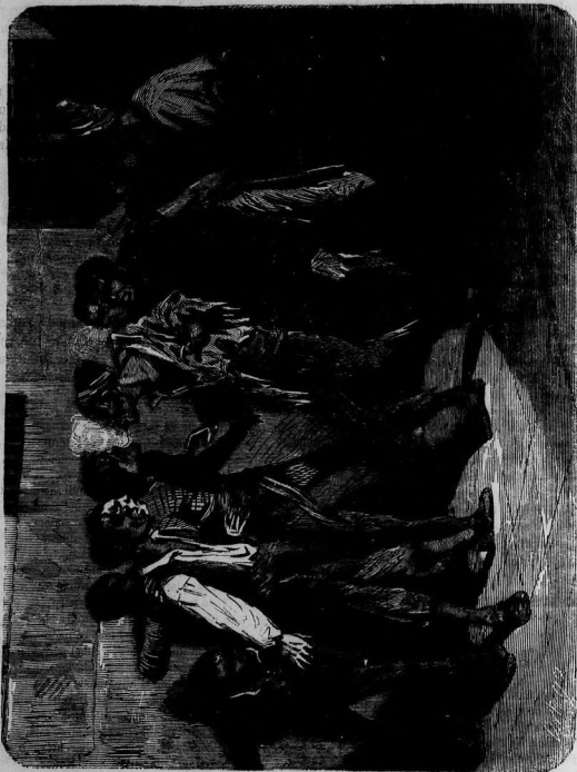
PATIO DE UNA CÁRCEL DE HOMBRÉS.

Si á esto se agrega los interminables monólogos, la