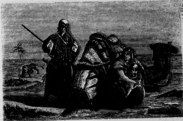
LA VIDA DEL DESIERTO.

El monstruo, al igual que las antiguas divinidades sirias, que morían y revivían periódicamente, desapareció de la escena pública para reaparecer arrogante y amenazador, con los mismos vicios y pasiones de siempre: mejor dicho, el monstruo no desapareció nunca; metamorfoseóse cubriéndose con el disfraz democrático, engañando desde el poder al confiado pueblo.