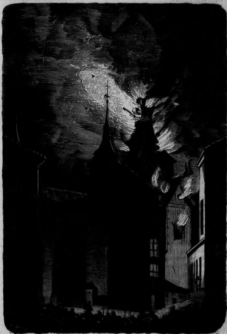
INCENDIO DE LA IGLESIA DE SANTO TOMÁS EN LA NOCHE DEL 13 DE ABRIL.—(MADRID.)

Hoy gime el talento preso en un círculo mezquino, y por un solo camino llegar se quiere al progreso.