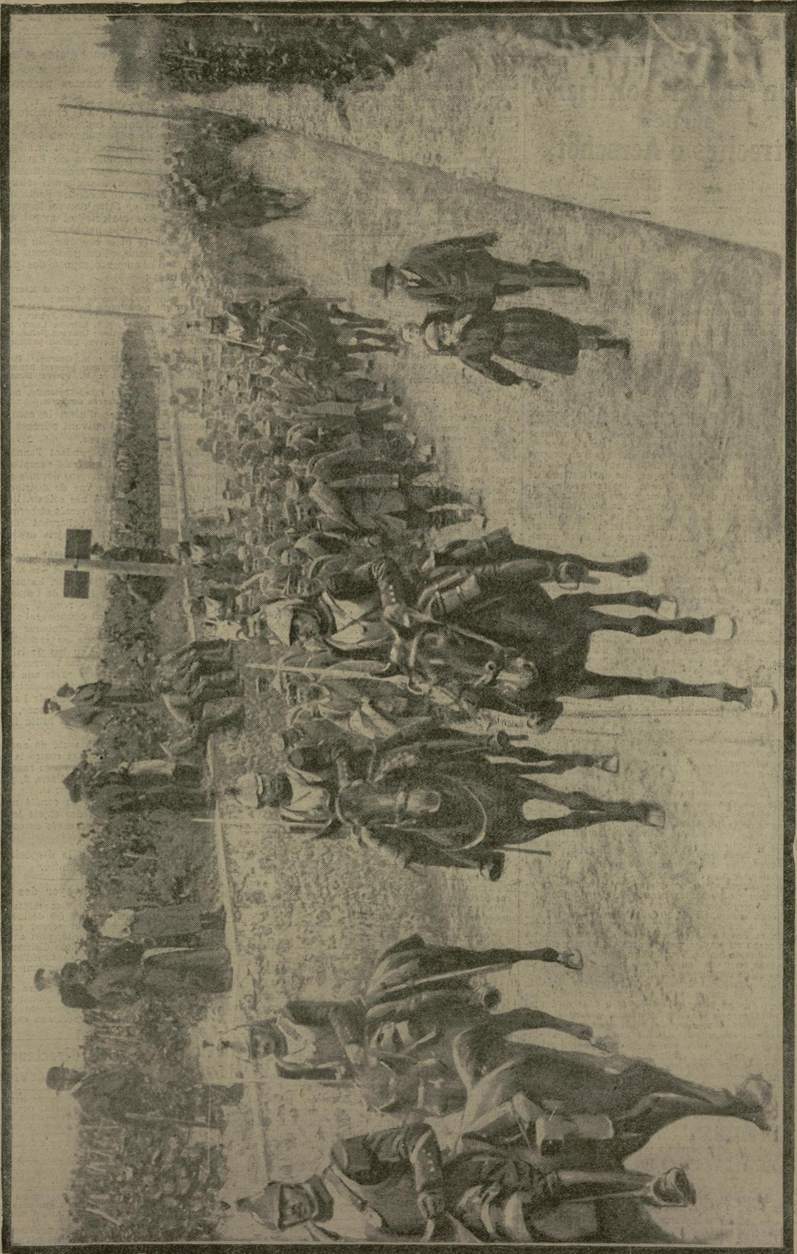
Nous avons dit, au cours des derniers combats qui viennent de se dérouler dans la région de l'Aisne, nos troupes avaient fait de nombreux prisonniers, un grand nombre appartenant à la fameuse garde Prussienne. Voici une colonne de ces prisonniers conduite sous bonne escorte vers une gare voisine.