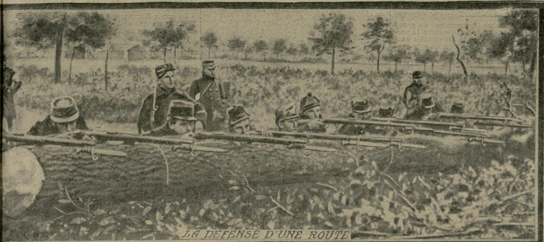
LA DEFENSE D'UNE ROUTE