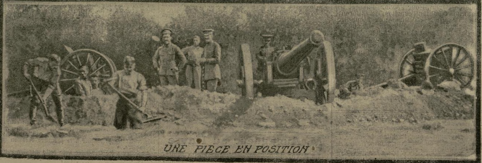
UNE PIÈCE EN POSITION

Plusieurs fois déjà nous avons eu l'occasion de signaler l'efficacité des tirs de l'artillerie anglaise. Lors des derniers combats, nos alliés utilisèrent sur certains points leurs grosses pièces d'artillerie lourde. Les ennemis eurent à souffrir du feu de ces pièces, qui causèrent, en effet, des ravages énormes. On voit ici les évolutions et la mise en batterie de quelques-uns de ces gros canons anglais.