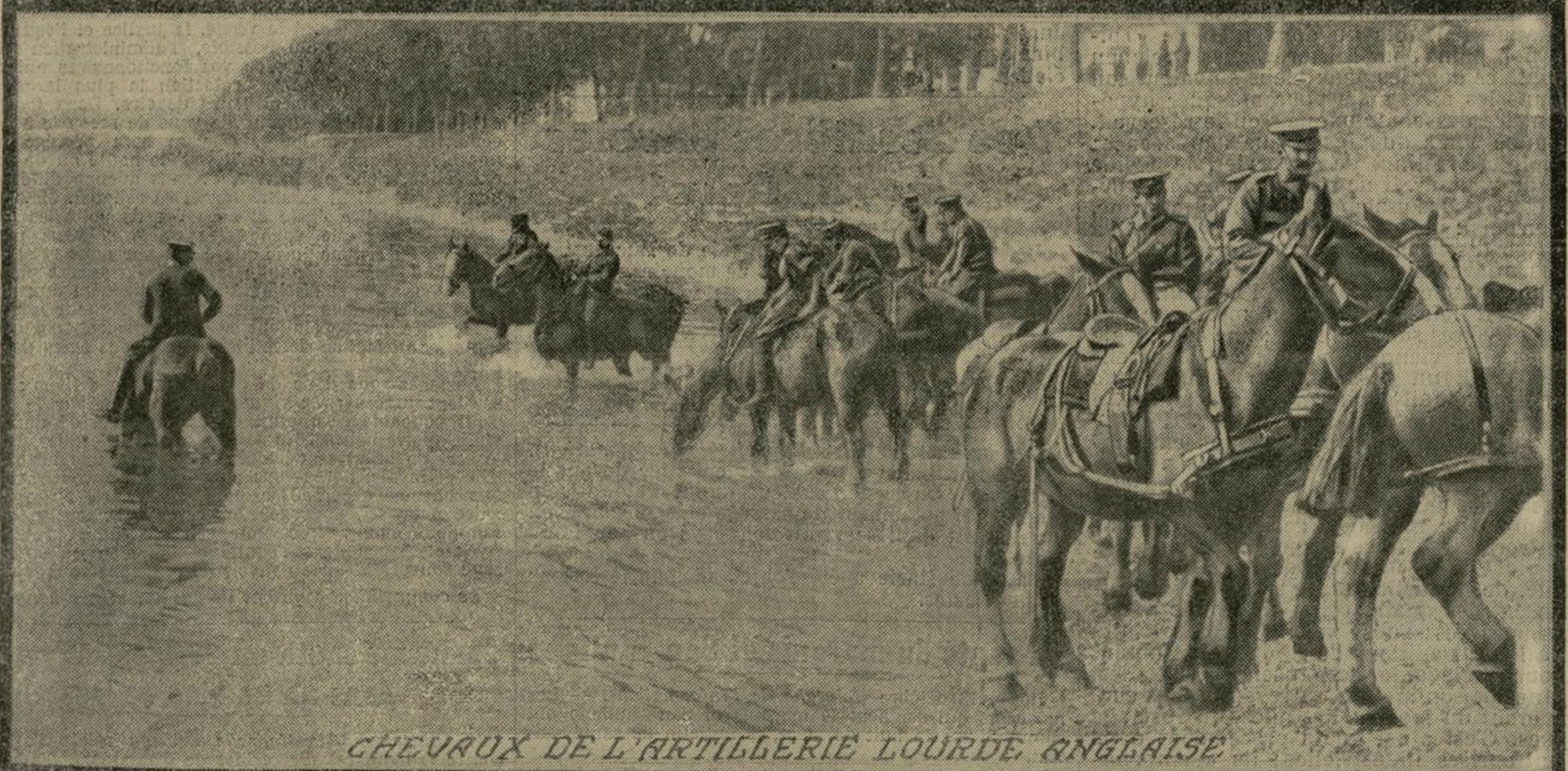
CHEVAUX DE L'ARTILLERIE LOURDE ANGLAISE