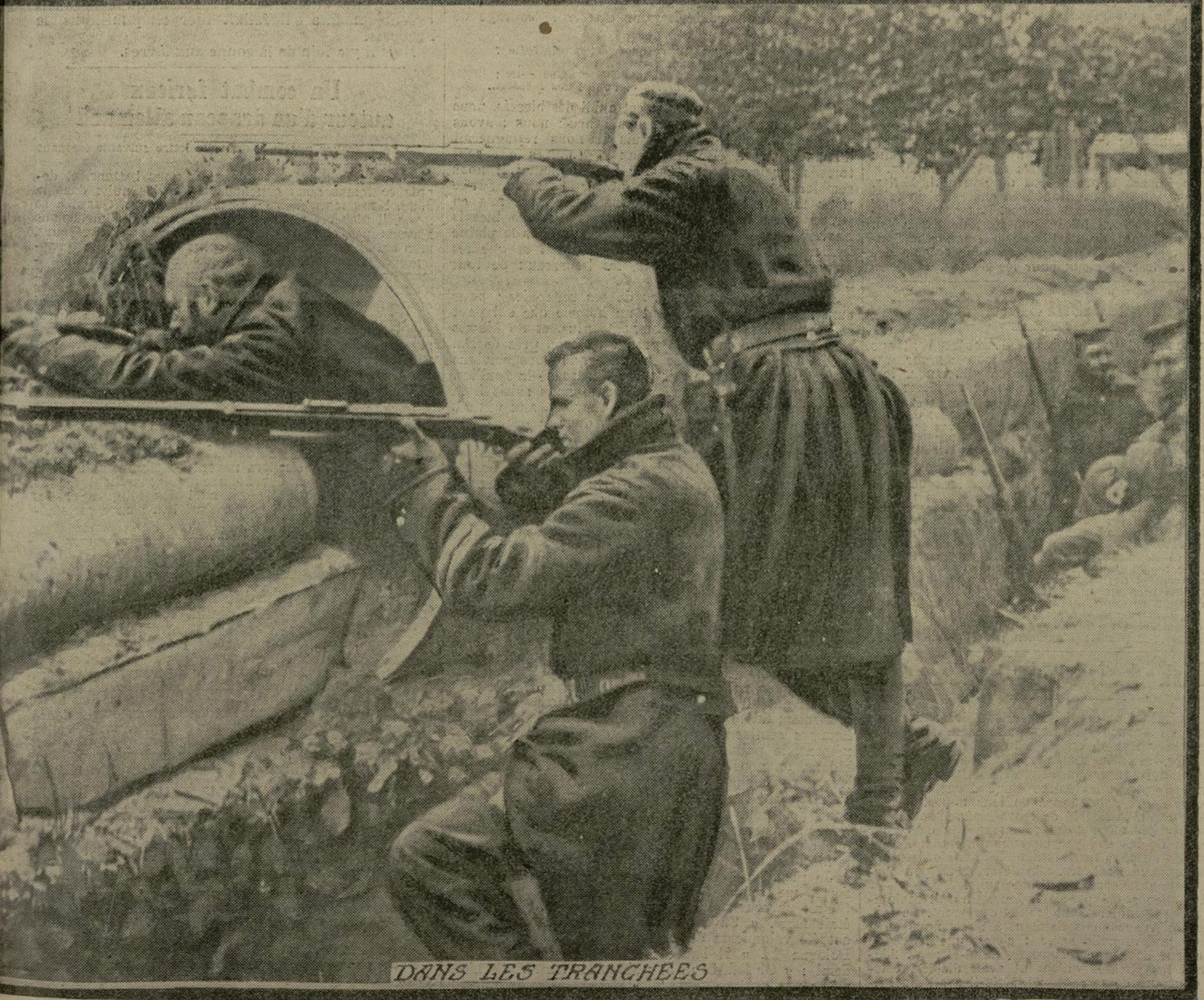
DANS LES TRANCHÉES

de nouvelles attaques. Nos alliés se défendent avec héroïsme, mais la lutte, pour eux, est inégale. Une centaine d'Allemands qui, il y a présent à la baïonnette sur leurs adversaires. Ces derniers tentèrent de se dégager, mais ils furent cernés et se rendirent.