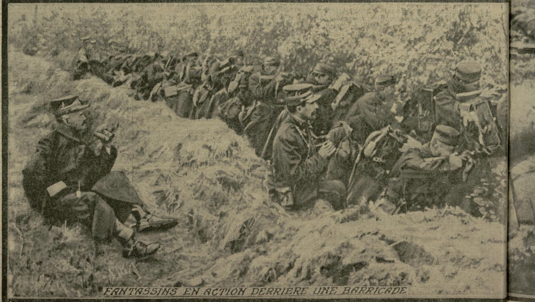
FANTASSINS EN ACTION DERRIERE UNE BARRICADE

Anvers résiste toujours. Plusieurs forts défendent encore des secteurs autour de la ville, et certains détachements de l'armée belge, après deux jours, avaient réussi à se faufiler entre les intervalles des forts, furent reboussés par les soldats belges, qui se présentèrent à l'ennemi.