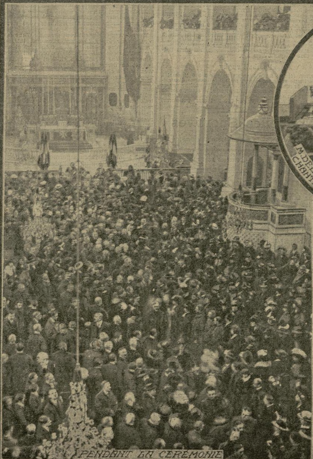
PENDANT LA CEREMONIE