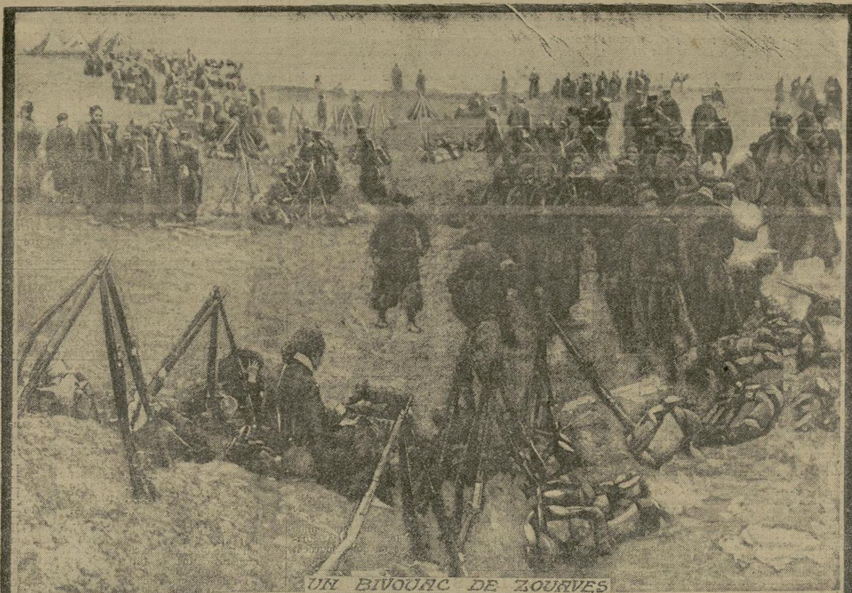
UN BIVOUAC DE ZOUAVES