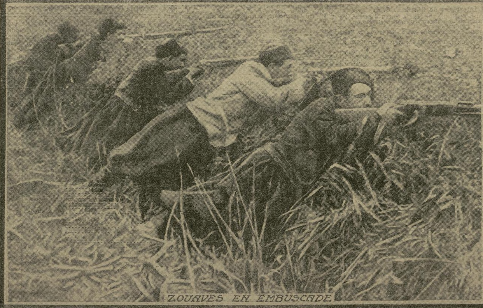
ZOUAVES EN EMBUSCADE

Les zouaves sont braves et intrépides. Leur charge à la baïonnette cause la panique dans les rangs ennemis, et récemment encore nous les vîmes enlever de solides positions. A l'abri dans leurs tranchées, ils ont plus d'une fois, par leur feu toujours bien dirigé, arrêté les attaques des soldats prussiens.