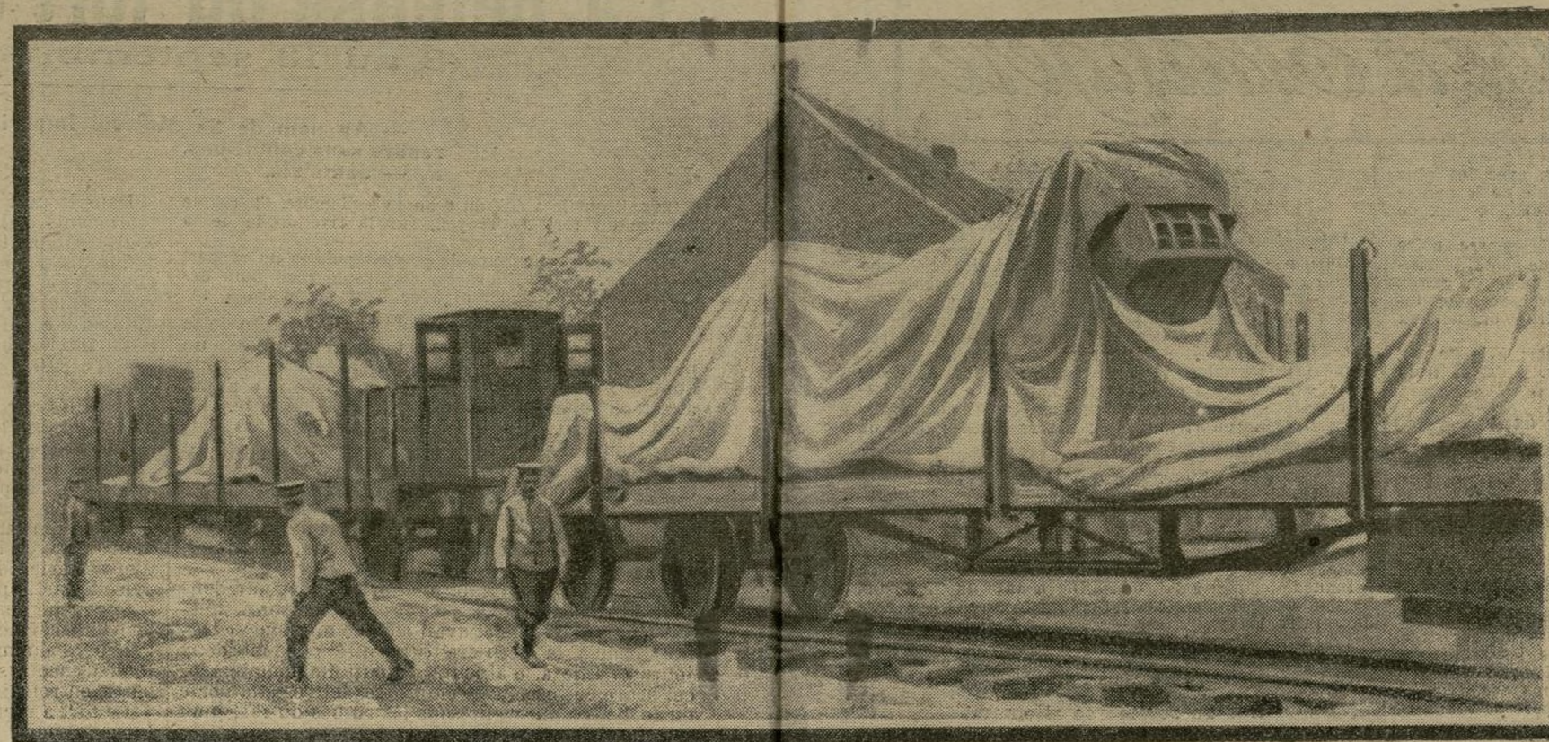
Le transport d'un canon de 420 allemand

Le transport des gros canons de 420 allemands nécessite tout un matériel important. Démontés en plusieurs pièces, toutes cachées sous des bâches, ces énormes canons sont hissés sur des chariots spéciaux qui sont remorqués le plus près possible de la ligne de feu. C'est toujours dans le plus grand secret que l'ennemi effectue ces mouvements, et c'est par surprise qu'un photographe a pu prendre un instantané de ce train en partance.