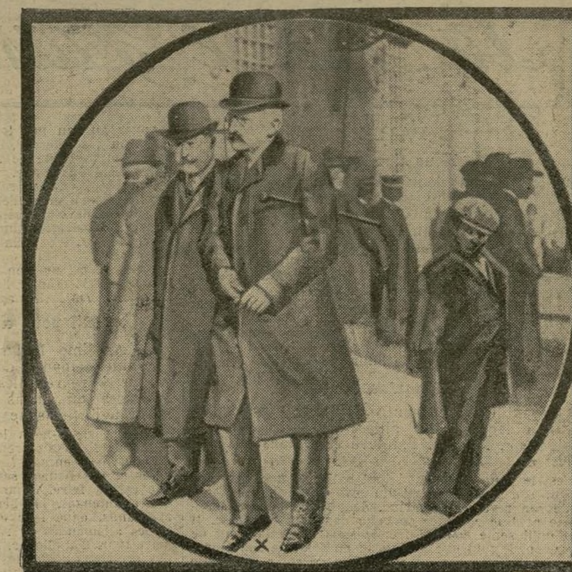
Le successeur du marquis di San Giuliano

Le roi d'Italie vient de nommer le successeur du marquis di San Giuliano, ministre des Affaires étrangères, dont nous avons annoncé la mort récemment. Le souverain a porté son choix sur M. Sonnino (+), une des personnalités politiques les plus en vue de l'Italie.