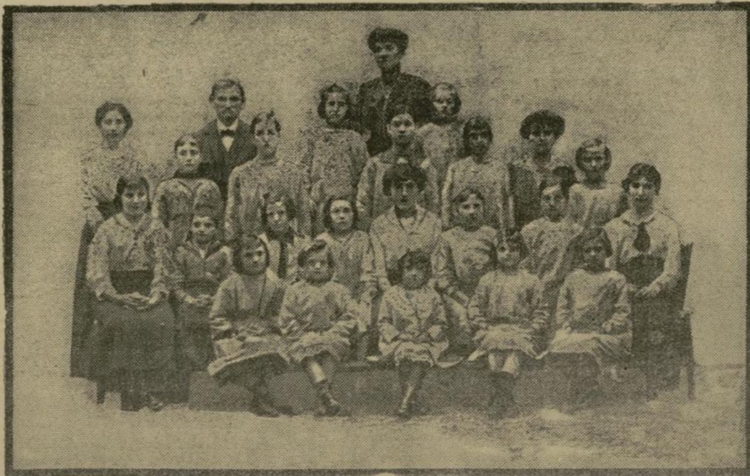
Un groupe des colonies de vacances organisées dans le Midi par La Vie Féminine.

ils sont tous rentrés, vendredi matin, pleins de santé; leur mine réjouie attestait aux plus incrédules l'excellence du séjour des colonies. Nous avons même pu constater sur la figure de certains des enfants un peu de mélancolie du retour obligatoire.