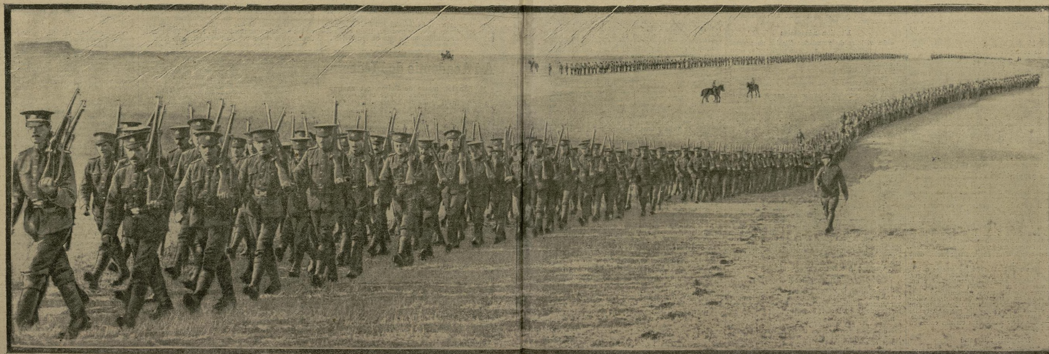
Une brigade d'infanterie anglaise va prendre position sur la ligne de feu

L'action des troupes anglaises dans le Nord se poursuit toujours avec une extrême violence. En Flandre, les Allemands qui avaient concentré des masses d'hommes pour les lancer à l'assaut des positions occupées par les alliés échouèrent dans leur tentative. En effet, deux régiments d'infanterie britanniques, ayant pris les devants par une furieuse charge à la baïonnette, repoussèrent l'ennemi qui dut se replier précipitamment.