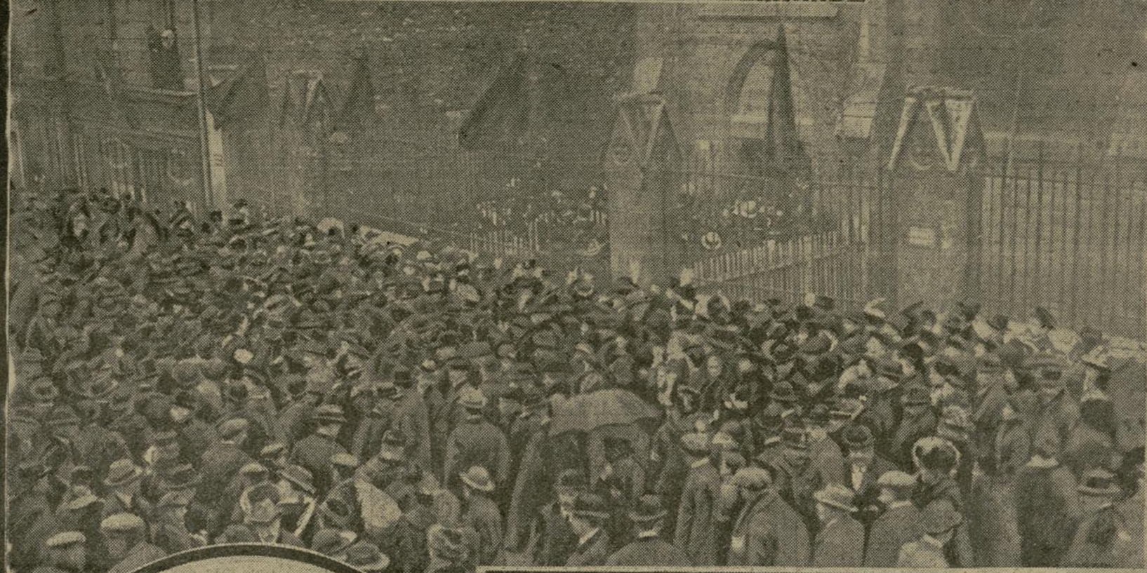
LA FOULE DEVANT L'ÉGLISE FLAMANDE