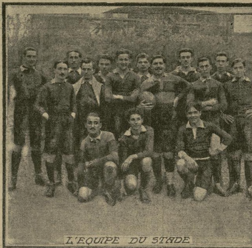
L'EQUIPE DU STADE