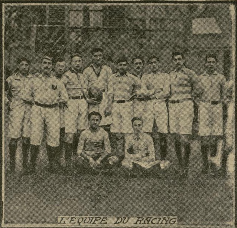
L'EQUIPE DU RACING

Un match de football rugby opposait hier à la Faisanderie, à Saint-Cloud, le Racing-Club de France et le Stade Français. Le Stade a été vainqueur par 18 points à 3.