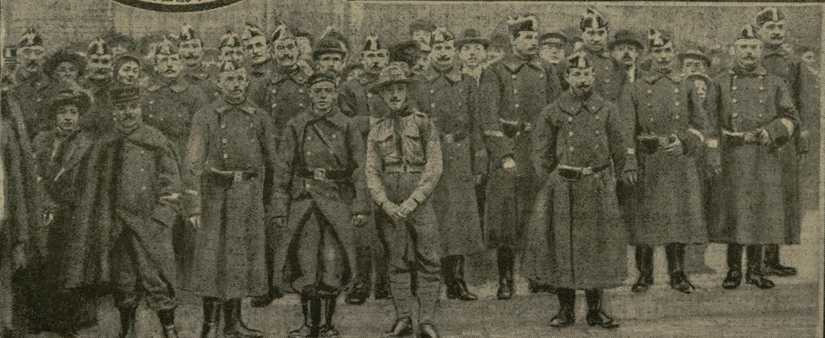
UN GROUPE DE GENDARMES BELGES À LA SORTIE DU TE DEUM