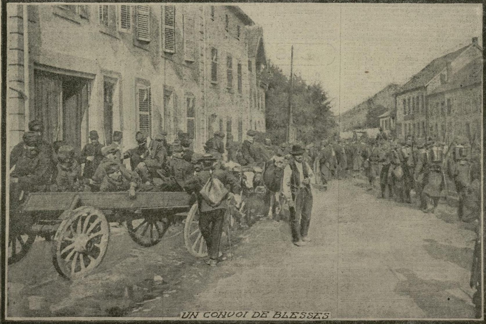
UN CONVOI DE BLESSÉS

Tous les jours, nos vaillantes troupes fortifient leurs positions en Alsace. Notre avance dans cette région s'accroît de plus en plus et l'ennemi ne peut résister aux violentes attaques de nos armées. A l'époque de la prise de Saales, nos soldats furent particulièrement fêtés par la population du village. Elle fit, en effet, à tous le meilleur accueil.