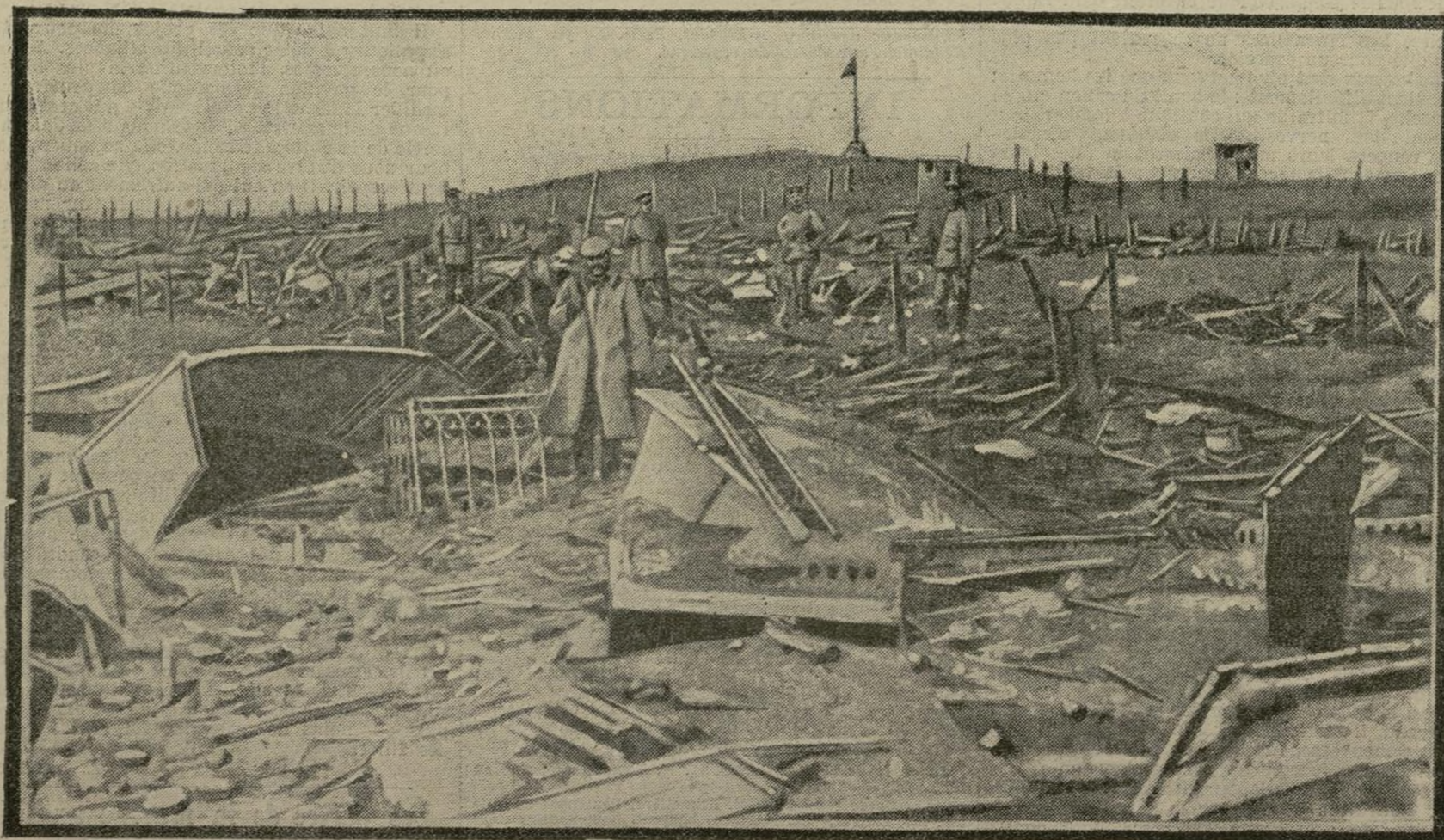
Depuis la chute de Liège, certains forts de la ville, détruits par nos alliés avant l'arrivée des Allemands, ne sont plus aujourd'hui encore qu'un amas de ruines. Voici ce qu'il reste du fort Loncin. Et ce sont sur ces glorieux décombres que veillent ici les soldats du kaiser !