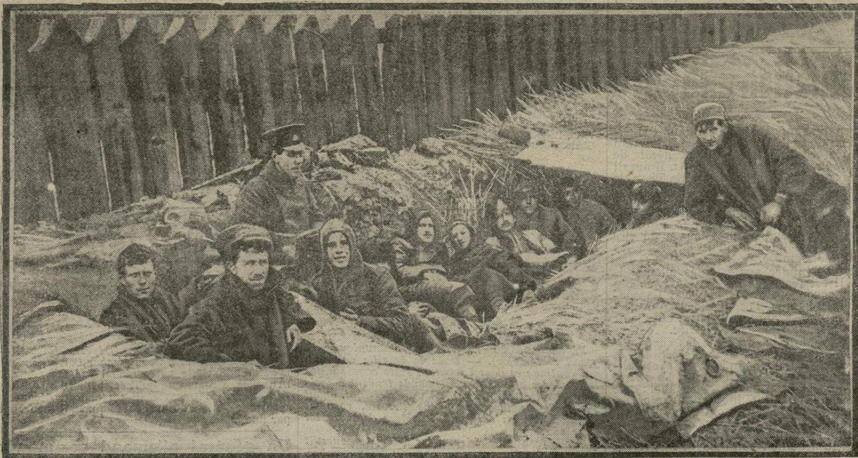
Pendant une accalmie, on voit ici ces frères d'armes se reposant dans un retranchement commun, à deux cents mètres de l'ennemi.

Belges et Anglais fraternisent dans une tranchée