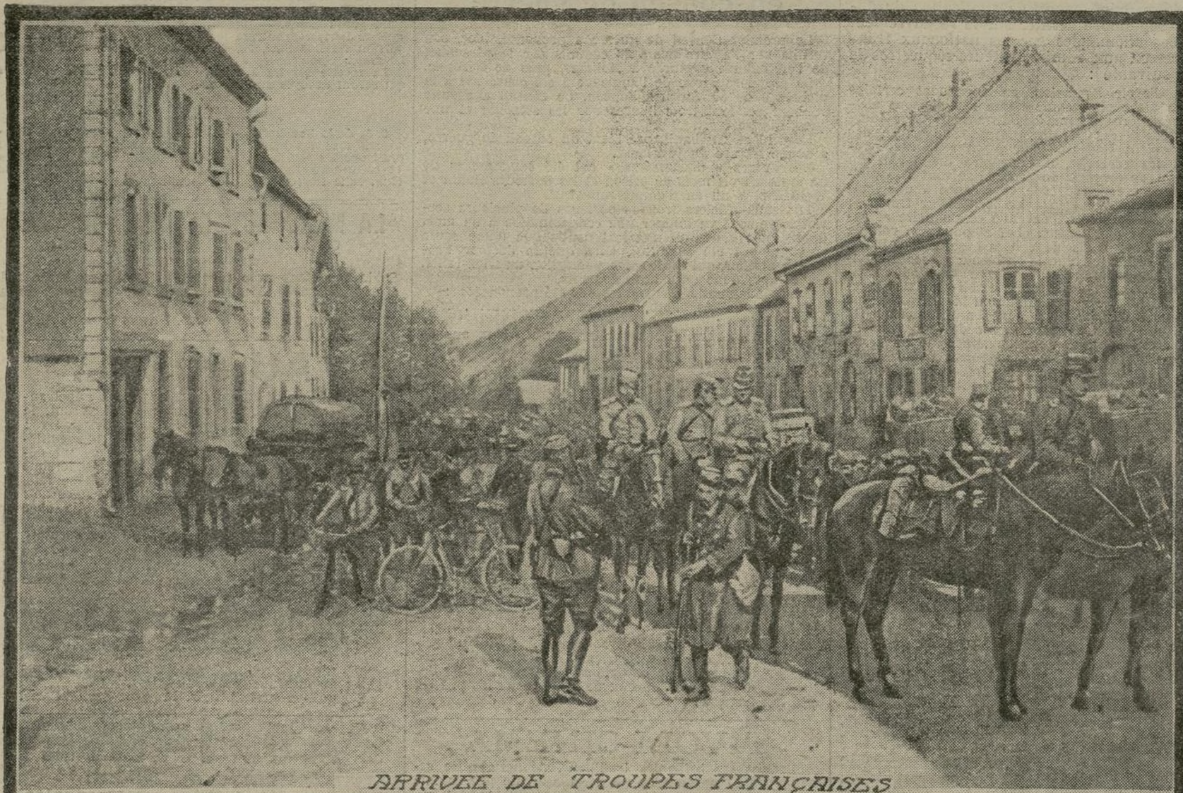
ARRIVÉE DE TROUPES FRANÇAISES