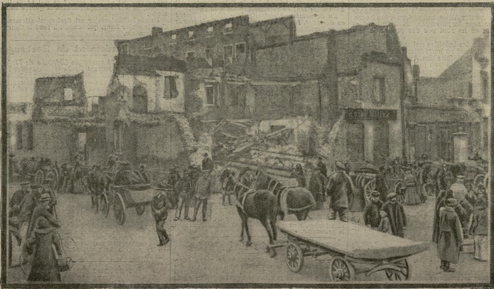
Le haut commandement allemand a prescrit aux populations d'évacuer certaines villes dans le plus bref délai. Ayuntamiento de Madrid