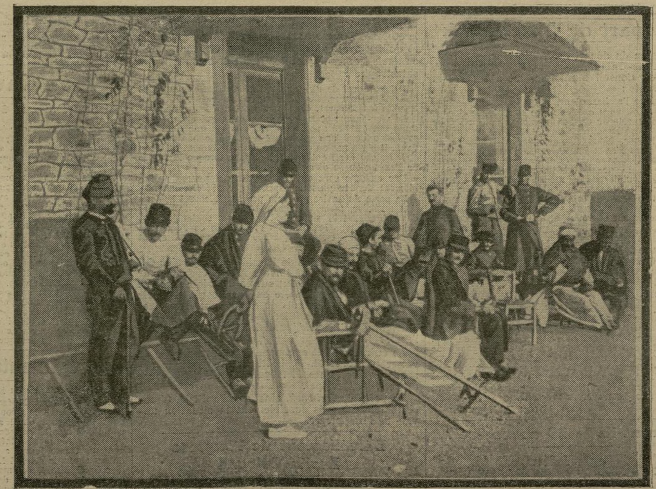
Un certain nombre de blessés terminent actuellement leur convalescence à l'ambulance de Trégastel, dans les Côtes-du-Nord. Plus de cinquante soldats, complètement rétablis, sont déjà retournés au feu après avoir reçu à cet hôpital les soins les plus dévoués.