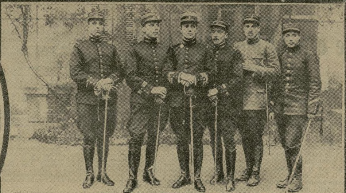
LES FILS DE GARIBALDI