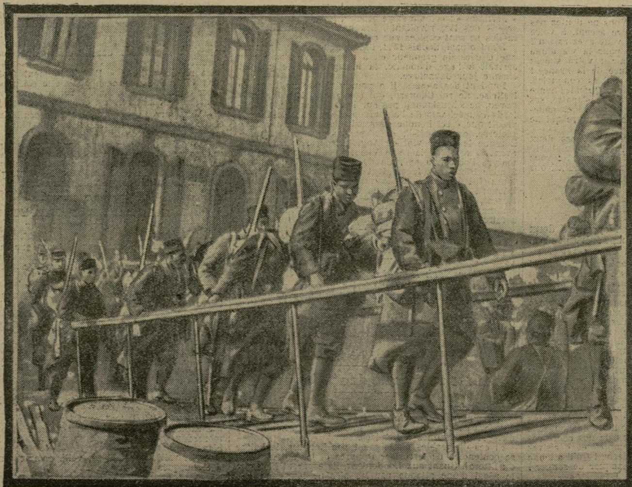
De nouveaux contingents de soldats sénégalais viennent de débarquer en France. Sous peu, ils seront dirigés sur le front, où ils retrouveront leurs vaillants frères d'armes, dont les actions d'éclat ne se comptent plus.