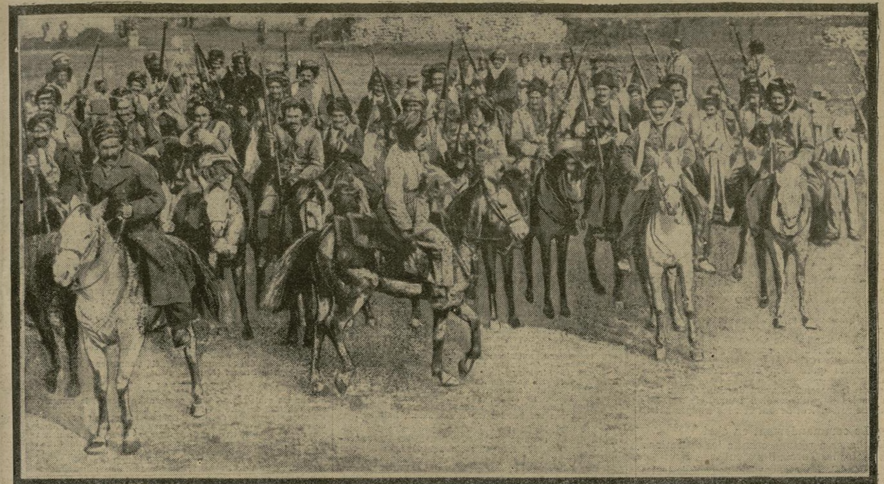
L'armée russe du Caucase qui combat actuellement en Turquie d'Asie vient de remporter toute une série de brillants succès. Dans la direction d'Erzeroum et au sud de la vallée d'Alaschkert, elle a complètement anéanti de très importantes forces kurdes.