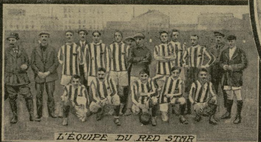
L'ÉQUIPE DU RED STAR