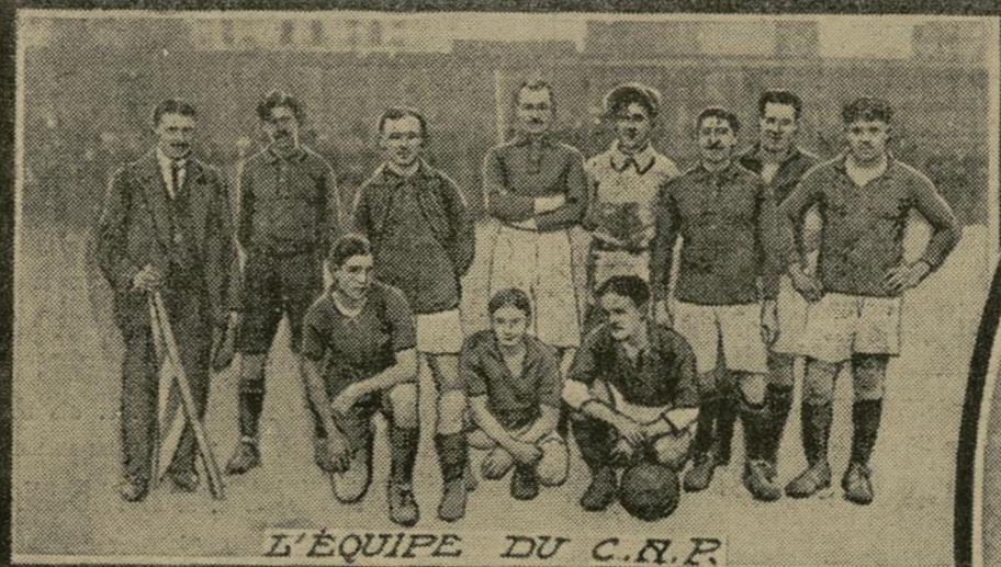
L'ÉQUIPE DU C.A.P.