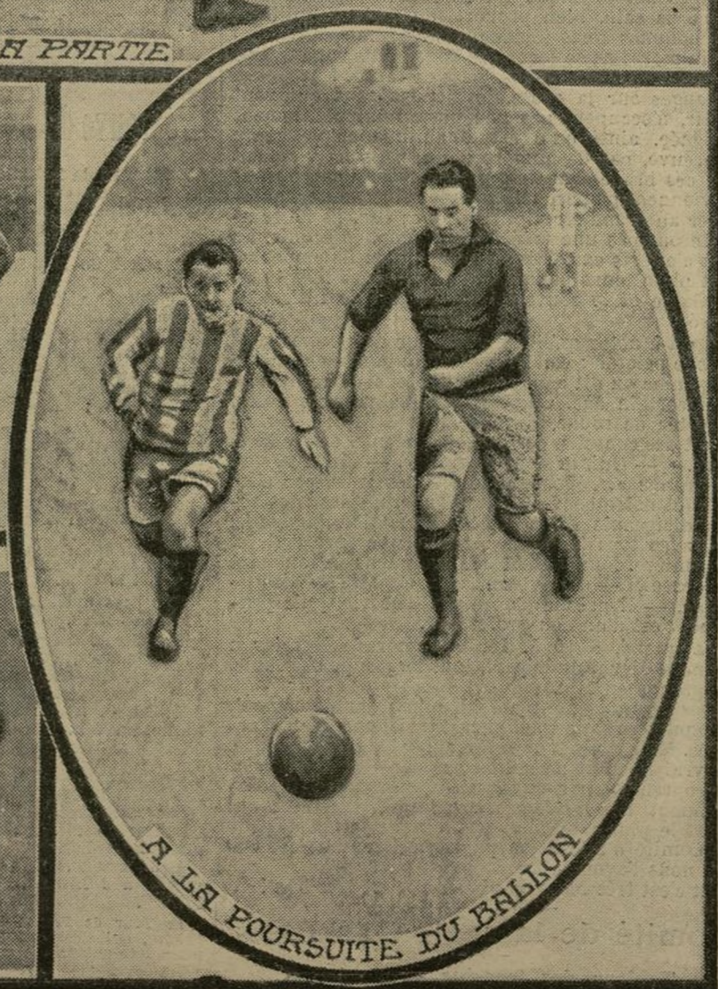
A LA POURSUITE DU BALLON

Hier a été disputé, à Saint-Ouen, un match de football association qui mettait aux prises l'équipe du Cercle Athlétique Parisien et celle du Red Star J.A.O. Cette rencontre, qui obtint le plus vif succès, avait été organisée dans le but d'acheter des ballons de football réclamés de toutes parts par nos soldats actuellement sur le front. Nous donnons ici deux vues de la partie, ainsi que les