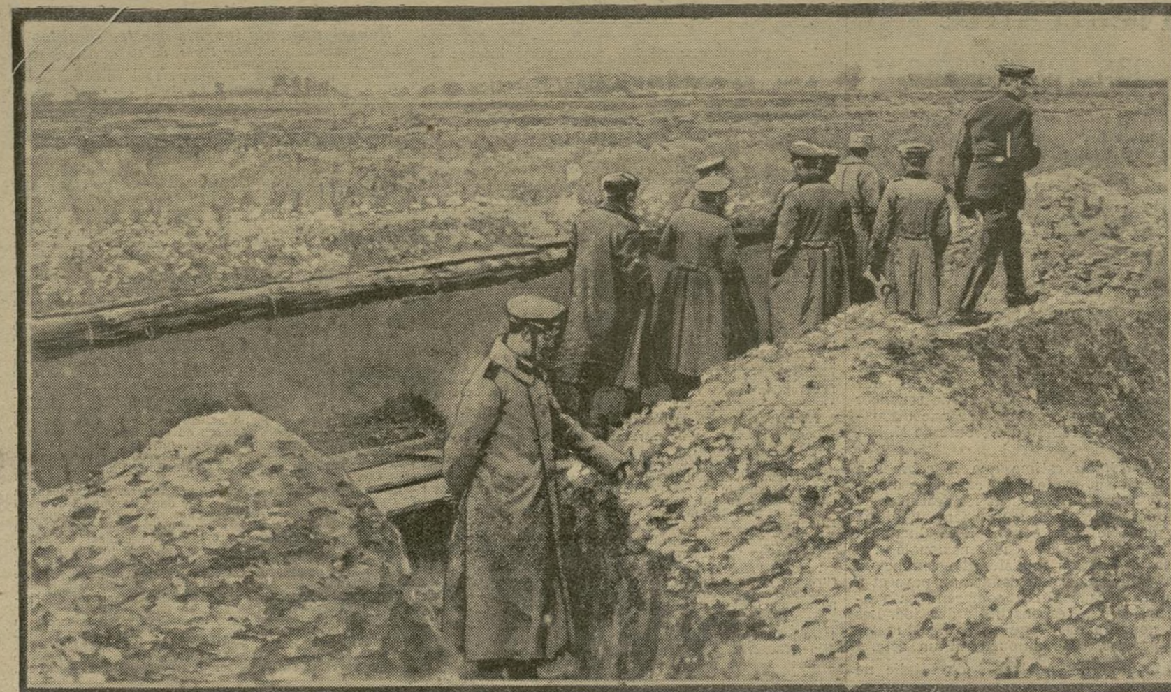
Les soldats allemands apportent un soin tout particulier à la construction de leurs tranchées. Lorsqu'ils y sont installés, les officiers viennent en vérifier les moindres détails, afin de s'assurer qu'elles peuvent résister aux attaques des nôtres.