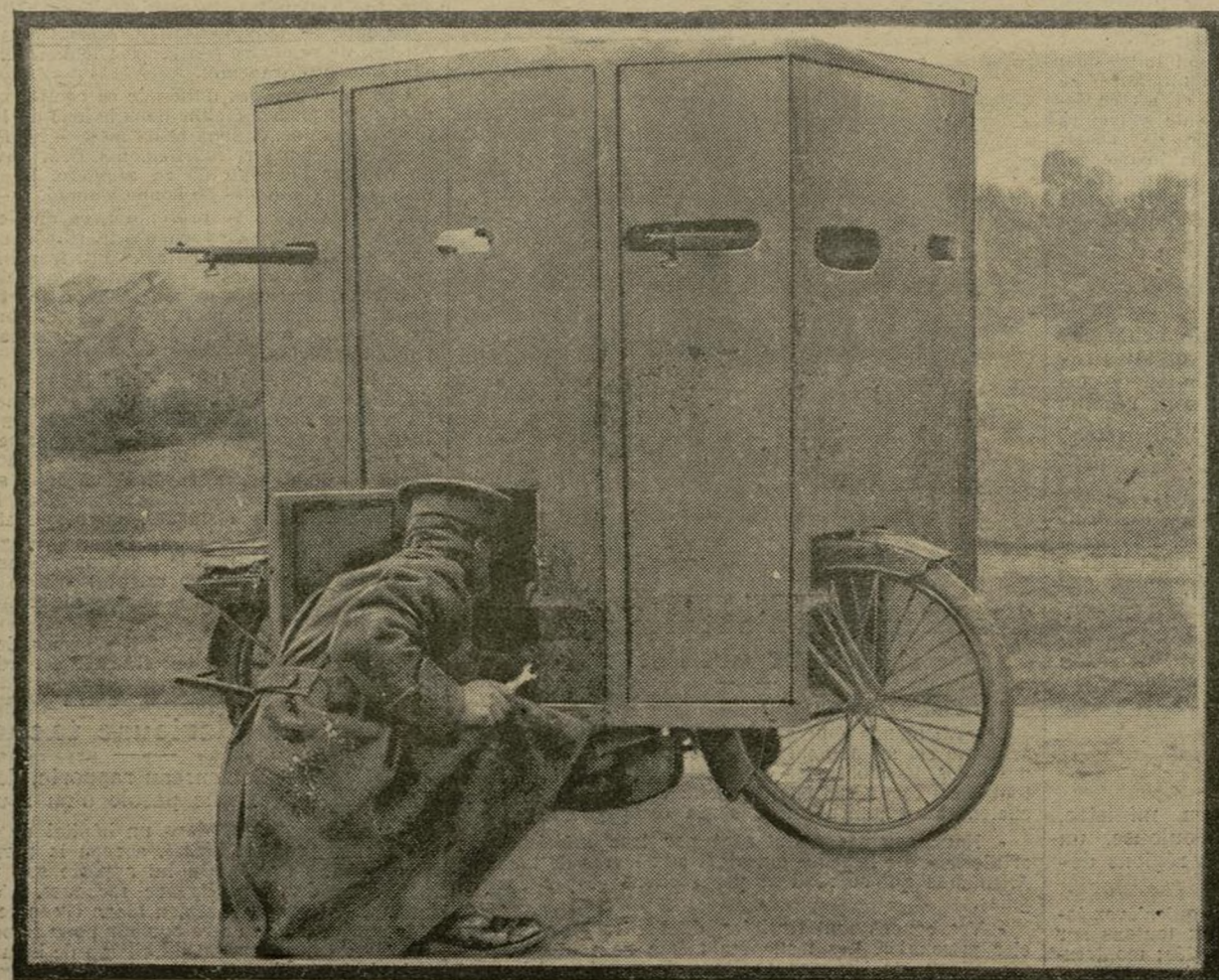
L'armée britannique qui utilise, nous l'avons dit, des voiturettes blindées, emploie encore, pour le service de reconnaissance, des tricars qui, eux aussi, sont protégés contre les balles.