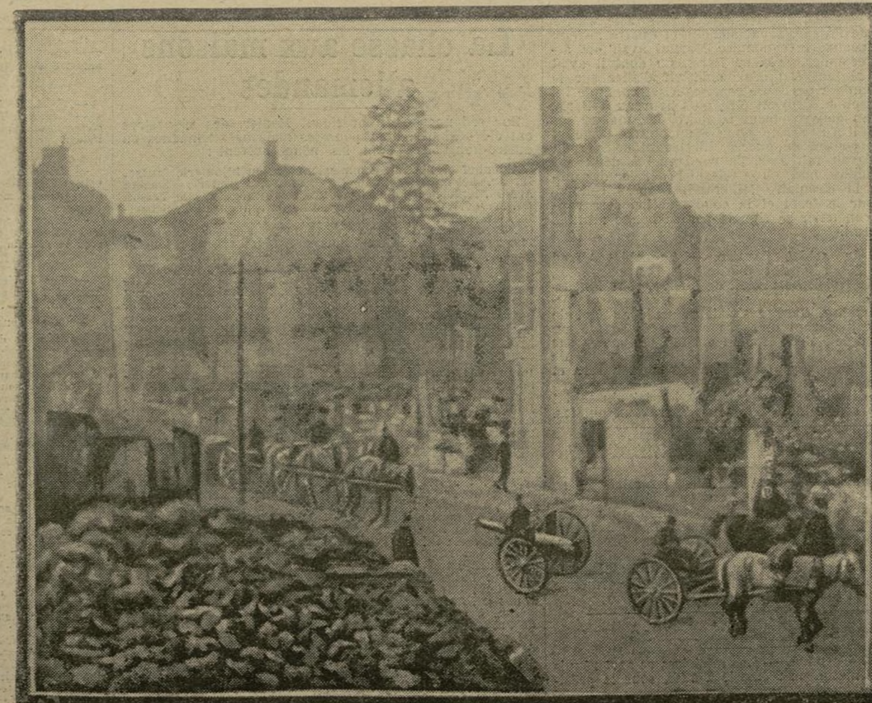
Au cours de sa récente visite aux armées, le président de la République a traversé le village de Clermont-en-Argonne, que les Allemands ont en partie incendié avant de se retirer.