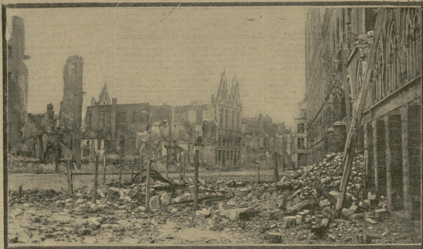
Nous avons relaté les ravages causés à Ypres par les obus allemands. Les Halles sont en partie détruites et certains quartiers ont été complètement incendiés. Nous publierons demain d'autres photographies prises dans cette ville si fortement éprouvée.