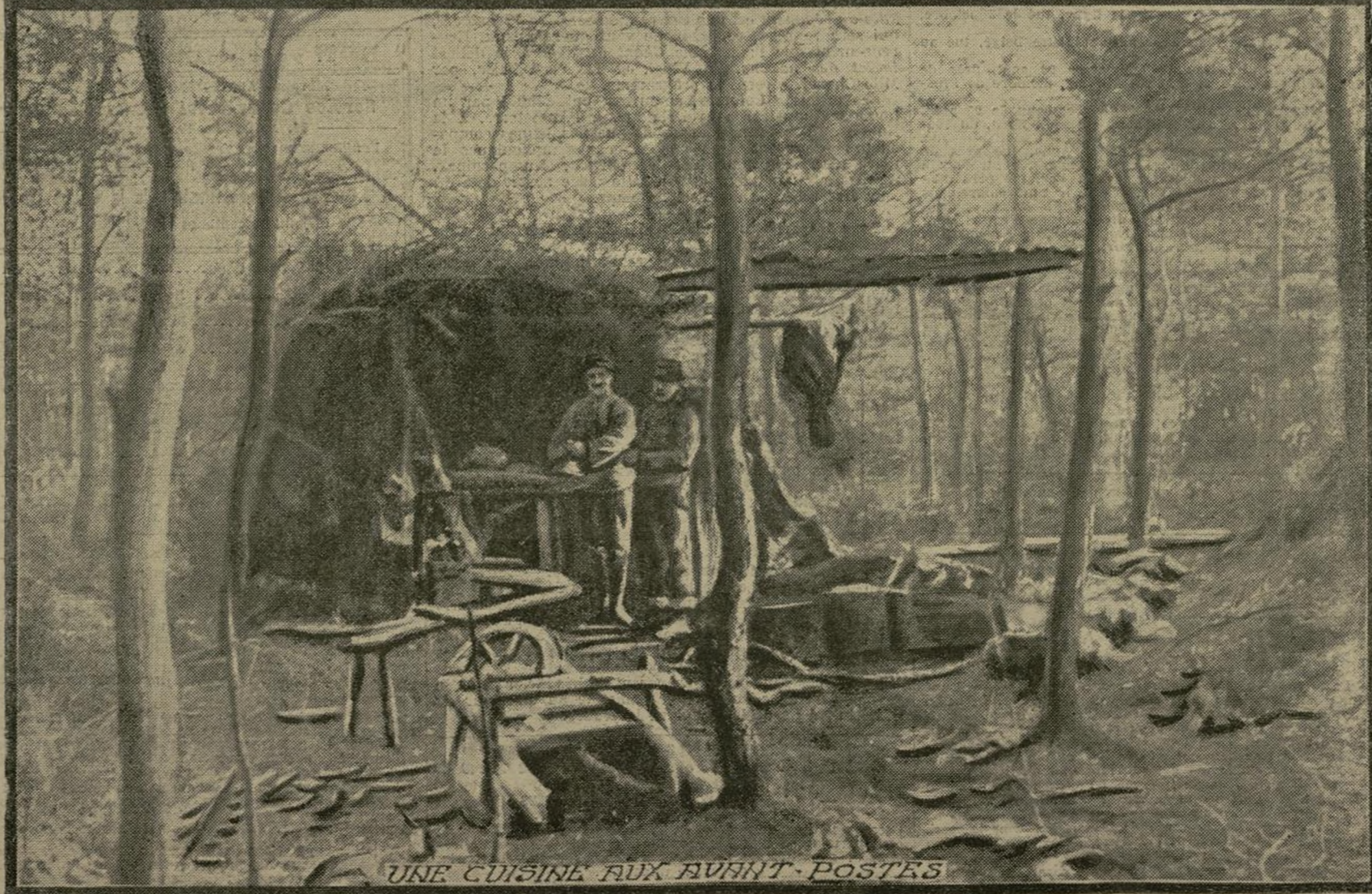
UNE CUISINE AUX AVANT-POSTES

Aux abords de la ligne de feu, certains campements ont tout à fait l'aspect de villages indigènes. C'est, en effet, sous des huttes faites de branchages que nos soldats actuellement aux avant-postes se reposent des longues et dures heures passées dans les tranchées. Ils y ont installé leur cuisine, leurs couchettes, et les téléphonistes leurs appareils. Dans ce cantonnement pourtant bien rudimentaire, nos troupiers vivent toujours gais et pleins d'ardeur en attendant leur tour d'aller combattre de nouveau.