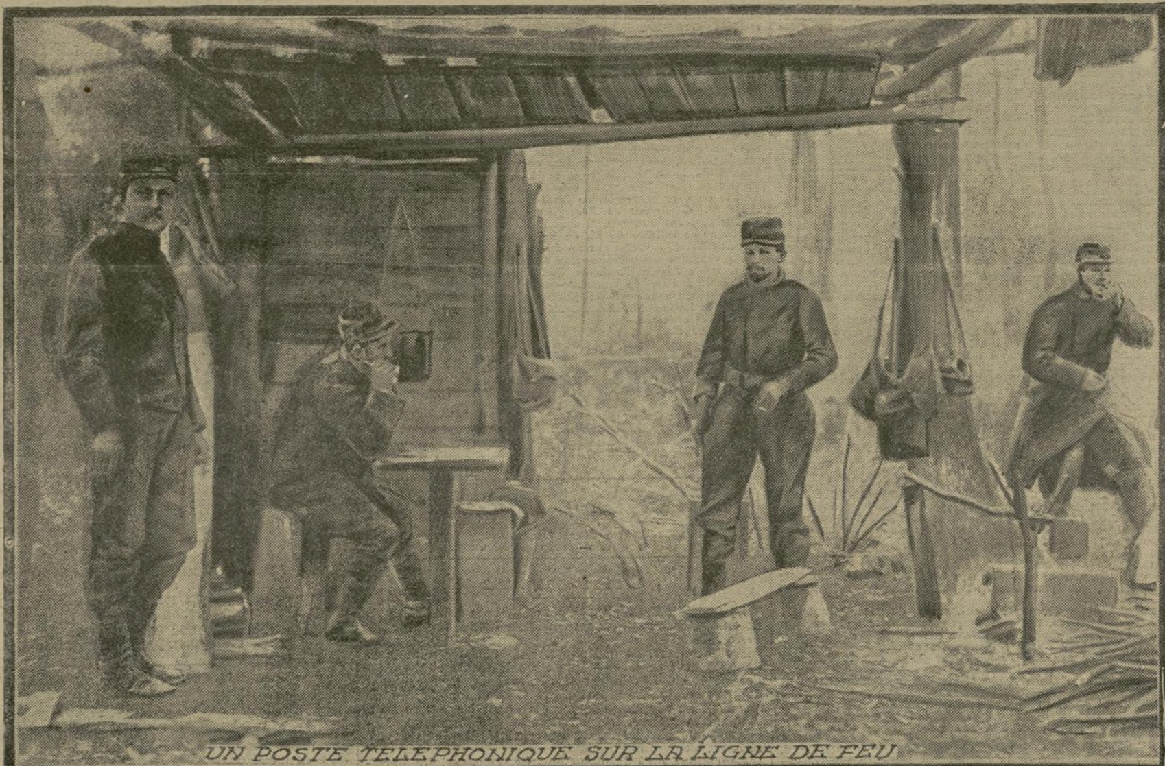
UN POSTE TELEPHONIQUE SUR LA LIGNE DE FEU