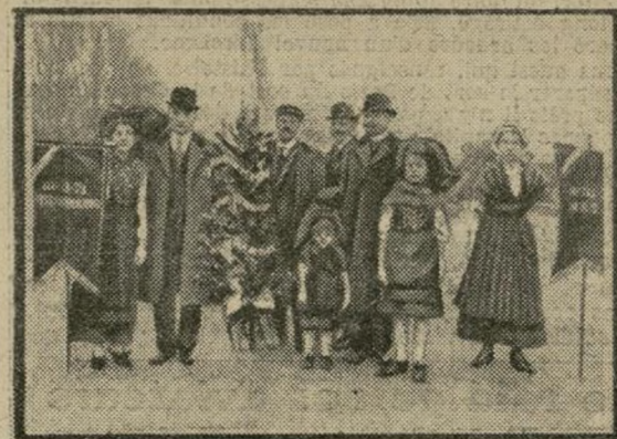
La délégation des Alsaciens-Lorrains