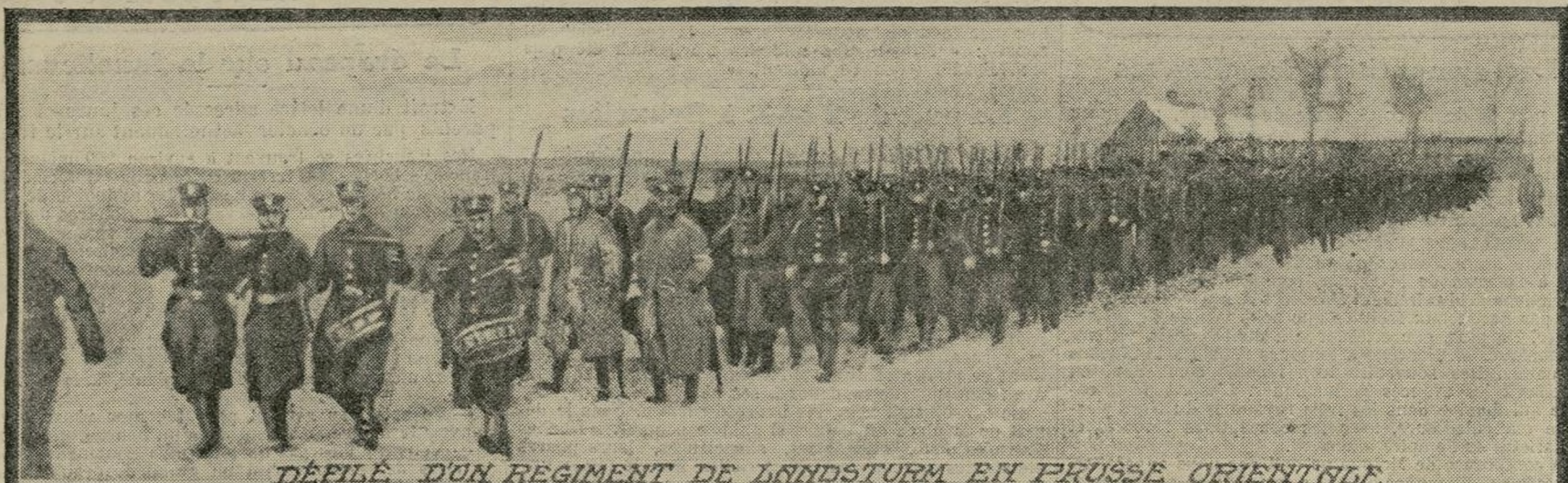
DÉFILE D'UN REGIMENT DE LANDSTURM EN PRUSSE ORIENTALE