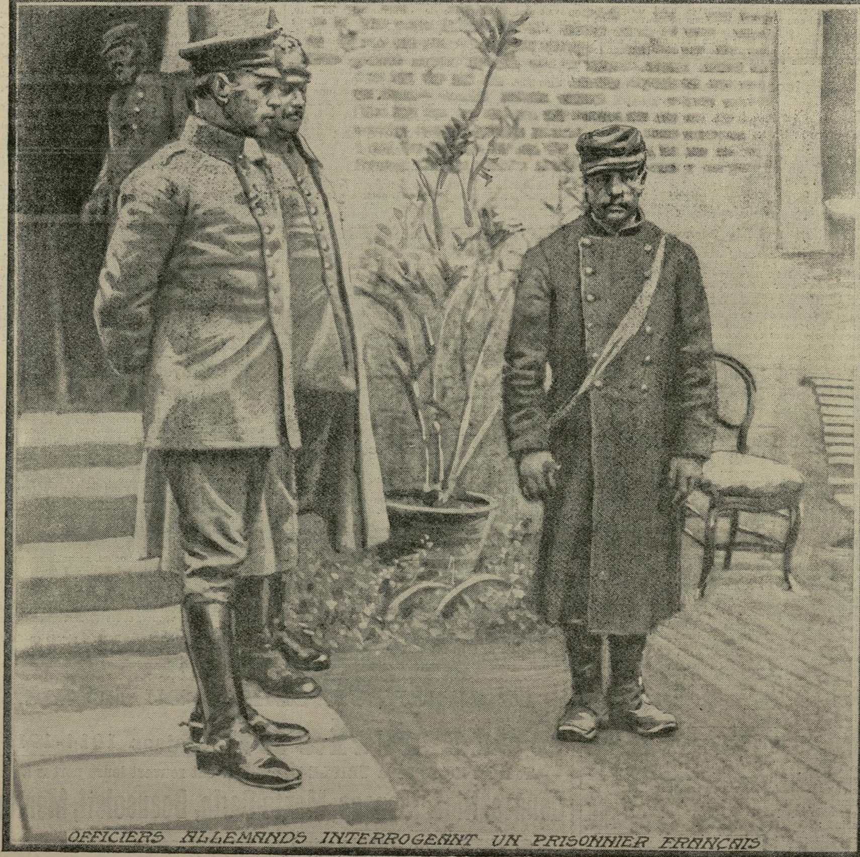
OFFICIERS ALLEMANDS INTERROGEANT UN PRISONNIER FRANÇAIS

Fait prisonnier, alors qu'en compagnie de plusieurs de ses camarades il faisait une patrouille près des lignes avancées de l'ennemi, ce fantassin vient d'être conduit vers l'officier allemand chargé de l'interroger. On le voit ici écoutant les questions qui lui sont posées avant d'être dirigé sur le dépôt où il devra passer sa captivité.