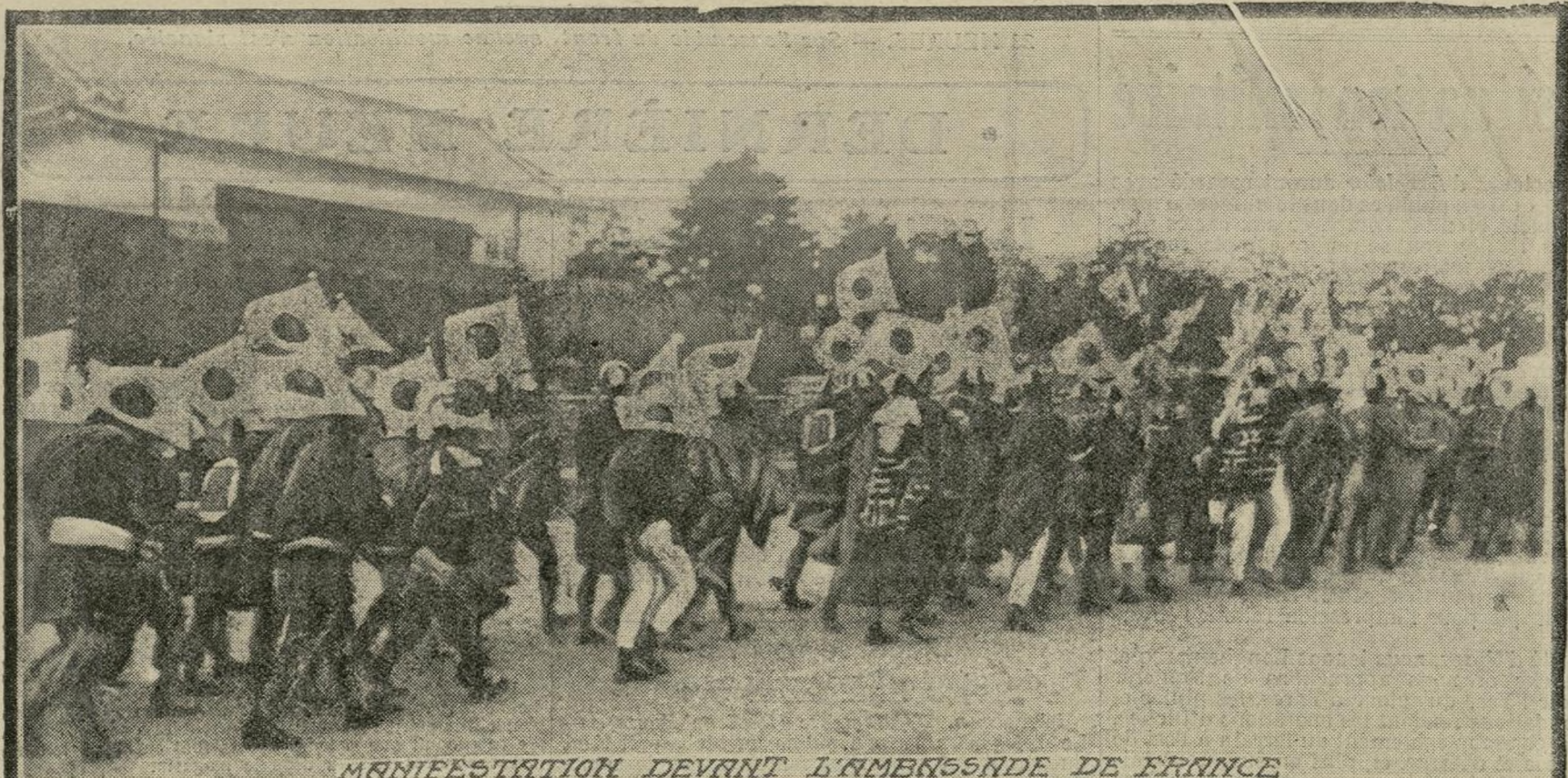
MANIFESTATION DEVANT L'AMBASSADE DE FRANCE