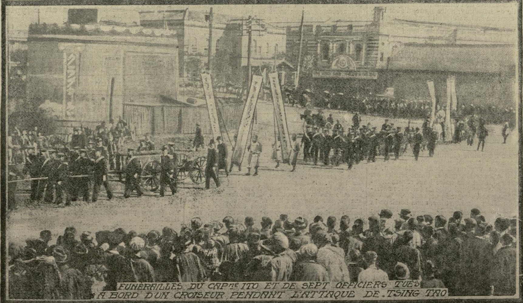
FUNÉRAILLES DU CAPITAINE ITO ET DE SEPT OFFICIERS TUÉS À BORD D'UN CROISEUR PENDANT L'ATTIQUÉ DE TSING TAO

Pendant l'attaque de Tsing-Tao, le croiseur japonais Takachiho fut coulé par les Allemands. Le capitaine Ito, commandant du vaisseau, ainsi que sept officiers, furent parmi les victimes. On fit à ces braves d'imposantes funérailles. Nous donnons ici une photographie prise le jour des obsèques, ainsi qu'une vue de la manifestation patriotique organisée à Tokio en l'honneur de la prise de Tsing-Tao