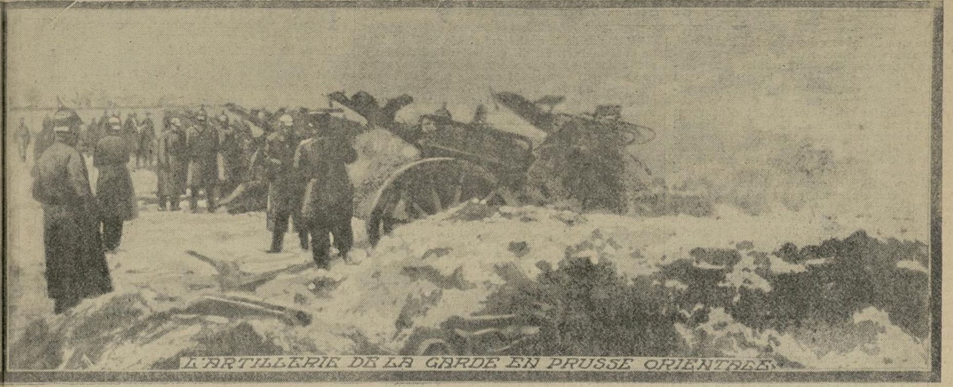
L'ARTILLERIE DE LA GARDE EN PRUSSE ORIENTALE

Les Russes, depuis plusieurs semaines déjà, envahissent la Prusse orientale. Les Allemands, en effet, n'ont pu s'opposer à la marche victorieuse de nos alliés dans cette région. En dépit des rigueurs de la saison qui rendent difficiles les attaques et les assauts, les troupes du tsar vont sans cesse de l'avant et bousculent l'ennemi qui reste aujourd'hui sur la défensive.