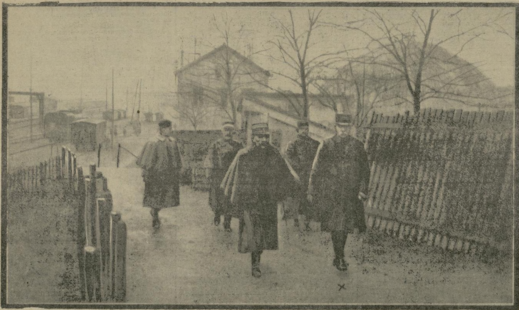
Au cours d'une visite de cantonnements militaires, le général d'Amade (+) a inspecté, ces jours derniers, une gare régulatrice. On voit ici le général, accompagné de son état-major, pendant son inspection.