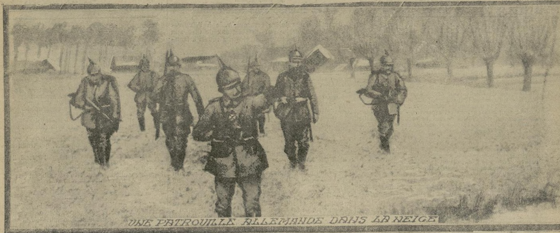
UNE PETROUILLE ALLEMANDE DANS LA NEIGE