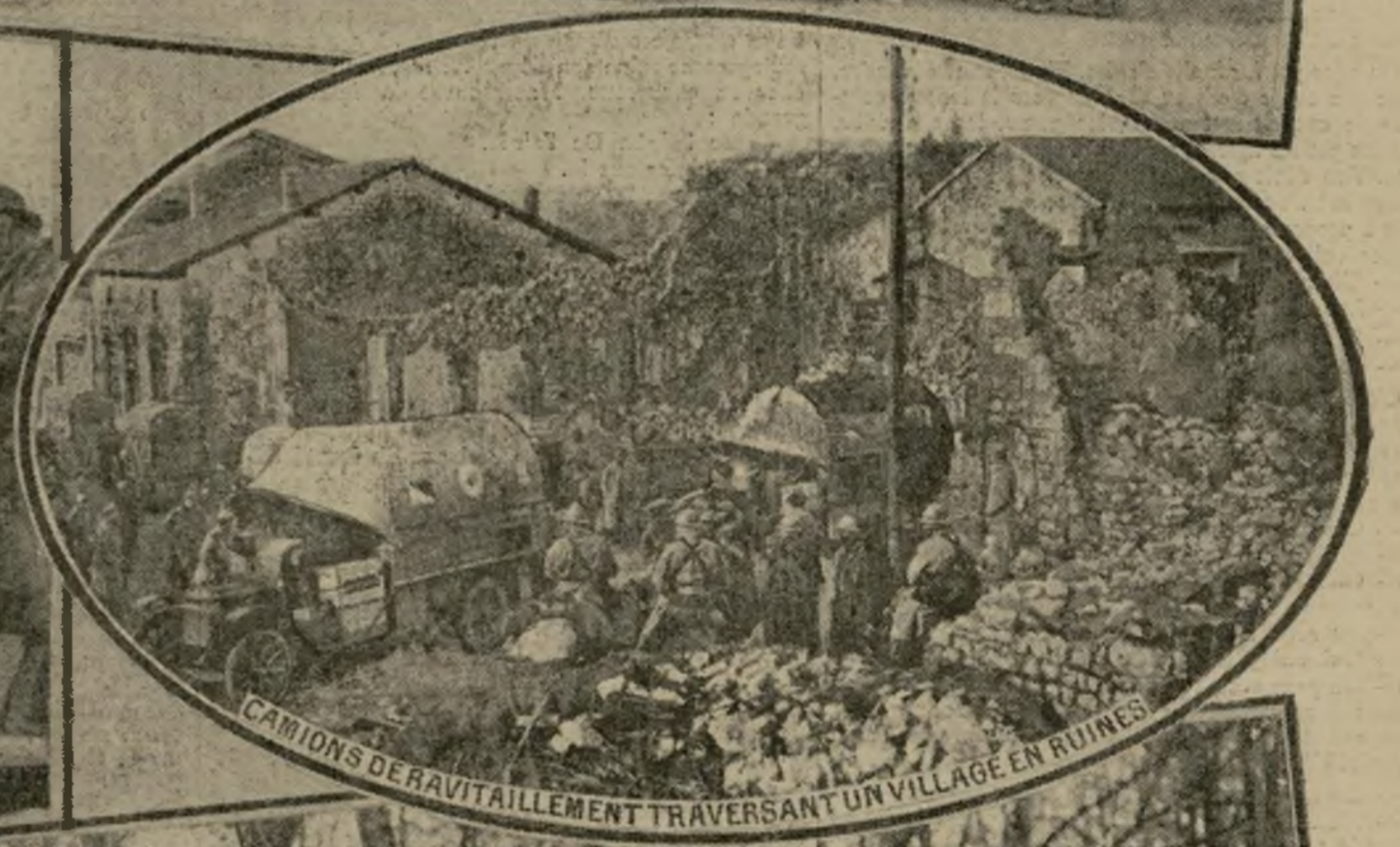
CAMIONS DE RAVITAILLEMENT TRAVERSANT UN VILLAGE EN RUINES