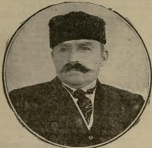
Le défenseur de l'Albanie, arrivé hier à Paris, sera notre hôte pendant quelque temps.