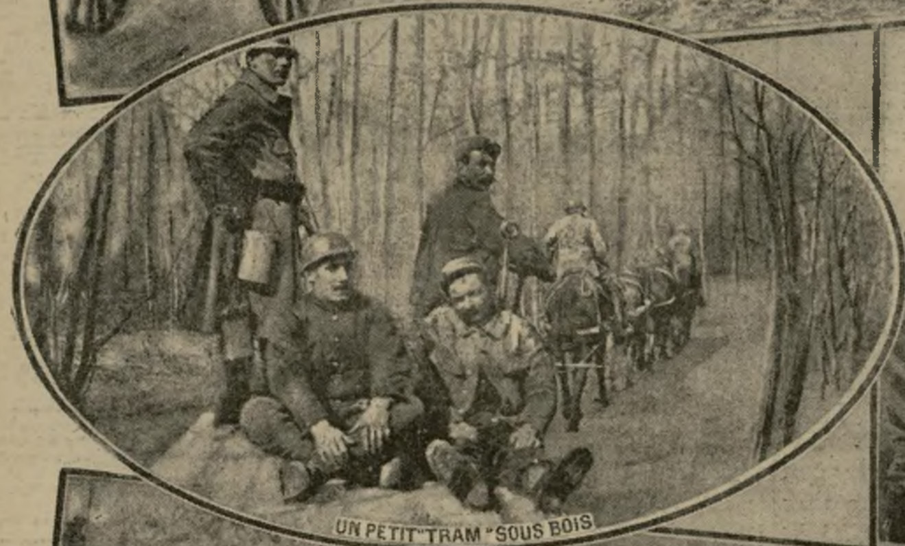
UN PETIT "TRAM" SOUS BOIS