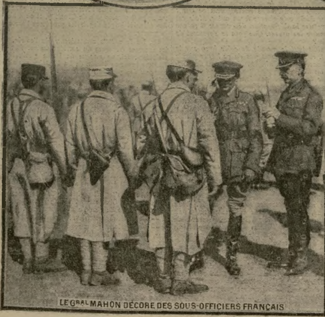
LE GÉNÉRAL MAHON DÉCORE DES SOUS-OFFICIERS FRANÇAIS