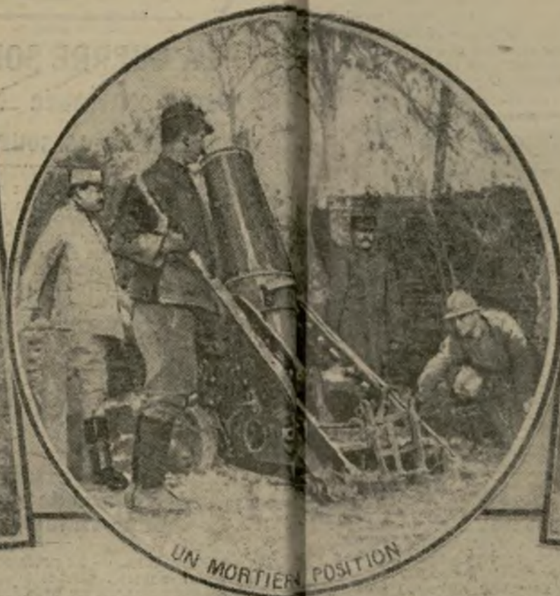
UN MORTIER EN POSITION