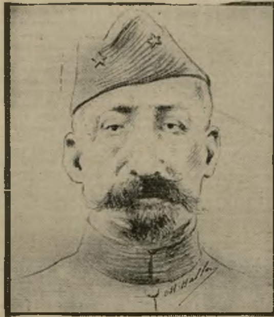
LE GÉNÉRAL DE BAZELAIRE

Est inscrit au tableau spécial de la Légion d'honneur pour commandeur :