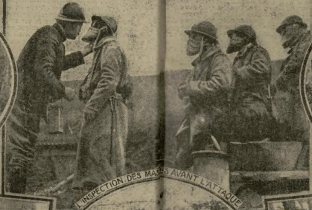
L'INSPECTION DES MATÉRIELS AVANT L'ATTAQUE