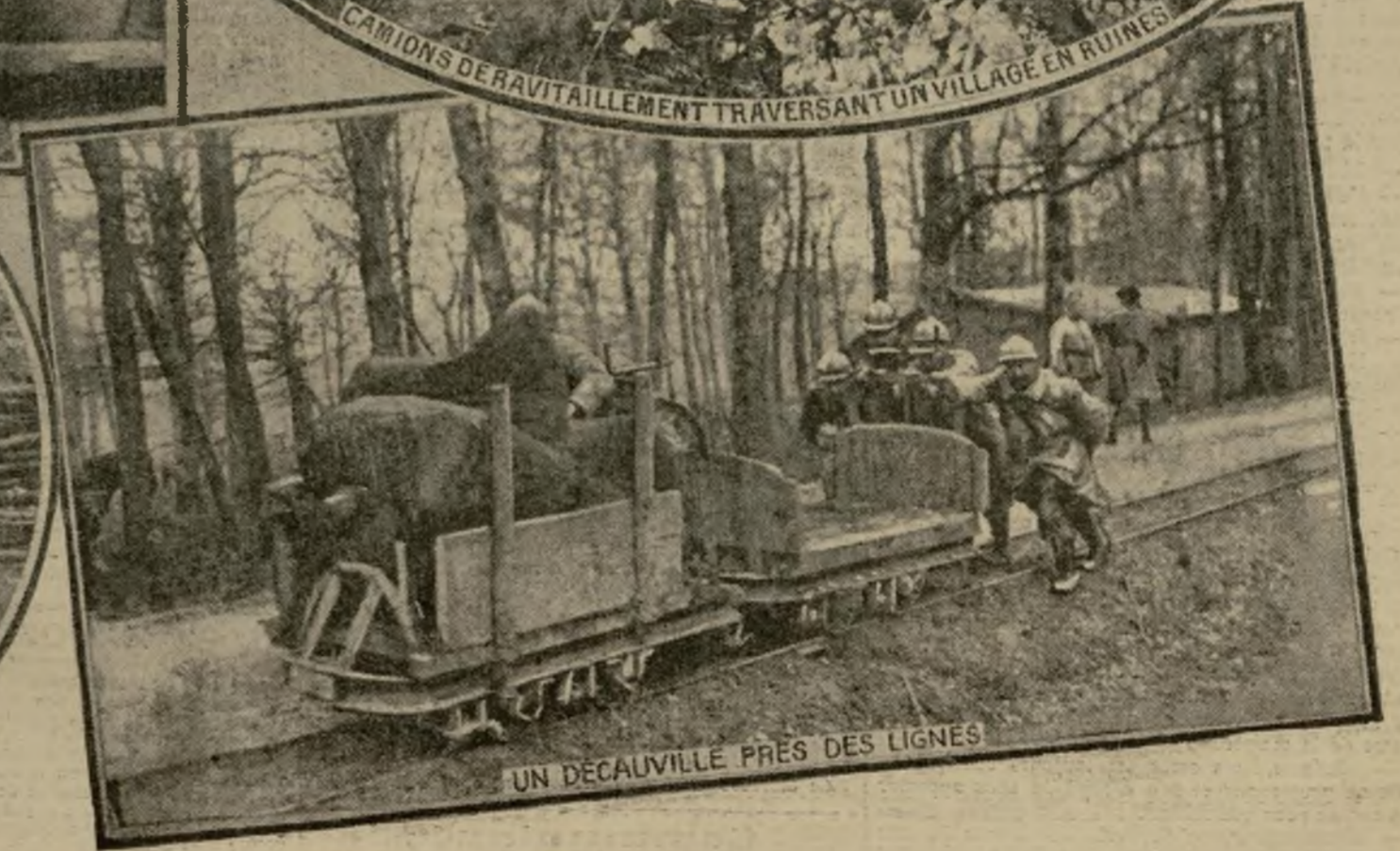
UN DÉCAUVILLÉ PRÈS DES LIGNES

La grande bataille dont la cité meusienne est le prix a des répercussions fort lointaines. La plus intense activité règne dans les secteurs voisins du terrible volcan, et soit en Alsace, soit en Champagne, les ravitaillements de toutes sortes se font incessants,