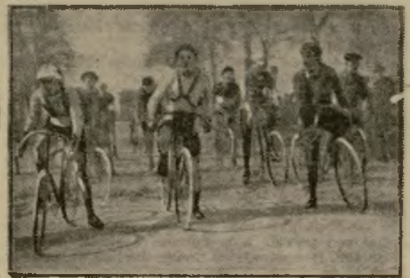
Le petit brevet de l'U. V. F. — Le départ.

Le Brevet militaire de l'U.V.F. — L'Union Vélocipédique de France a fait disputer, hier après-midi, sa première épreuve pour l'obtention du brevet militaire de 50 kilomètres.