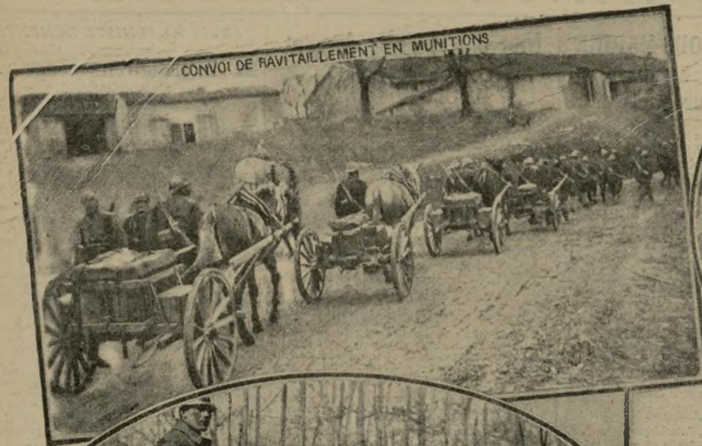
CONVOI DE RAVITAILLEMENT EN MUNITIONS