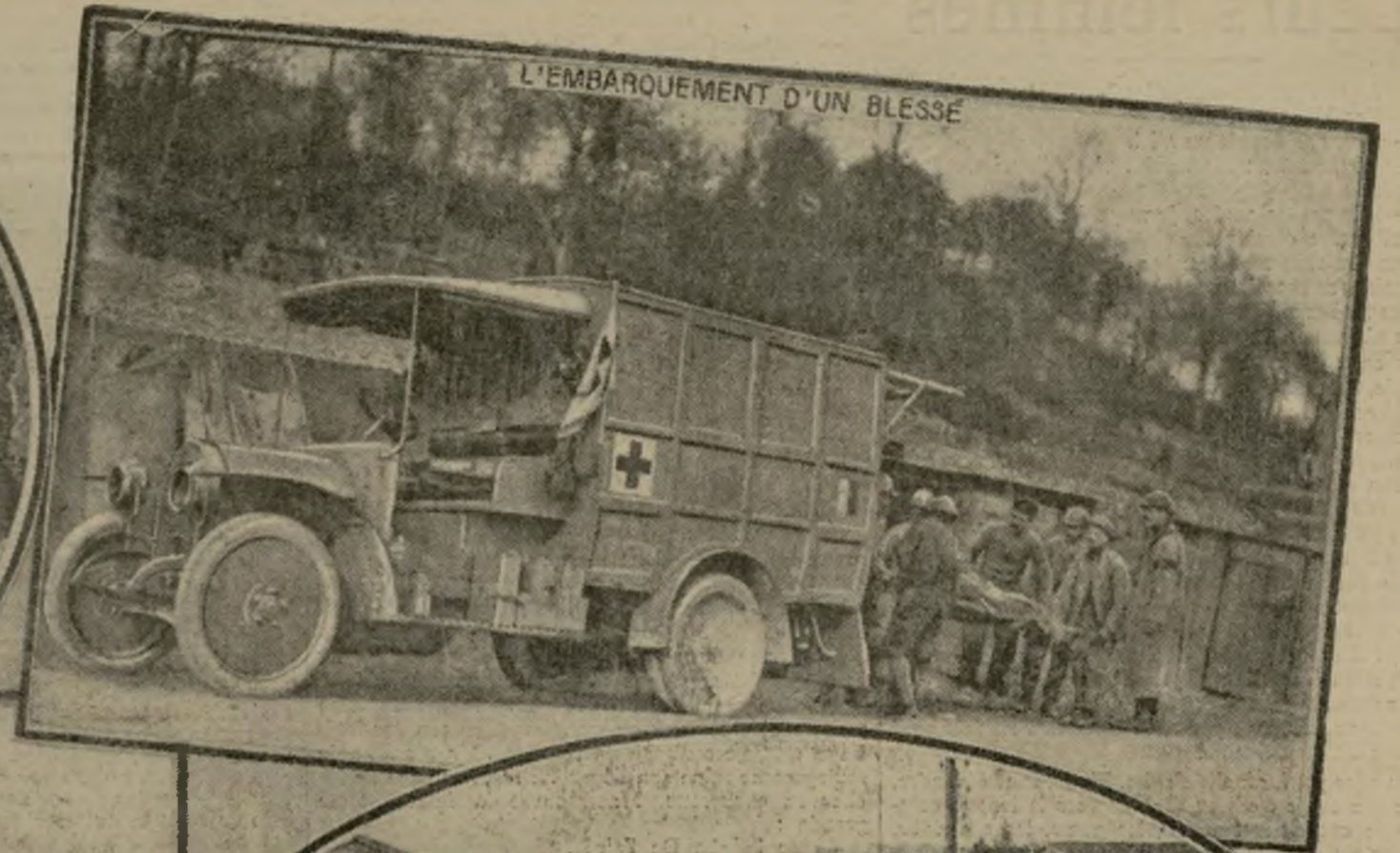
L'EMBARQUEMENT D'UN BLESSÉ