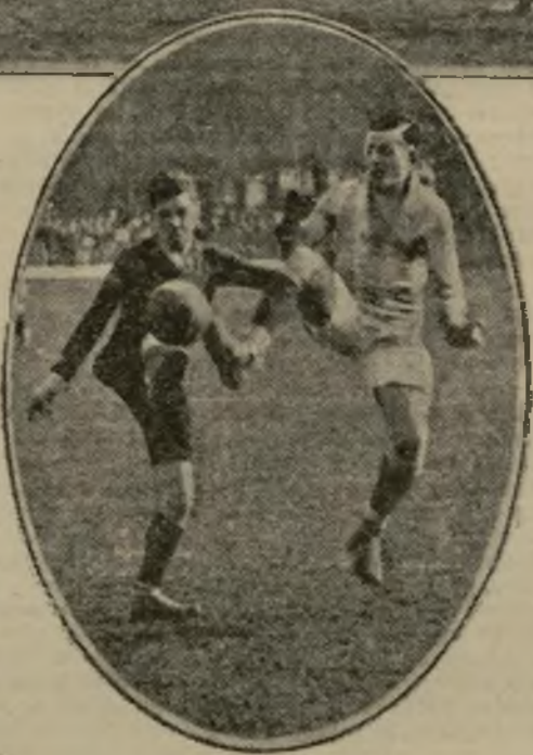
C.A.S.G. contre A.S.F. — Le C.A.S.G. gagne par 4 buts à 3.

Un très nombreux public s'était rendu à Auteuil