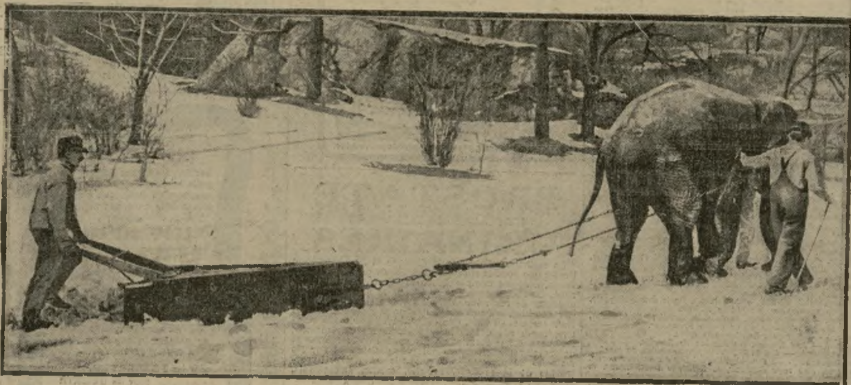
Dans le Central Park de New-York, où l'hiver inclement avait accumulé la neige, des éléphants, il y a encore peu de temps, traînaient des « racoires » qui refoulaient le tapis blanc et permettaient de rétablir la circulation des piétons dans les allées.