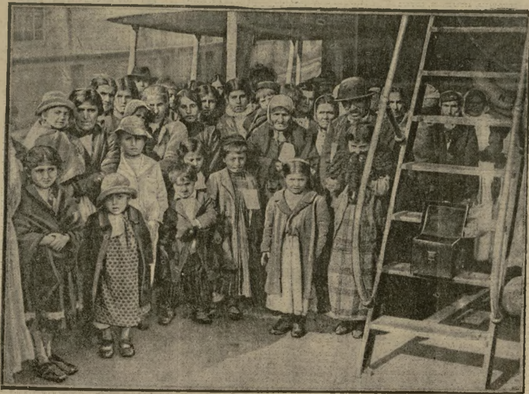
Harcelés, poursuivis par les Turcs, un certain nombre d'Arméniens purent échapper au massacre et femmes et enfants être recueillis par un croiseur français, sur la côte de Syrie, ainsi que par un paquebot italien. Voici quelques-uns de ces malheureux persécutés qui ne purent joindre le rivage qu'après les pires épreuves et qui ont été transportés à Port-Saïd, où ils ont reçu les soins les plus affectueux, notamment de la part des membres d'un comité américain.