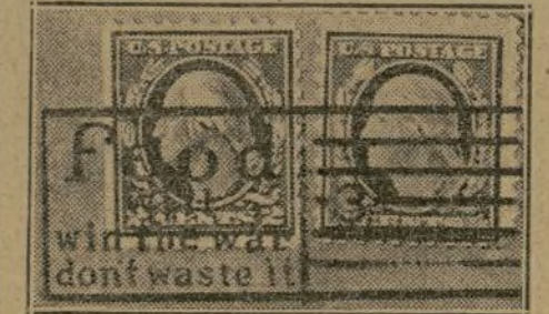
L'EXEMPLE A SUIVRE

Le gouvernement américain utilise les empreintes postales pour le plus grand bien de sa propagande. C'est ainsi qu'il avait imaginé d'oblitérer les vignettes postales avec cette mention : « S'inscrivez à l'Empire ». Nous avons adapté. Nous aurions mieux fait d'imiter, car nous avions conservé le timbre humide habituel et ajouté un autre timbre pour la sollicitation.