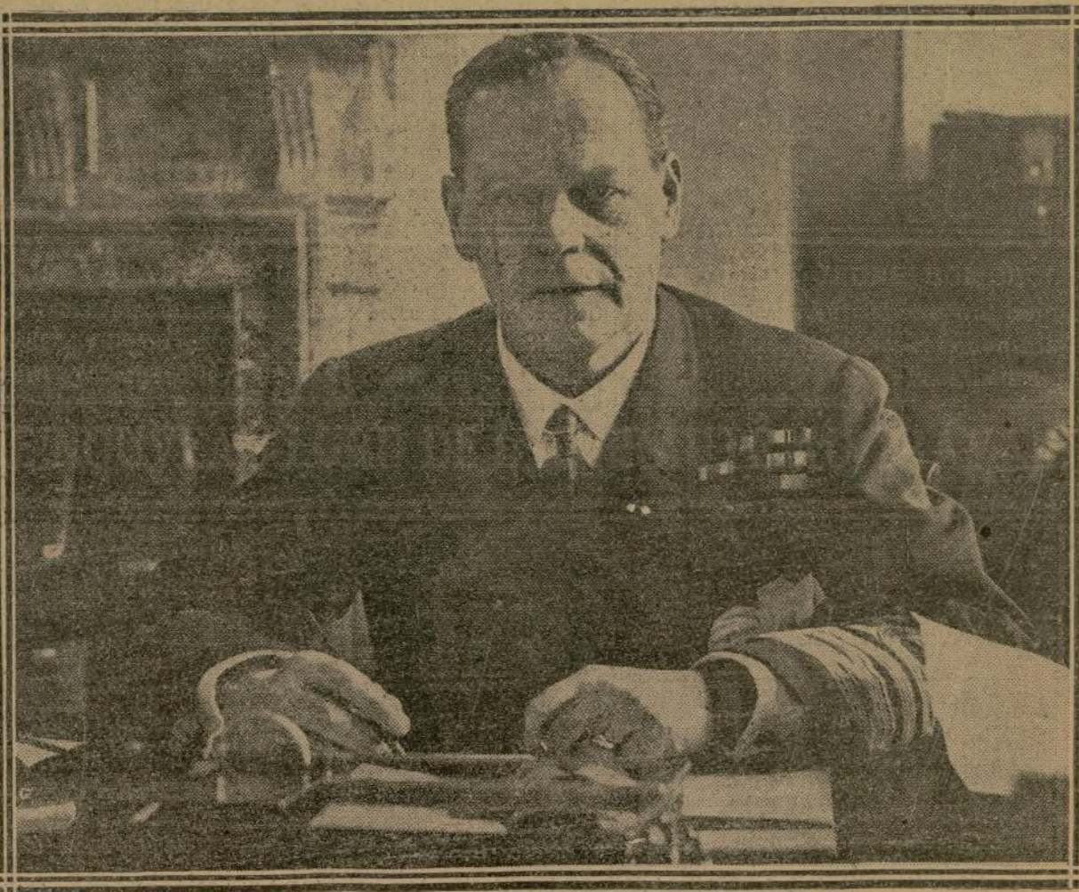
SIR ROSSLYN WEMYSS PHOTOGRAPHIÉ A SON BUREAU

Le successeur de l'amiral Jellicoe, qui est âgé de cinquante-trois ans, est arrivé d'Ecosse pour prendre possession de ses nouvelles fonctions. C'est un homme d'une rare énergie et d'une activité ordonnée. Le voici à sa table de travail, dans son cabinet de l'Amirauté.