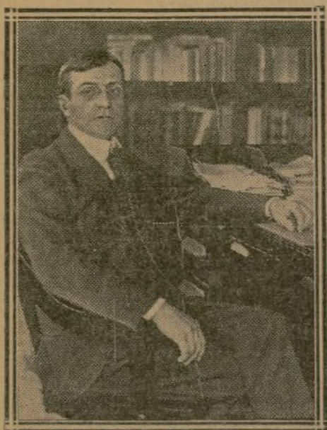
M. BAKER ministre de la Guerre des Etats-Unis

Au 1 er janvier 1918, l'armée des Etats-Unis comptait déjà 1 million 428 000 hommes d'effectifs.