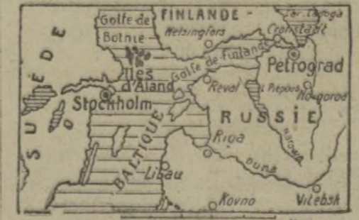
Stockholm, 3 mars. — Officiel. — Par ordre de son gouvernement, le ministre d'Allemagne à Stockholm a porté à la connaissance du ministre des Affaires étrangères que l'Allemagne avait l'intention d'envoyer, sur la demande du gouvernement finlandais, des troupes en Finlande pour réprimer la révolte qui y règne et que ces troupes, du consentement de la Finlande, se serviraient au cours de leurs opérations, aussi des îles d'Aland. Afin de ne pas entraver l'accomplissement de la tâche humanitaire assumée par la Suède, relativement aux îles d'Aland, l'Allemagne se limiterait cependant à utiliser ces îles pour y organiser une étape nécessaire à l'expédition militaire.

Il a de même été assuré que l'Allemagne n'a point d'intérêt territorial dans les îles et que la question des îles d'Aland devait, par égard pour les intérêts vitaux de la Suède, relativement aux îles, être réglée dans une entente étroite avec ce pays.