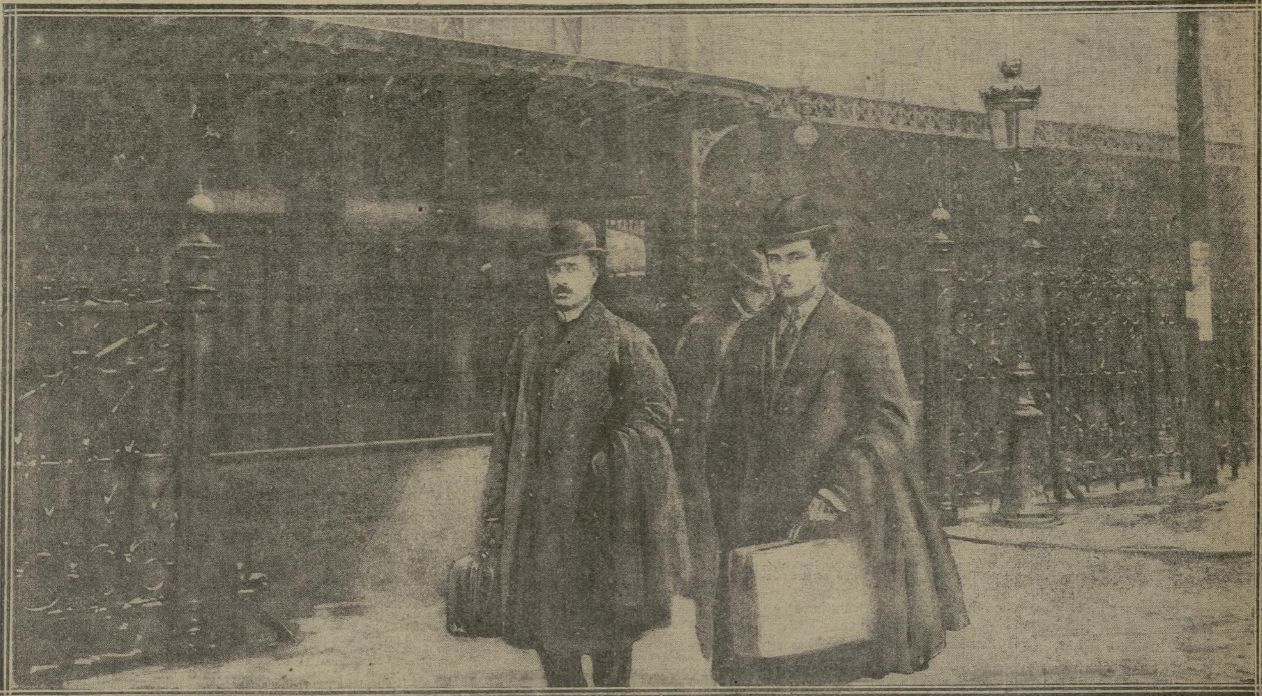
PHOTOGRAPHIE PRISE HIER, SOUS LA NEIGE, A 6 HEURES 10 DU MATIN A LA SORTIE DE LA GARE DU NORD