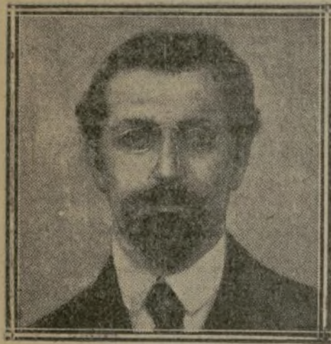
M. KARAKHAN Député russe à Brest-Litovsk

Dans des conditions pareilles, le gouvernement roumain, carné de toutes parts, a dû se résigner à reprendre les pourparlers sur les bases draconiennes posées par les puissances centrales.