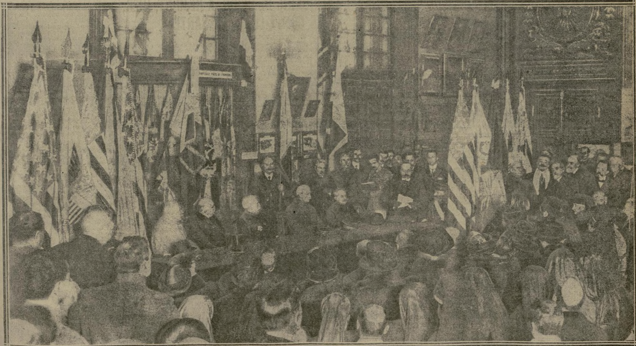
LA CÉRÉMONIE A EU LIEU HIER MATIN, A ONZE HEURES, DANS LA SALLE D'HONNEUR DU MUSÉE DE L'ARMÉE

Ce sont les drapeaux nationaux et les étendards propres aux 6 e , 9 e , 10 e et 11 e régiments d'infanterie et au 4 e régiment d'artillerie des États-Unis — car chaque régiment a son étendard particulier — qui ont été remis hier au général Lewis, représentant le général