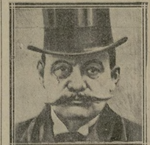
LE PRINCE DE RATIBOR

Lorsque ce premier interrogatoire eut pris fin, l'antiquaire fut conduit à la prison de la Santé, où une cellule lui avait été préparée à proximité de celles de ses complices.