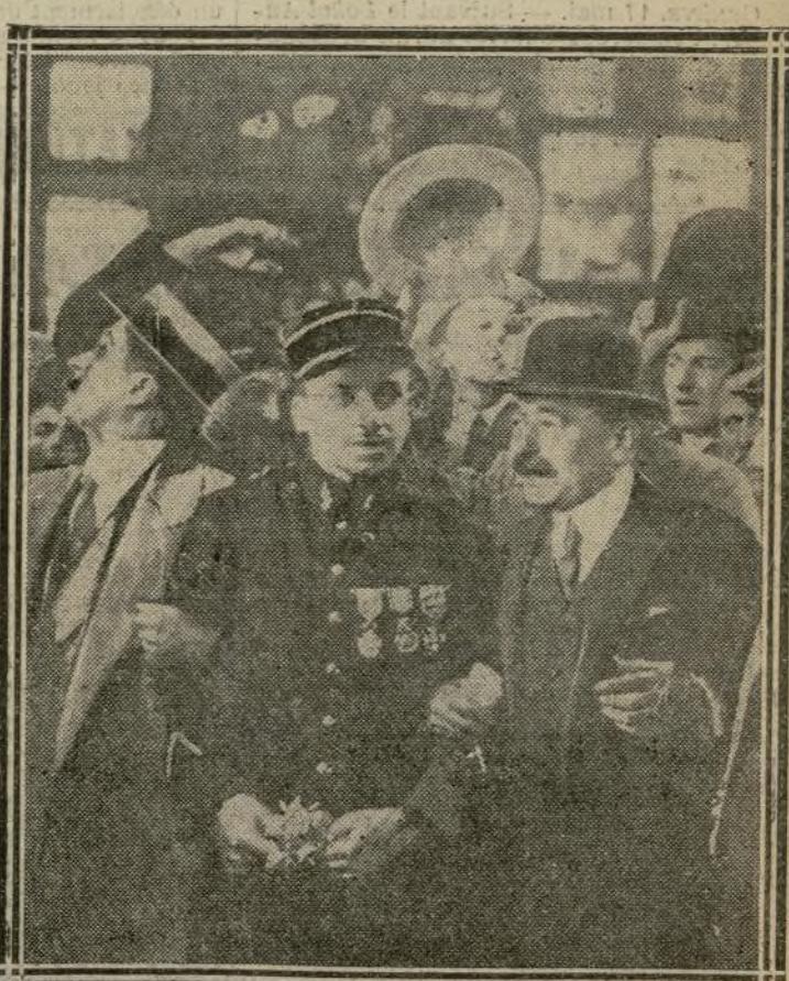
LE RETOUR DU PRISONNIER ÉVADÉ