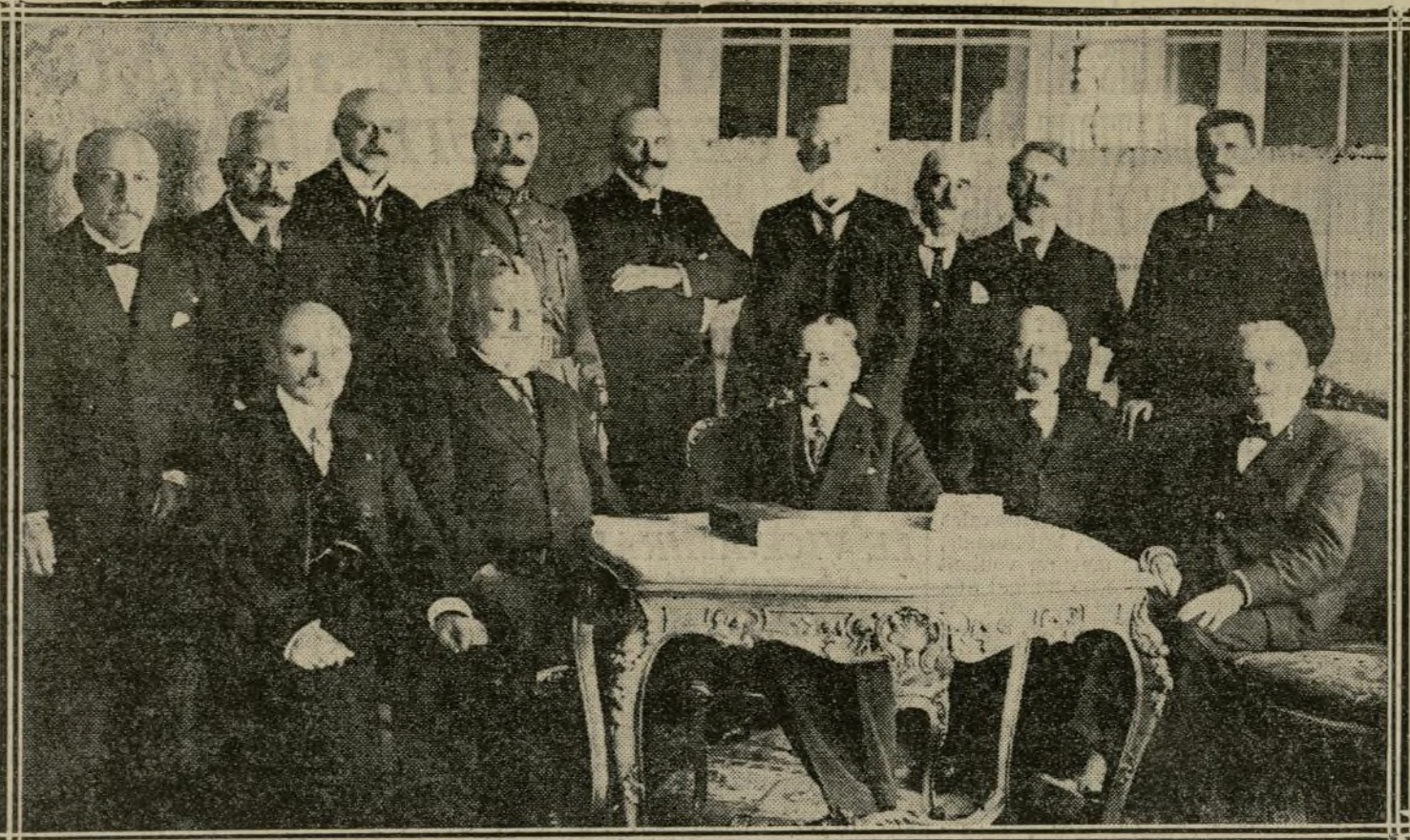
PHOTO PRISE LE 15 MAI DANS LA VILLA DE M. DE BROQUEVILLE, CHEF DU CABINET

Sont debout, de gauche à droite : MM. Hubert, Industrie et Travail ; Berryer, Intérieur ; Van de Vyvere, Finances ; général de Ceuninck, Guerre ; Carton de Wiart, Justice ; Goblet d'Alviella, ministre d'Etat ; Hymans, ministre des Affaires étrangères ;