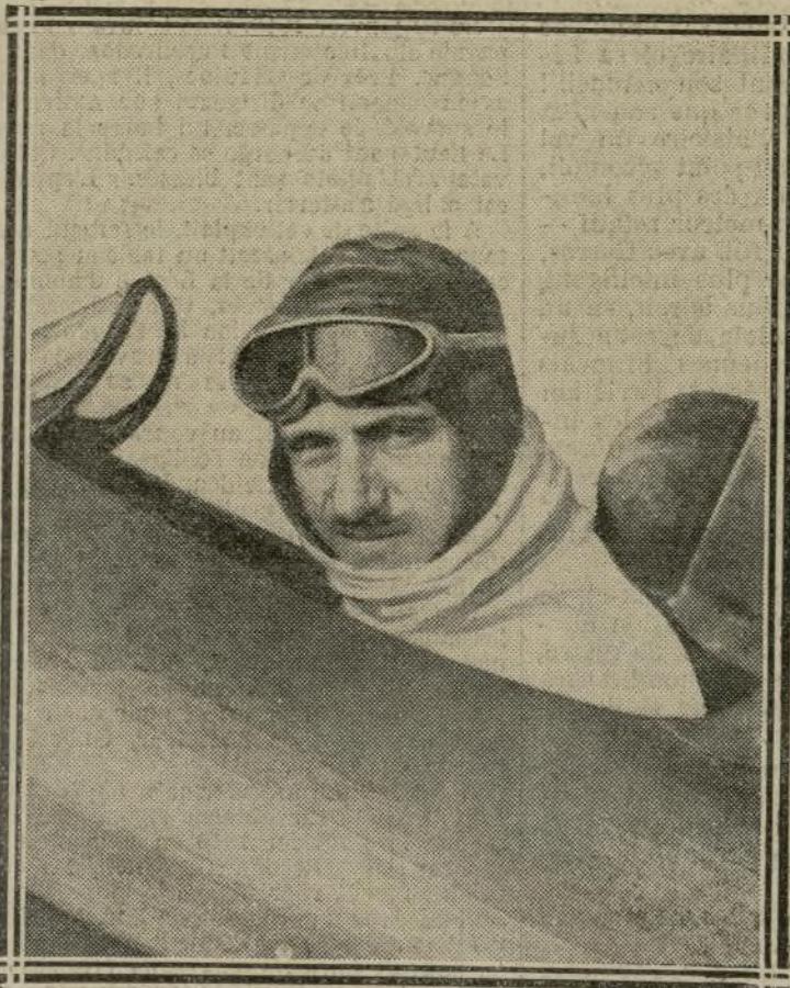
GILBERT EN CHASSEUR DE RECORDS