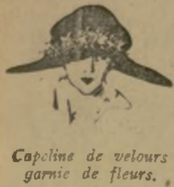
Capeline de velours garnie de fleurs.

Nous sommes à la saison où, dans les maisons de couture, s'élaborent les modèles d'automne et d'hiver, et, déjà, on peut presque pressentir ce que sera la mode prochaine. Dans une maison nouvelle des Champs-Élysées, j'ai vu les modèles en préparation, et je puis vous assurer qu'on essaye de garder à la femme sa « ligne souple ». Ce n'est plus la robe chemise (il nous faut bien changer), mais ce n'est pas non plus la crinoline, ou les laïtons, ou les corbeaux. Si quelque chose devait servir de thème à l'inspiration nouvelle, c'est dans la draperie antique qu'il faudrait la chercher. Mais je crois que je commets une indiscretion un peu prématurée en vous dévoilant ceci, et je m'arrête... — JEANNE FARMANT.