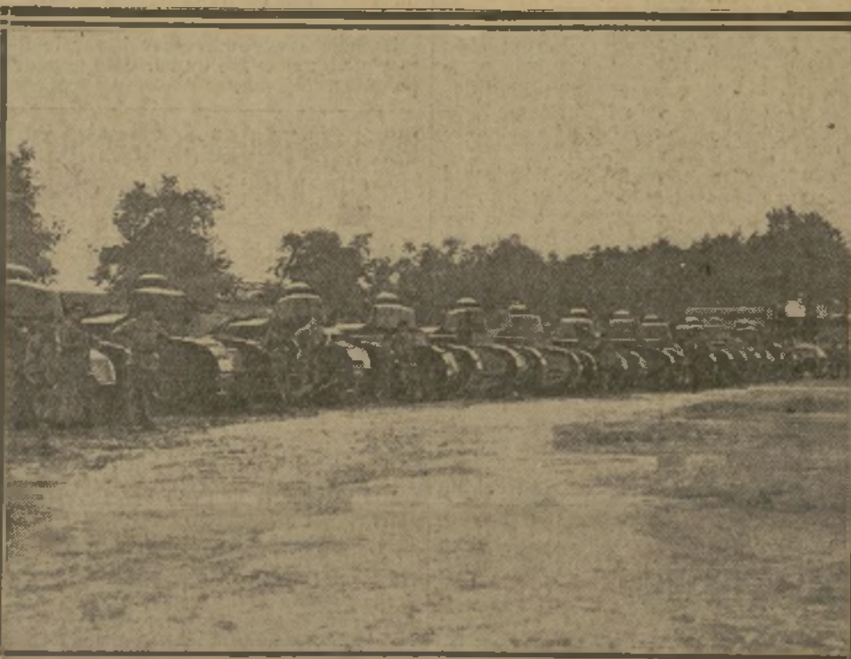
TANKS EN RÉSERVE PRÊTS A APPAREILLER