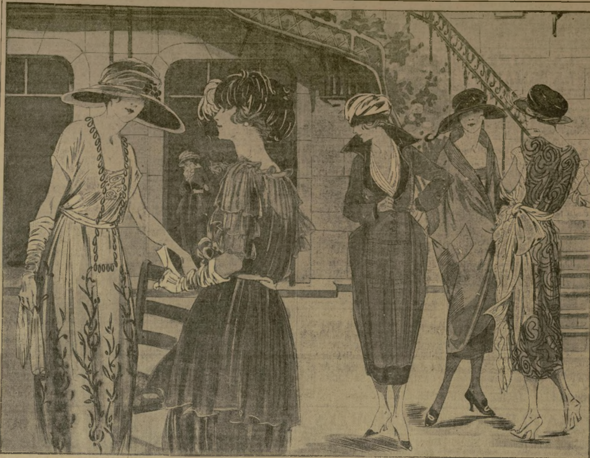
Robe de satin blanc brodée d'une teinte un peu plus foncée. — DOUCET. Robe de mousseline de soie havane serrée dans une ceinture de ruban. — REDERN. Robe de shantung bleu et satin noir. Gilet d'organdi blanc. — DOUCET. Cape de taffetas marine garnie de petites ganses de soie. — MARTEL ET ARMAND. Robe de crêpe Georgette gris brodée noir. Ceinture de ruban gris. — JENNY.