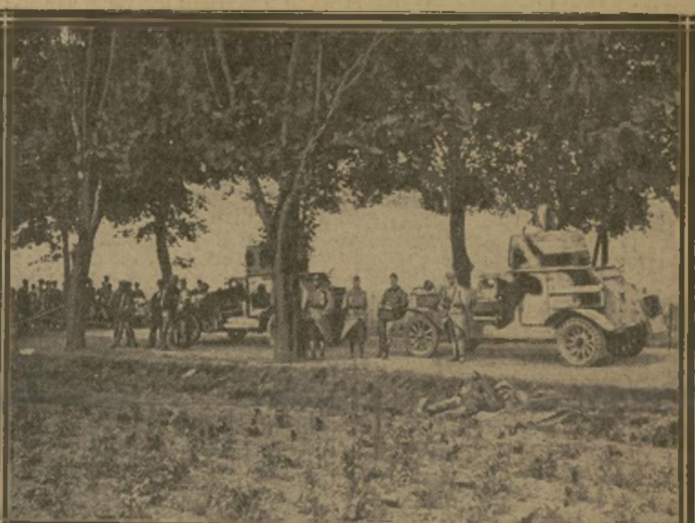
DERNIER POSTE AVANCÉ SUR LA ROUTE DE FRANCFORT