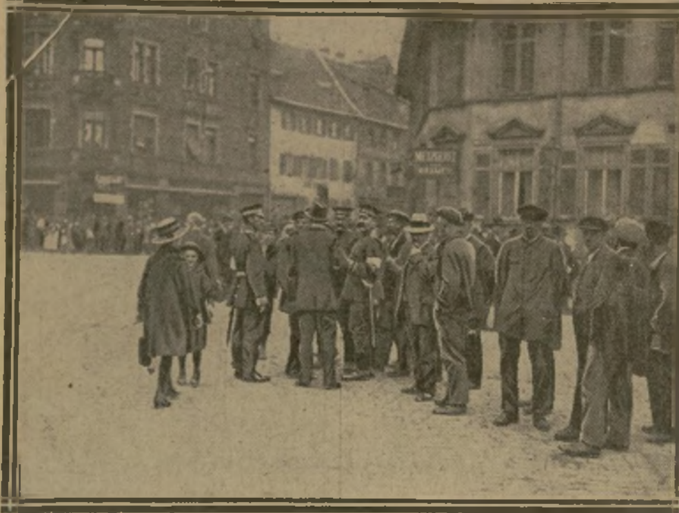
A HOECHST, LA POLICE INVITE AU CALME

Le succès de la plu- part des choses dé- pend de savoir combien de temps il faut pour réussir. MONTESQUIEU.