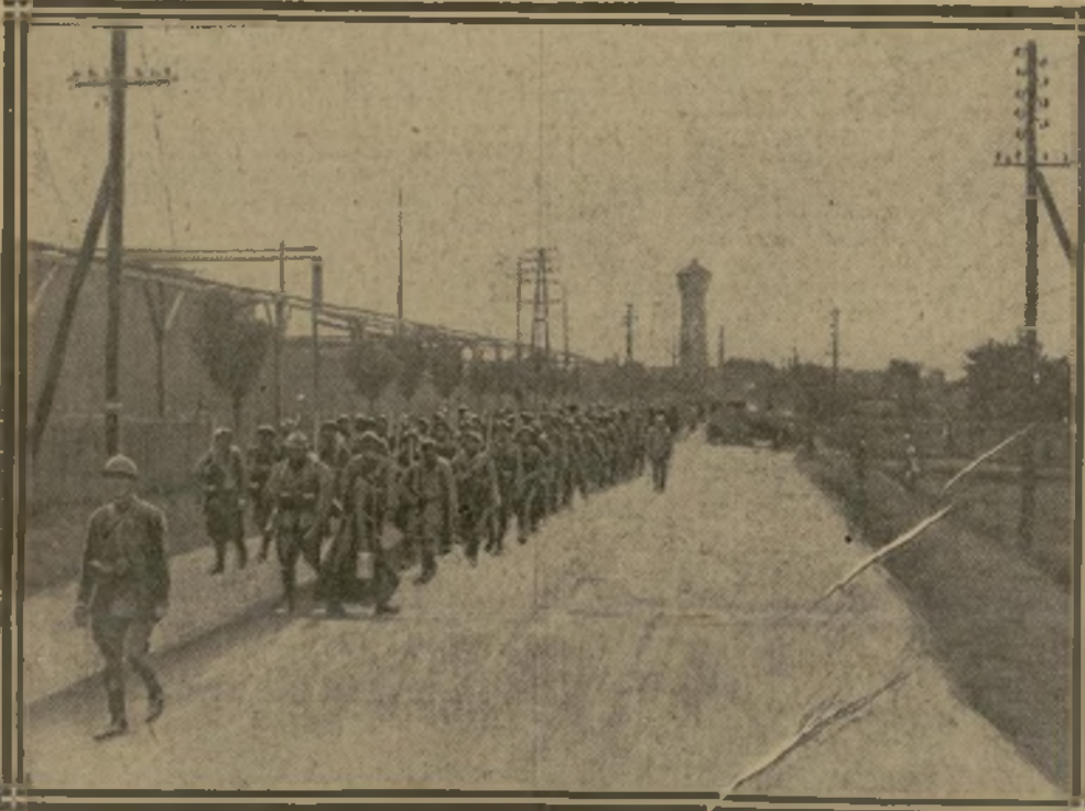
TIRAILLEURS SÉNÉGALAIS SUR LA ROUTE DE HOECHST