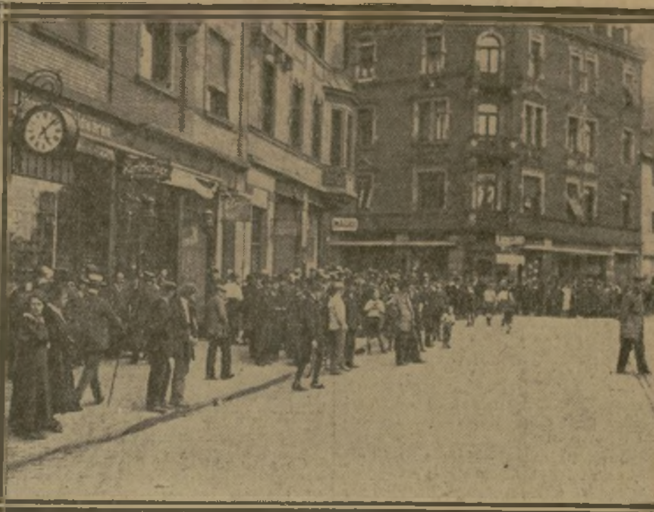
LA FOULE ATTENDANT LE PASSAGE DE NOS TROUPES