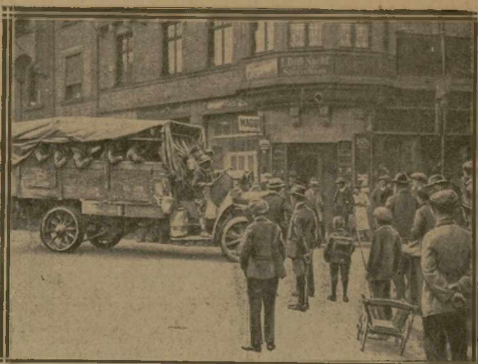
NOS TROUPES GAGNENT LES AVANT-POSTES