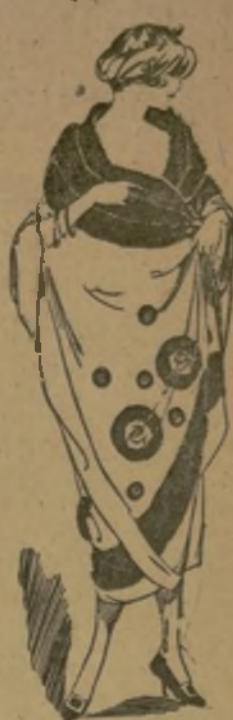
Cape de tricot blanc brodé rose.

En voici une que j'ai vue l'autre jour chez Péron. Vous la voyez ici croquée à votre intention. Rien d'étonnant à ce qu'elle se drappe avec souplesse, car elle est faite d'un jersey de soie blanc à grosses mailles, qui tombe en plus lourds. Elle est garnie avec beaucoup d'originalité d'une grosse broderie marocaine en laine de plusieurs tons vieux rose. Cette broderie a un peu l'aspect d'une grosse peluche de laine et fait un très joli effet sur le blanc du jersey. Le grand col châle en est entièrement recouvert, et une large bande de cette broderie contourne le manteau. Des rosaces de différentes grosseurs et de tons dégradés complètent la garniture. Cette jolie cape semble le manteau rêvé pour la plage, l'auto et les villes d'eaux. — J. F.