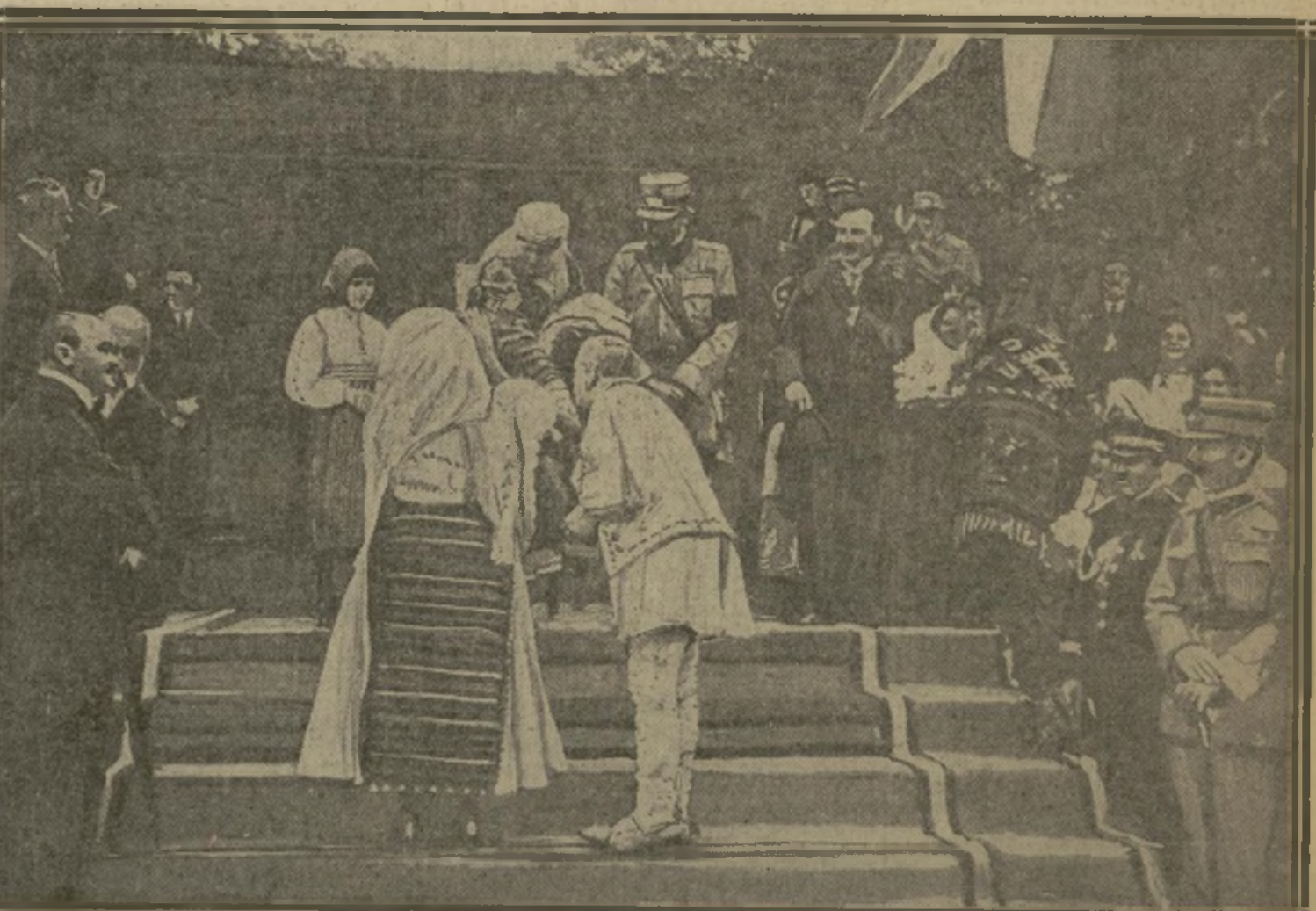
DES PAYSANS OFFRENT DES CADEAUX A LA REINE, A ALBA-JULIA