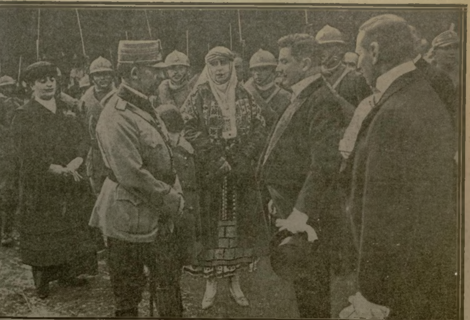
LE MAIRE PRONONCE SON DISCOURS, A COPZA-MICA

Les souverains roumains viennent d'accomplir un voyage, qui fut pour eux un véritable triomphe, dans les territoires nationaux reconquis en Transylvanie. Partout ce furent des fleurs, des cadeaux, des discours, aussi, où le peuple, par la voix de ses représentants, donnait tout son cœur au couple royal, identifiant