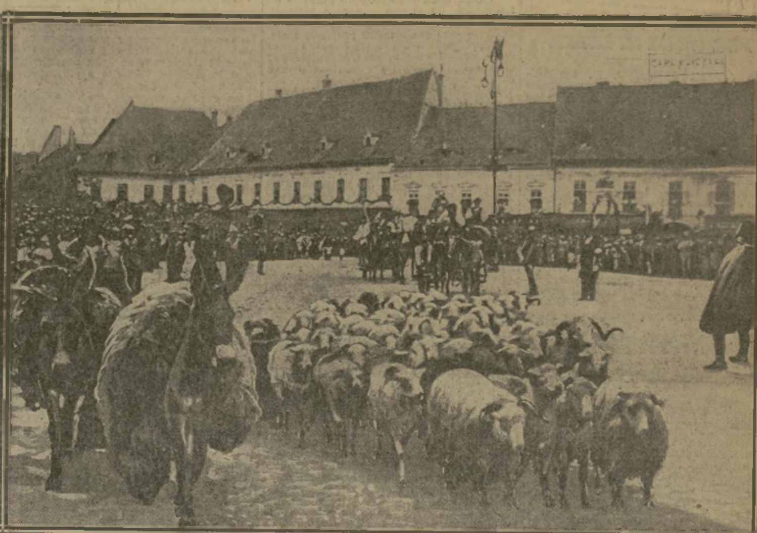
LE DÉFILÉ DES PAYSANS ET DE LEURS TROUPEAUX, A SIBIU