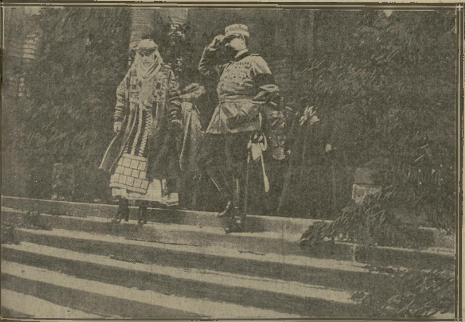
LES SOUVERAINS QUITTENT L'ÉGLISE APRÈS LE SERVICE, A SIBIU