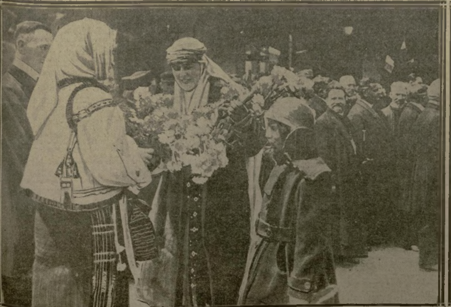
LA REINE ET LA PETITE PRINCESSE REÇOIVENT DES FLEURS, A SIBIU

Les souverains roumains viennent d'accomplir un voyage, qui fut pour eux un véritable triomphe, dans les territoires nationaux reconquis en Transylvanie. Partout ce furent des fleurs, des cadeaux, des discours, aussi, où le peuple, par la voix de ses représentants, donnait tout son cœur au couple royal, identifiant