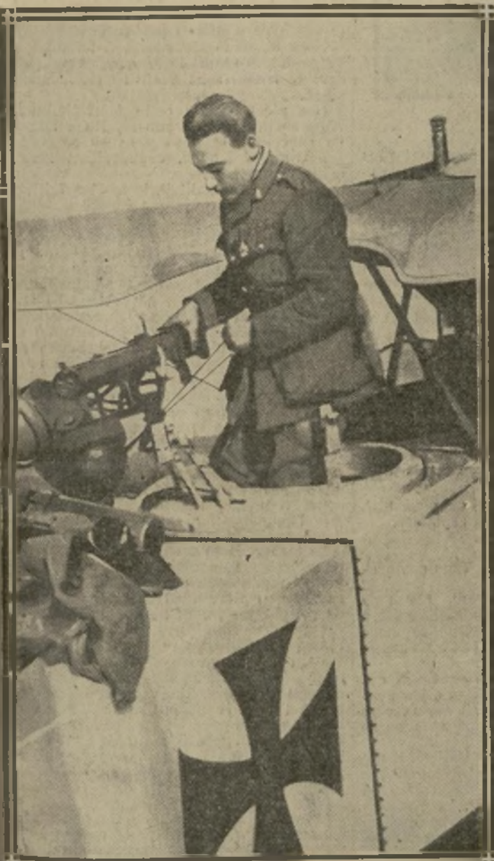
A BORD D'UN AVIATIK, EN 1915