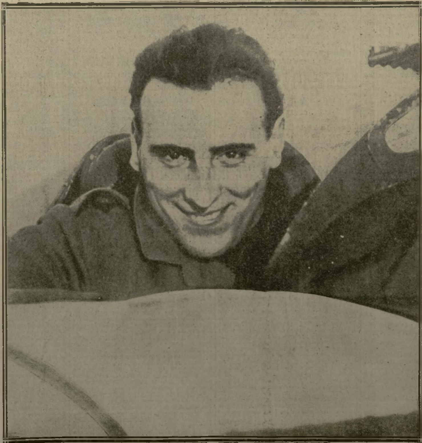
EN PLEINE GLOIRE : NAVARRE A VERDUN. NEUF VICTOIRES ET TROIS MISSIONS SPÉCIALES