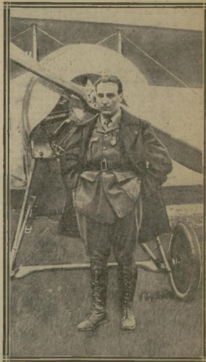
LA BELLE ÉPOQUE : MAI 1916