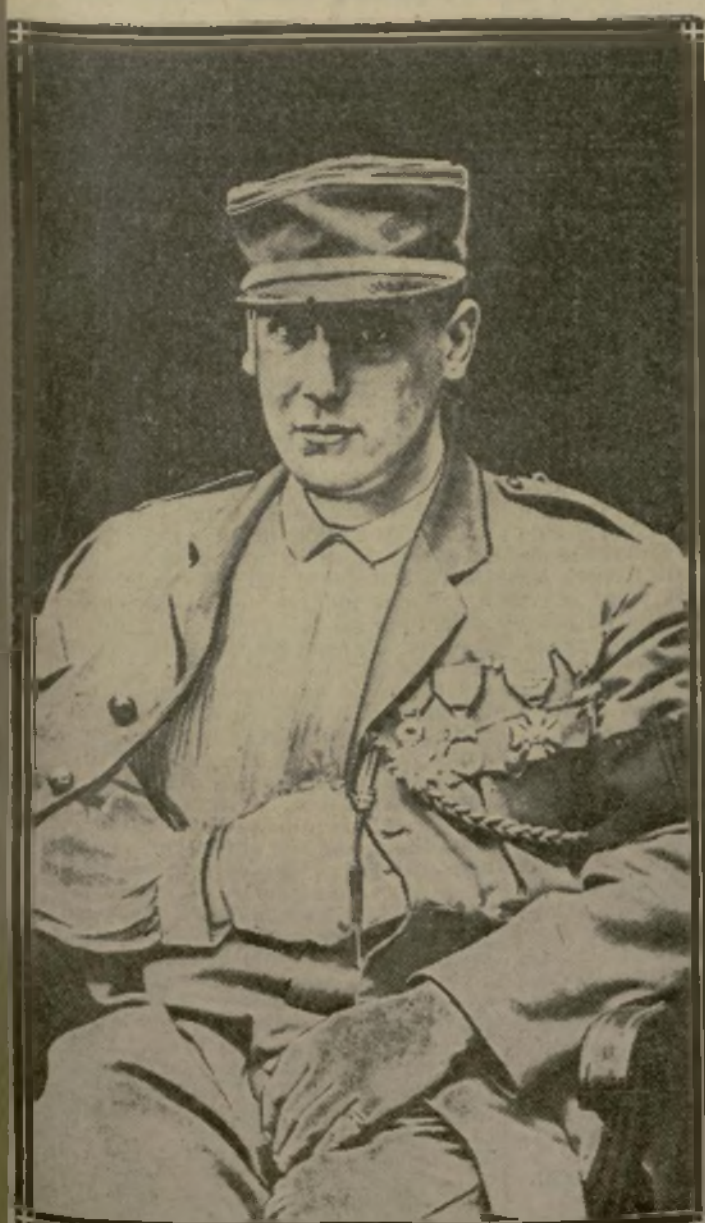
L'AS BLESSÉ EN COMBAT AÉRIEN

Navarre, qui triompha de tant d'ennemis, s'est tué, hier, à Villacoublay, en accrochant des fils téléphoniques. Il fut l'un de ces corsaires aériens héroïques que l'on baptisa « as », parce que la langue française manquait d'un mot. A vingt ans, il avait conquis la gloire, la popularité, et la croix de la Légion d'hon-