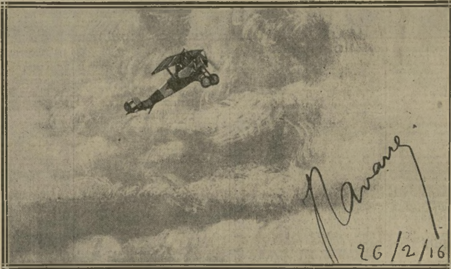
26 FÉVRIER 1916 : LE JOUR DE LA 4 e ET 5 e VICTOIRE DE NAVARRE. PHOTO SIGNÉE PAR LUI