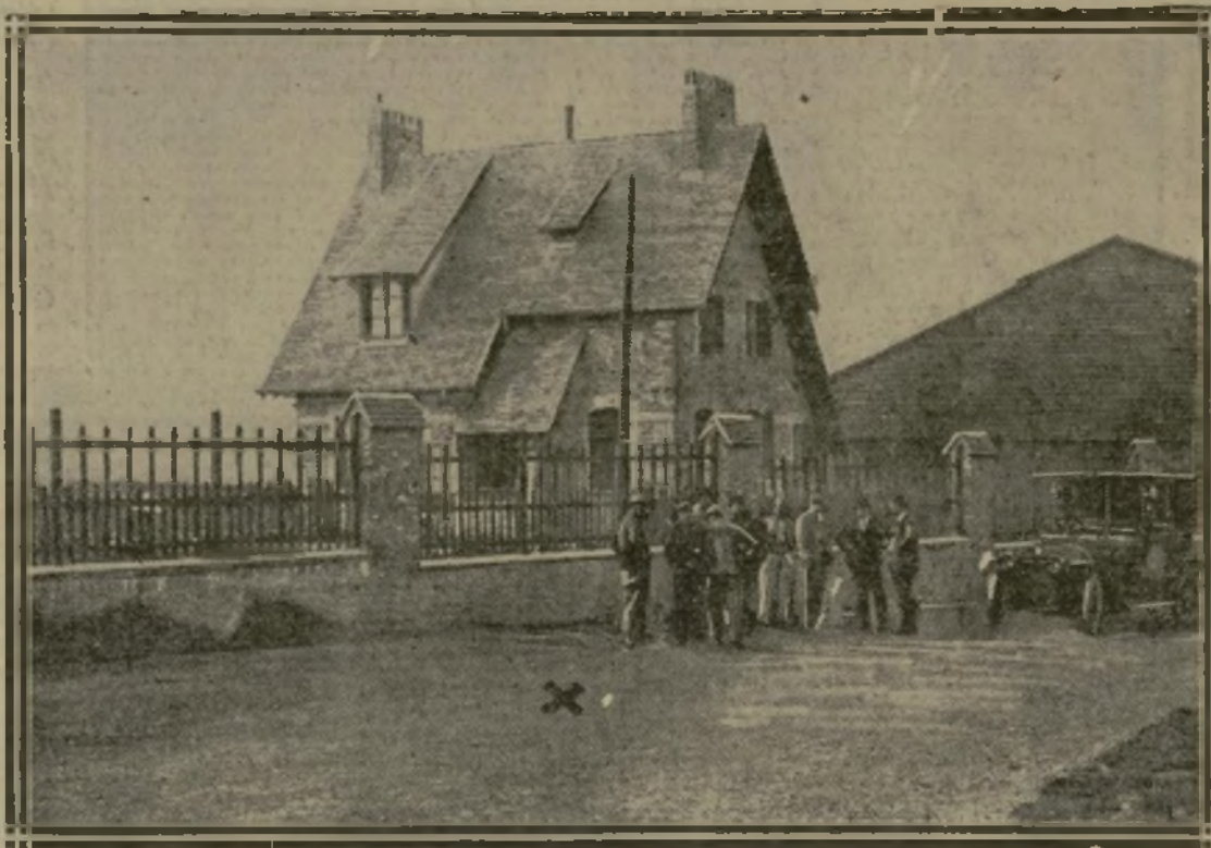
LIEU DE L'ACCIDENT (X). LES DÉBRIS DE L'AVION ONT ÉTÉ ENLEVÉS