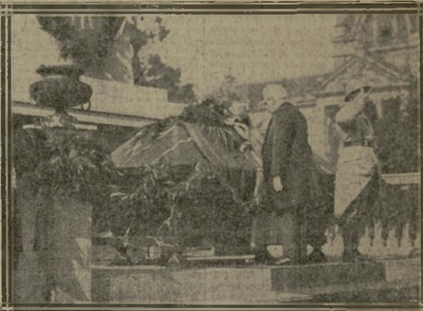
M. MILLERAND DÉPOSE UNE GERBE SUR LE MONUMENT