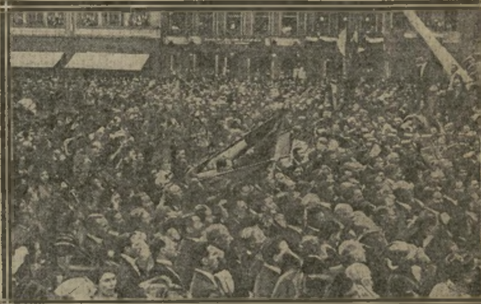
LES ALSACIENS CHANTENT EN CHŒUR “LA MARSEILLAISE”