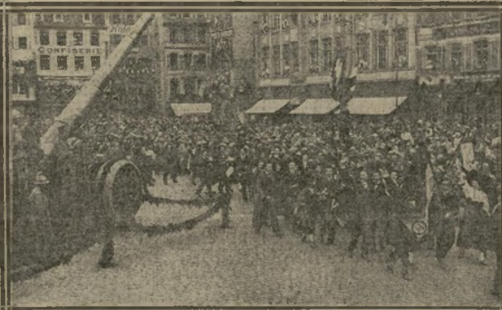
LES ÉTUDIANTS DÉFILENT DEVANT LES CANONS FRANÇAIS