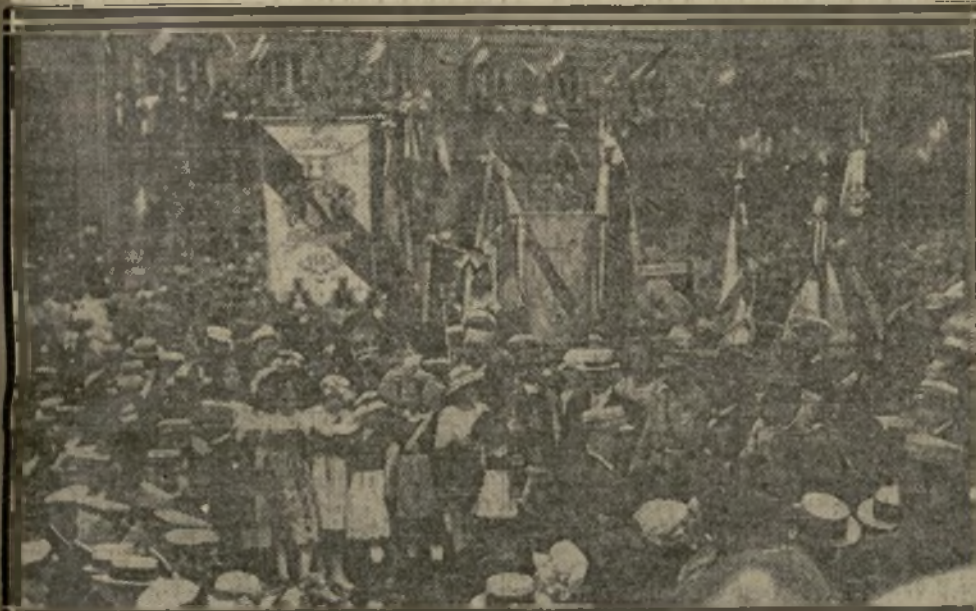
LES BANNIÈRES DES SOCIÉTÉS PLACE KLÉBER