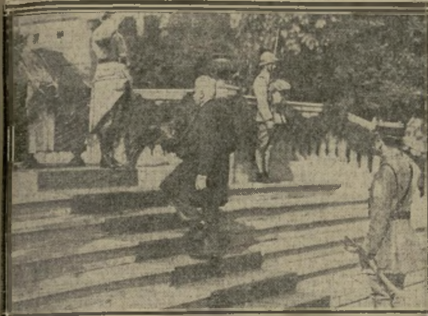
M. MILLERAND DEVANT LE MONUMENT AUX MORTS