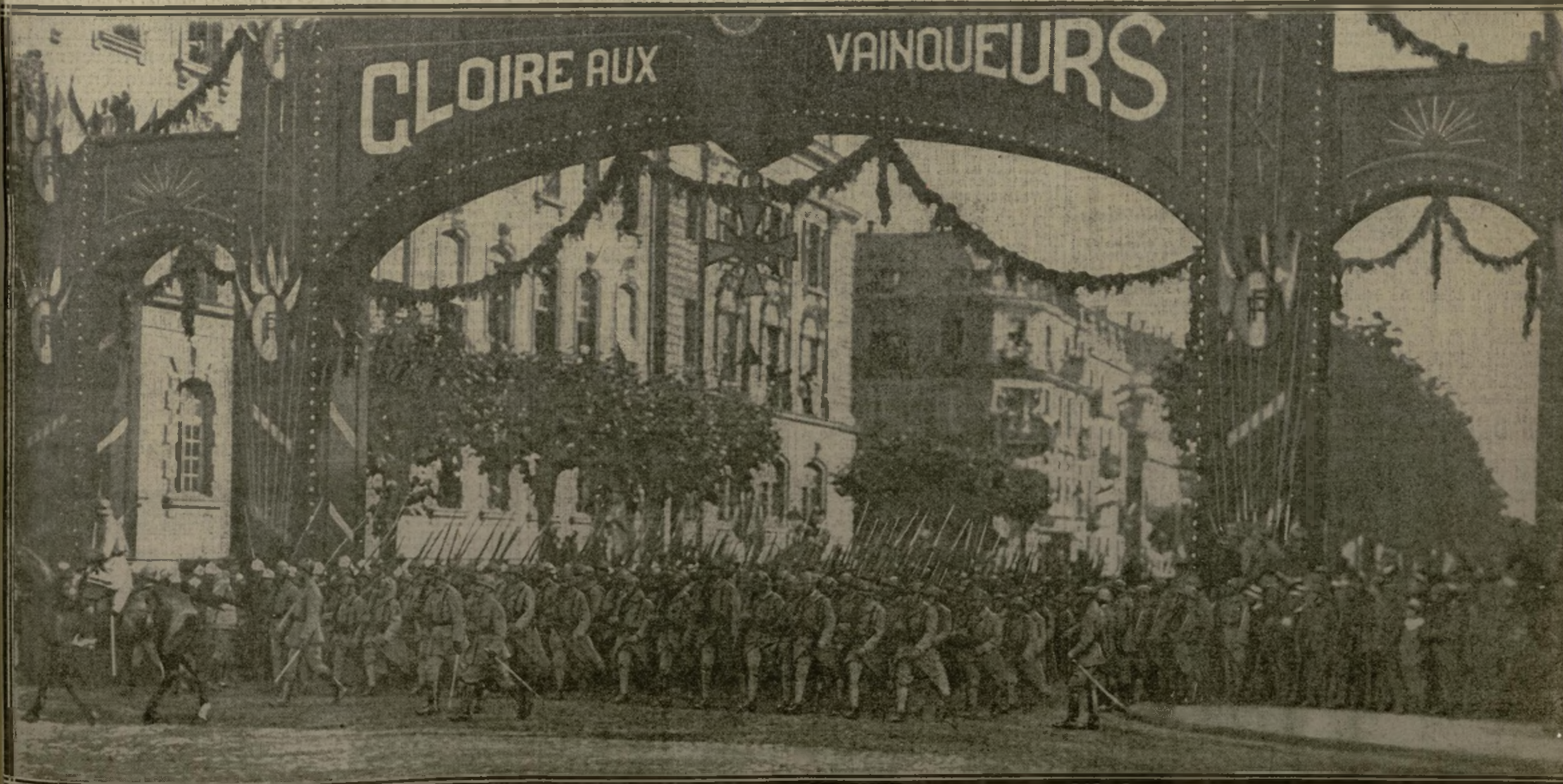
LE DÉFILÉ DES TROUPES SOUS L'ARC DE TRIOMPHE ÉRIGÉ SPÉCIALEMENT DANS LA RUE NOUVELLEMENT REBAPTISÉE “RUE DE LA PAIX”

Le premier 14 Juillet des provinces délivrées... Combien de vieux Alsaciens-Lorrains ont versé de douces larmes au souvenir des fêtes de jadis, tandis que les jeunes, ceux de l'occupation, s'émerveillaient des joissances nouvelles! Le matin, à Strasbourg, M. Millerand, commissaire de la République, alla déposer