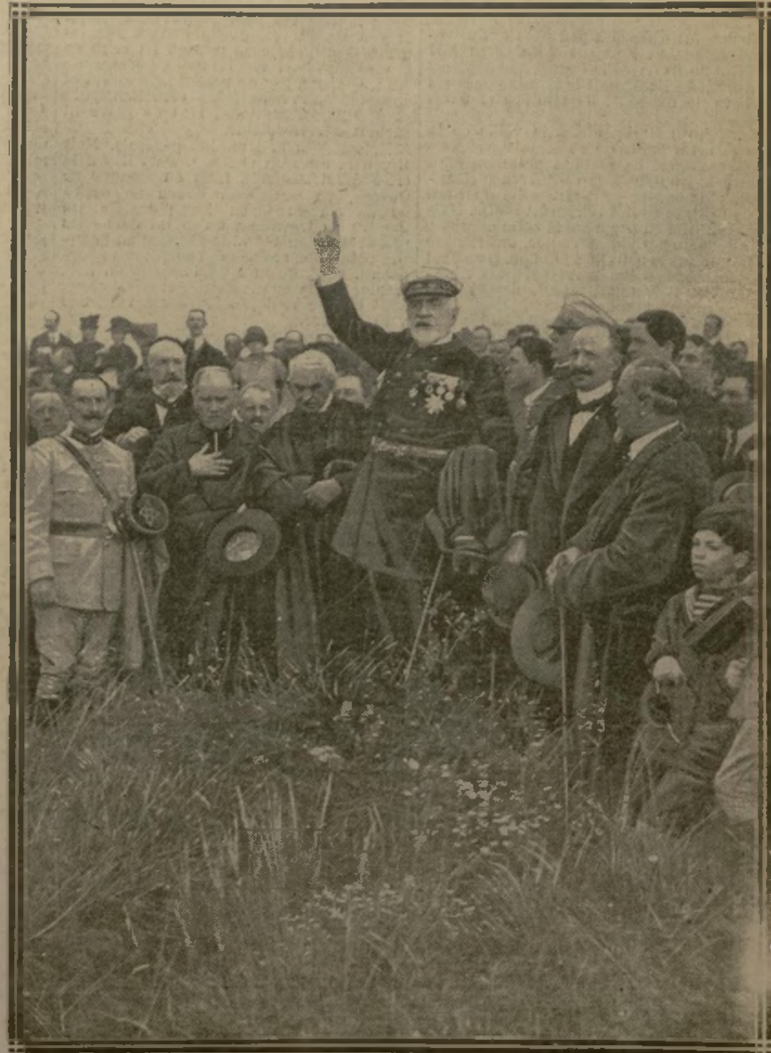
LE DISCOURS DE L'AMIRAL BESSON SUR LES TOMBES

passés en revue par l'amiral Guépratte et reçus à l'Hôtel de Ville par M. Terquin, maire de la ville. L'après-midi, plus de 5.000 Dunkerquois, parmi lesquels des Bazennes ou pêcheuses des dunes, se sont rendus en pèlerinage à Dixmude, où un discours émouvant a été prononcé sur les tombes par l'amiral Besson.