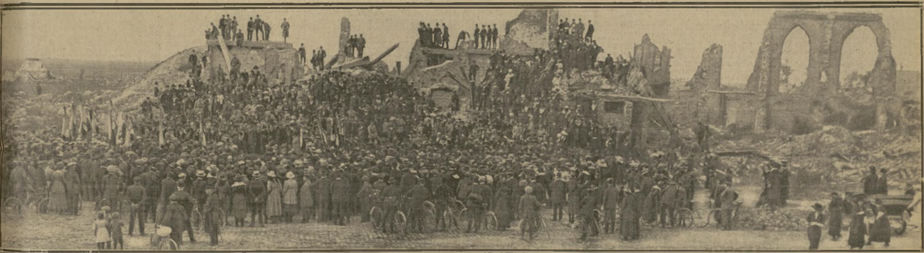
DES HABITANTS DE DUNKERQUE, VENUS EN PÉLERINAGE, ÉCOUTENT UN DISCOURS, MONTÉS SUR LES RUINES DE L'HOTEL DE VILLE DE DIXMUDE