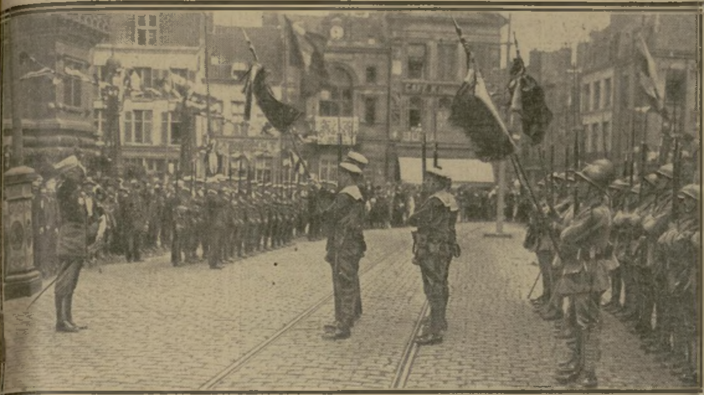
LE SALUT DE L'AMIRAL GUÉPRATTE AUX FUSILIERS MARINS