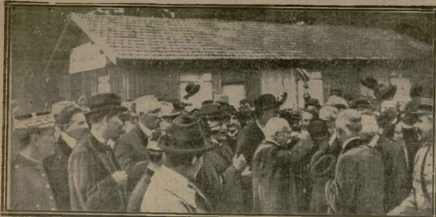
LE PRESIDENT DU CONSEIL A LA SORTIE DE LA GARE DE RETHEL