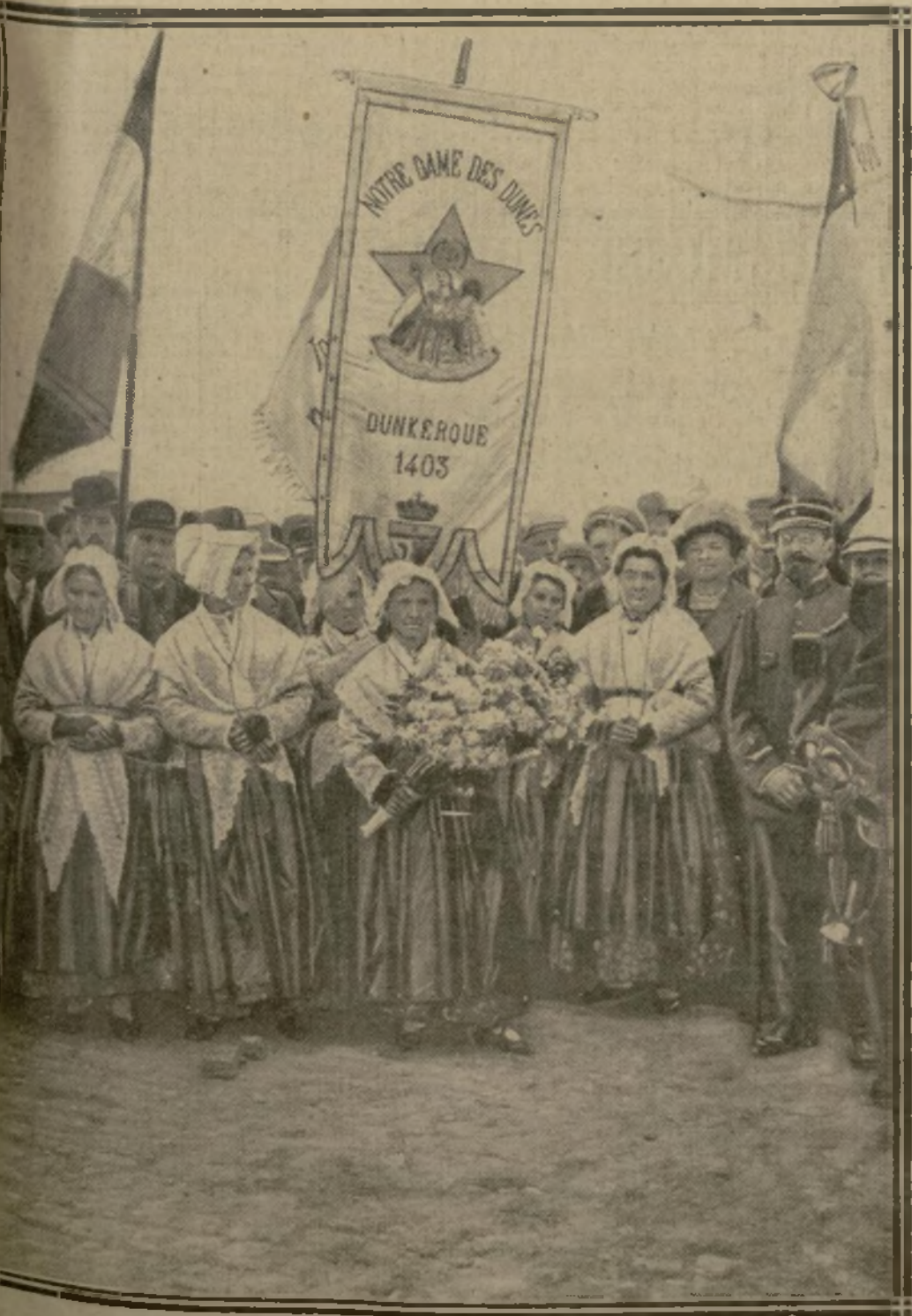
LA DELEGATION DES PECHESSES DE DUNKERQUE

Les Dunkerquois viennent de rendre un hommage solennel aux soldats alliés tombés sur l'Yser en 1914, et particulièrement à cette héroïque poignée de fusiliers marins qui, enlisés jusqu'au ventre dans la vase de l'Yser, arrêtaient la marée allemande. Dimanche matin, à Dunkerque, les marins ont été