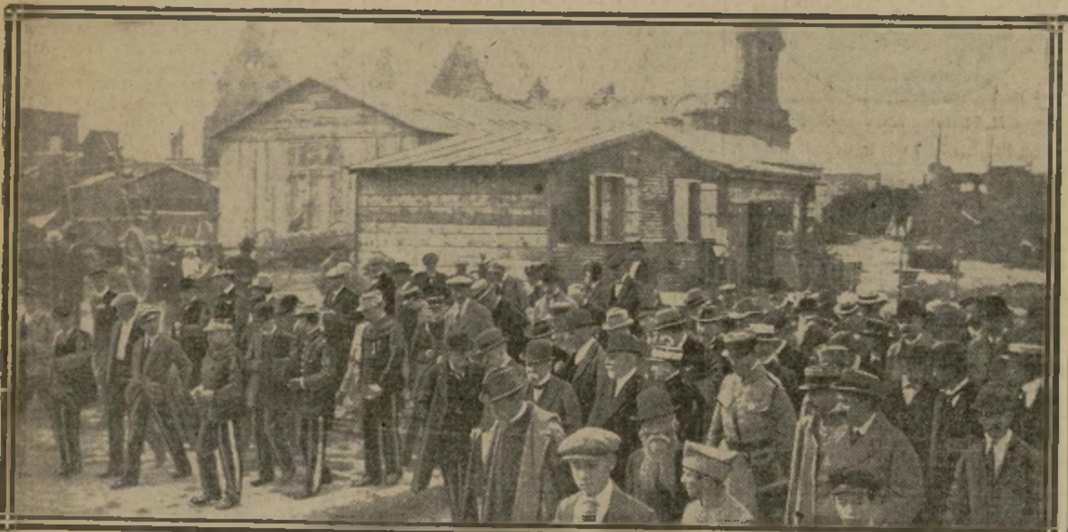
M. CLEMENCEAU PARCOURT LES RUINES D'ATTIGNY. AU FOND, L'ÉGLISE