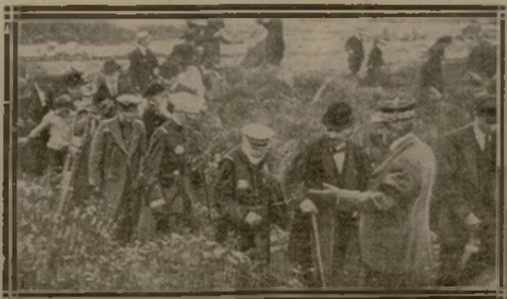
LE GARDE CHAMPETRE MONTRE LES TOMBES

passés en revue par l'amiral Guépratte et reçus à l'Hôtel de Ville par M. Terquin, maire de la ville. L'après-midi, plus de 5.000 Dunkerquois, parmi lesquels des Bazennes ou pêcheuses des dunes, se sont rendus en pèlerinage à Dixmude, où un discours émouvant a été prononcé sur les tombes par l'amiral Besson.