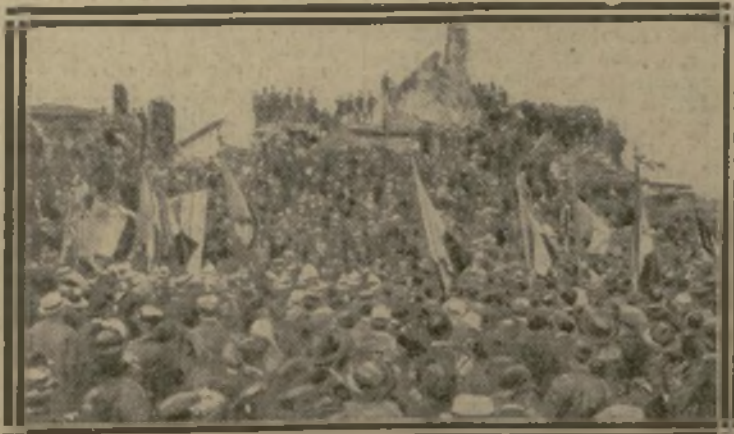
LES VISITEURS AVEC LEURS BANNIÈRES