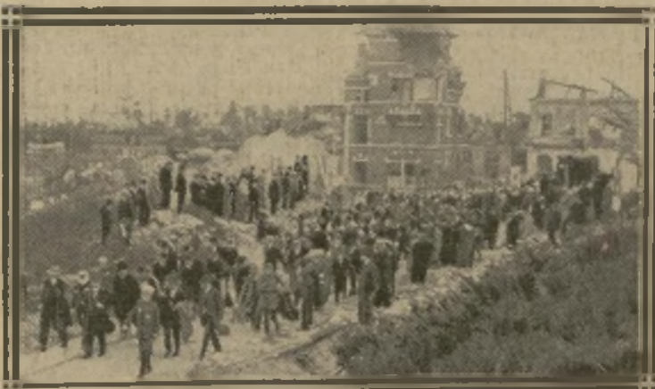
L'AMIRAL GUÉPRATTE EN TÊTE DU CORTÈGE

Les Dunkerquois viennent de rendre un hommage solennel aux soldats alliés tombés sur l'Yser en 1914, et particulièrement à cette héroïque poignée de fusiliers marins qui, enlisés jusqu'au ventre dans la vase de l'Yser, arrêtaient la marée allemande. Dimanche matin, à Dunkerque, les marins ont été