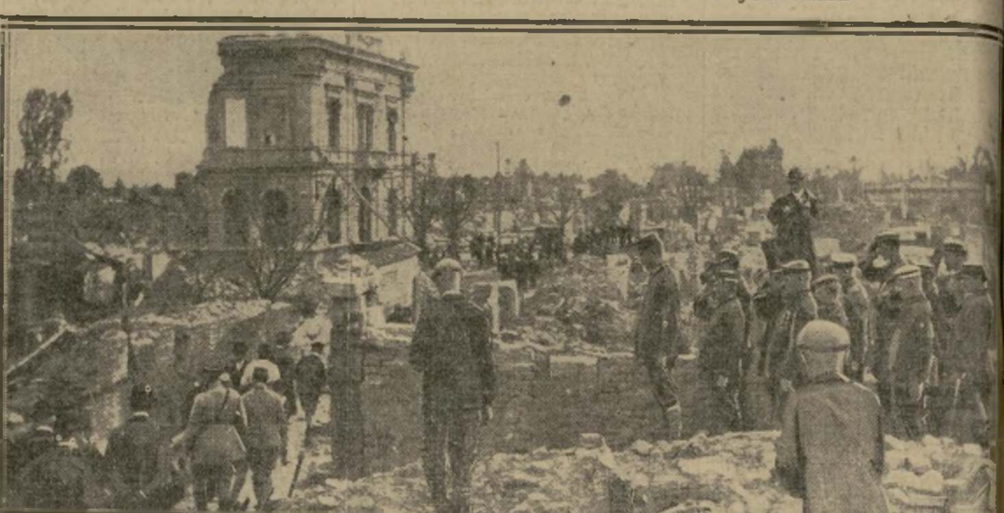
DES PRISONNIERS ALLEMANDS SALUENT LE « PREMIER » AU PASSAGE