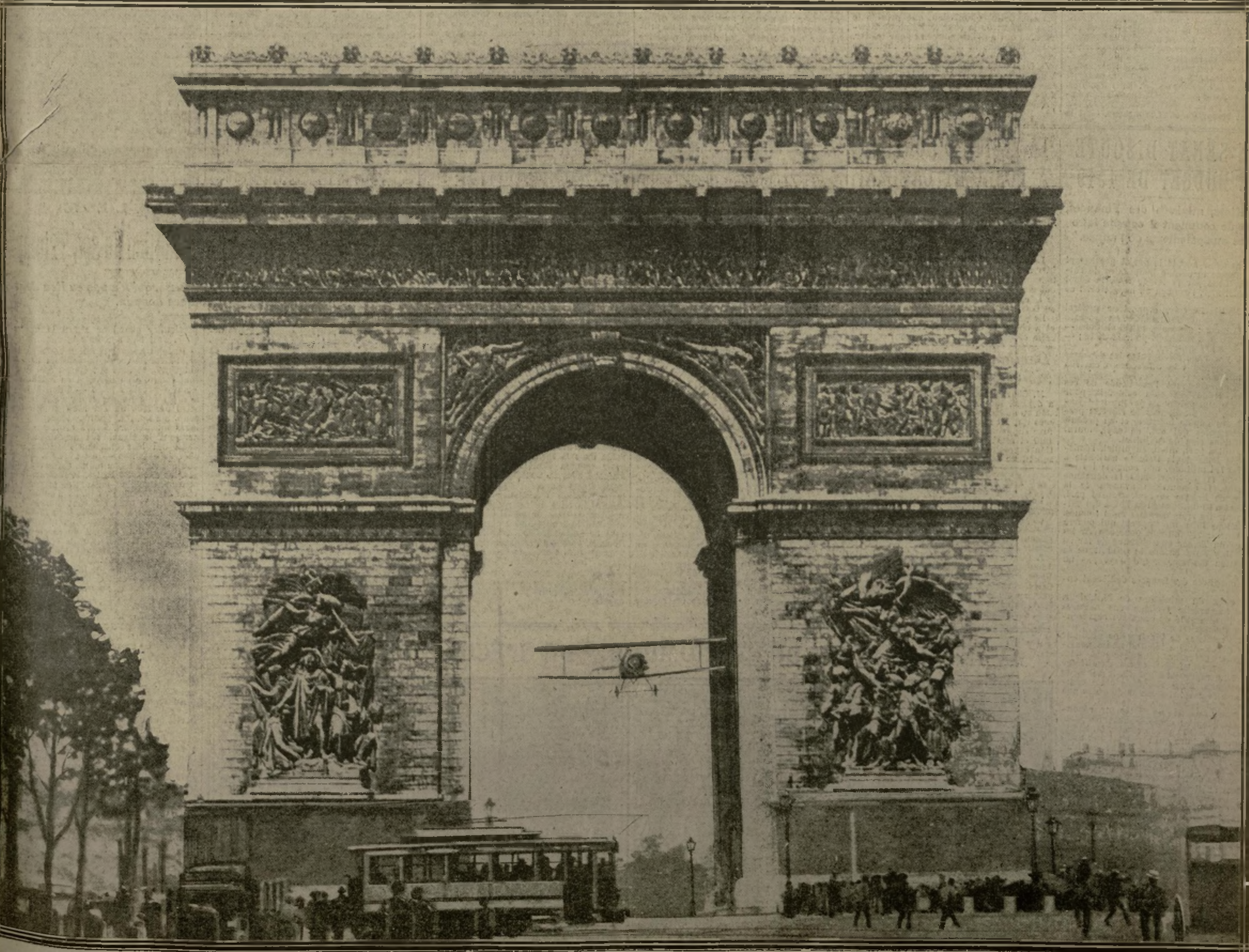
L'APPAREIL, VU DE DERRIÈRE, APRÈS AVOIR FRANCHI L'ARC

L'AVION SORT DU CÔTÉ DES CHAMPS-ÉLYSÉES. — SON ENVERGURE EST DE 9 MÈTRES ET LA LARGEUR DE L'ARCHE DE 14 m 62