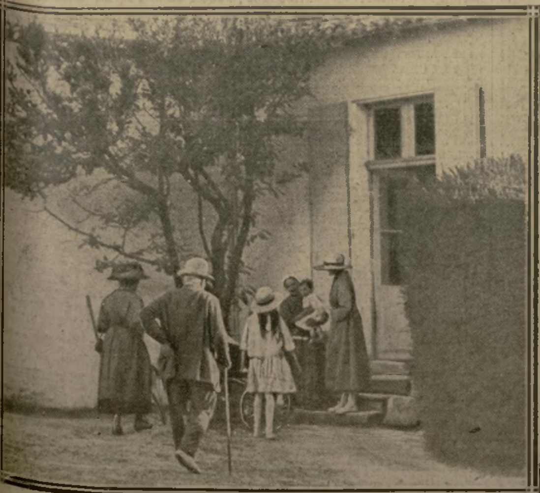
19 h. 5. — RETOUR DE M. CLEMENCEAU A LA VILLA DE LA TRANCHE