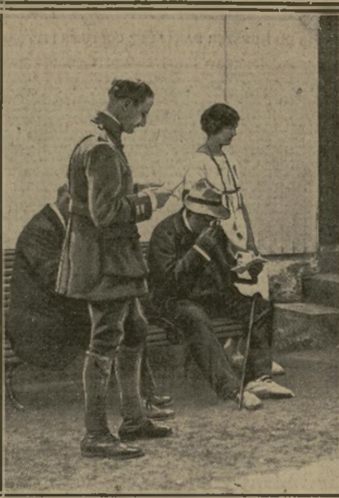
9 HEURES. — UNE DÉPÊCHE OFFICIELLE