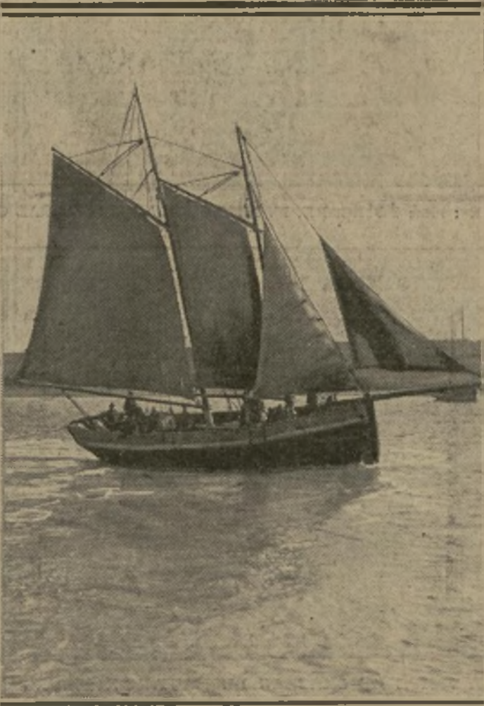
10 h. 45. — LE DÉPART POUR L'ÎLE DE RÉ