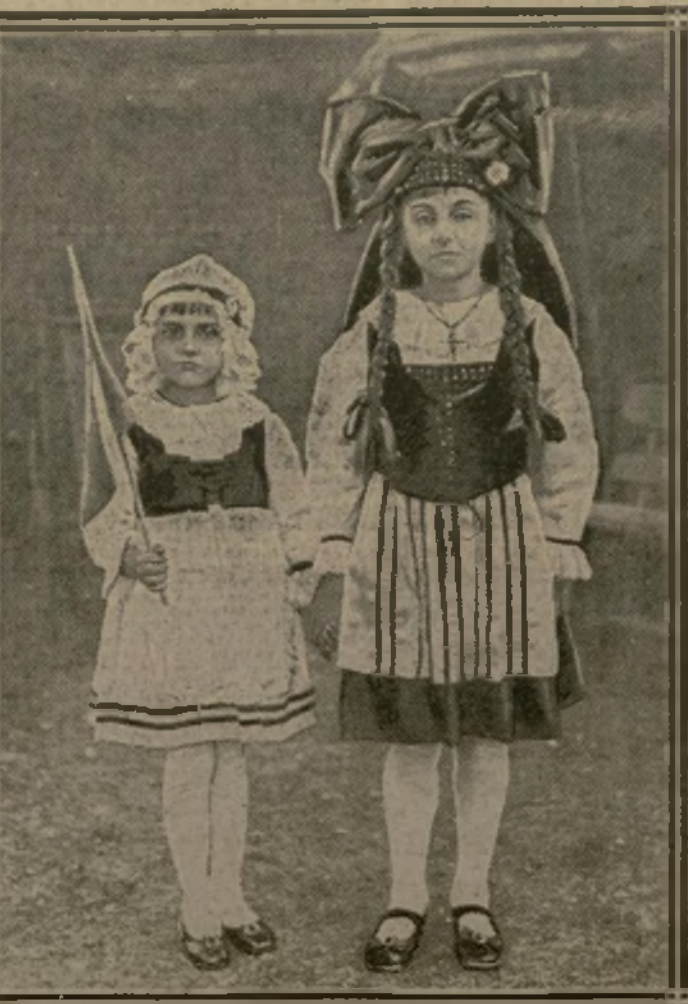
19 h. 10. — UNE SURPRISE