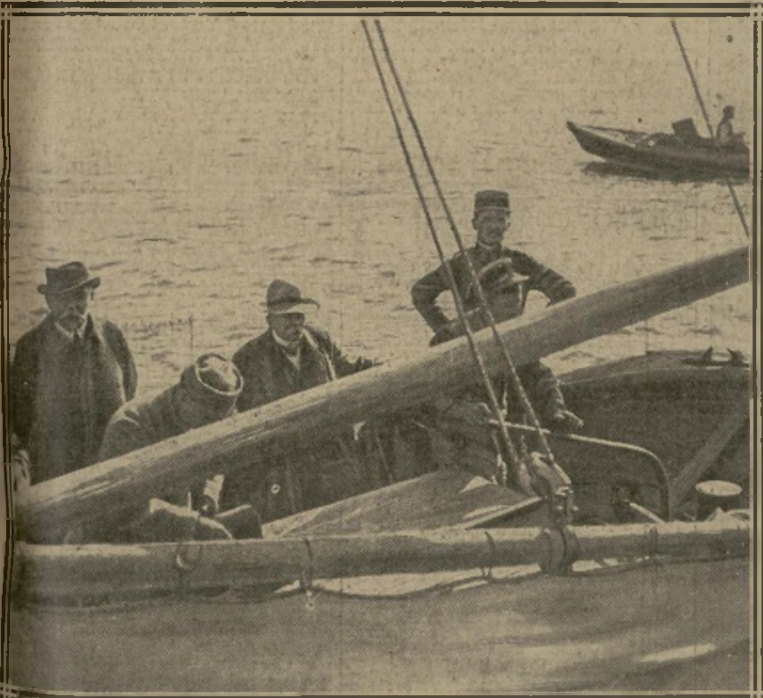
10 h. 35. — LA BARQUE «OLGA» APPAREILLE A L'AIGUILLON