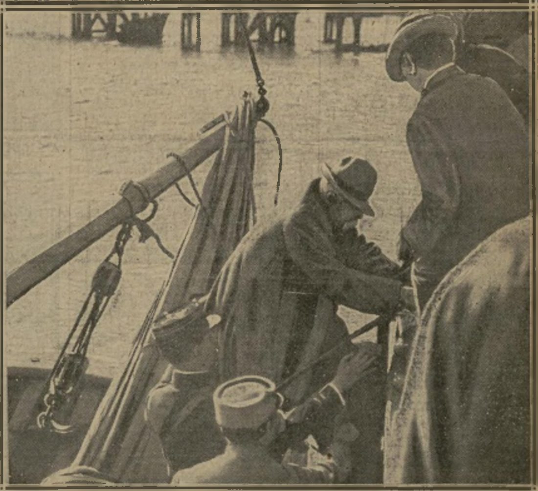
17 h. 40. — M. CLEMENCEAU PREND QUAI A L'AIGUILLON