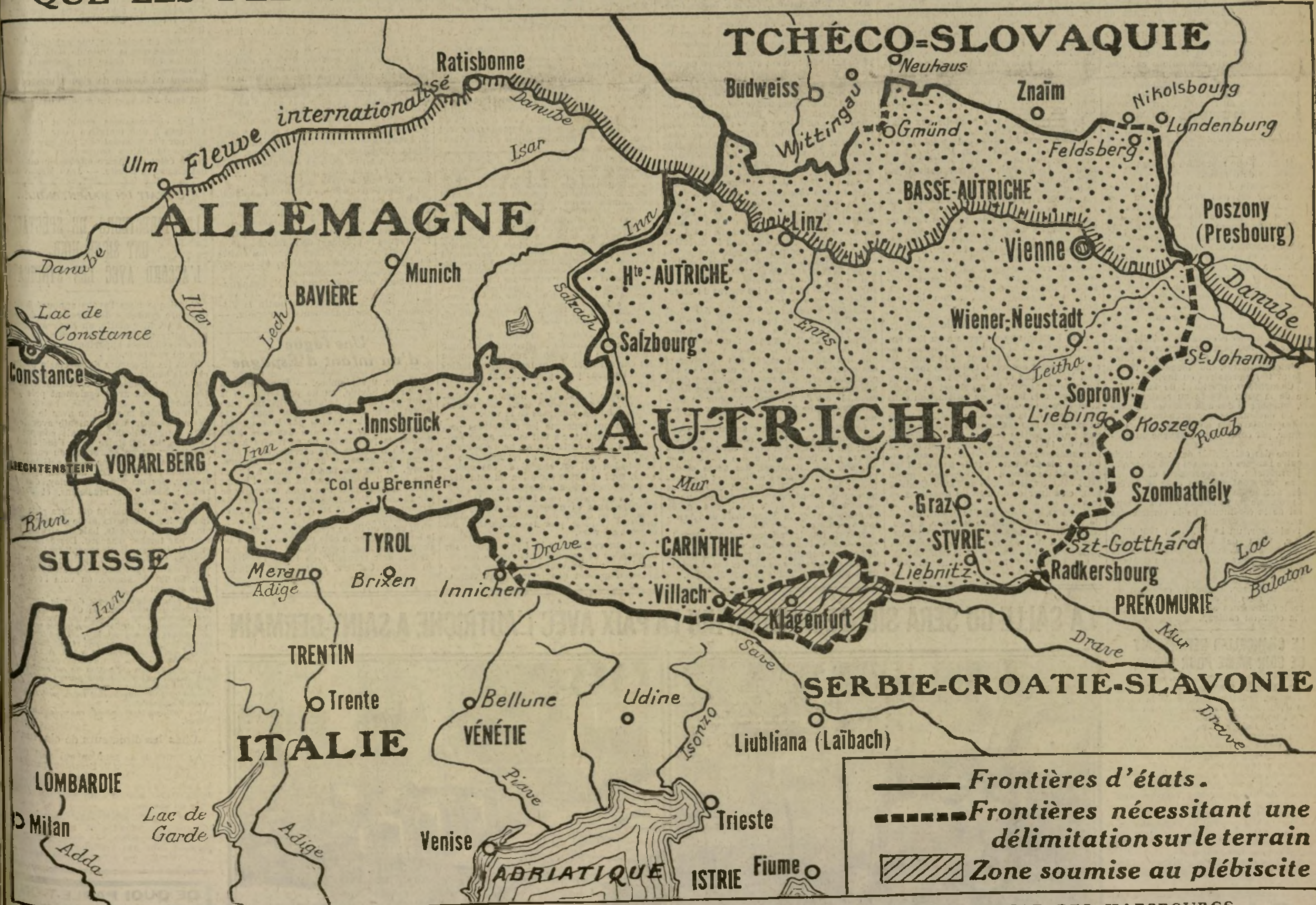
CARTE EXACTE DES FRONTIÈRES NOUVELLES IMPOSÉES

La signature de la paix avec l'Autriche s'effectuera ce matin, à 10 heures, dans la salle même du château de Saint-Germain où l'énoncé des conditions fixées par l'Entente fut remis aux plénipotentiaires de la République autrichienne, le 2 juin dernier. Nous donnons aujourd'hui, révisée définitivement, d'après la