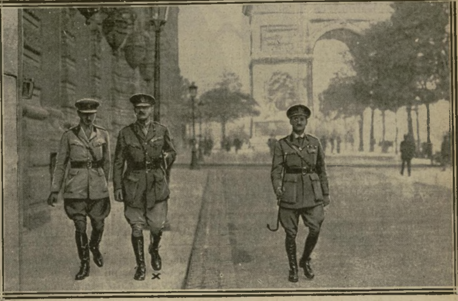
UNE COURTE PROMENADE AVENUE DES CHAMPS-ÉLYSÉES