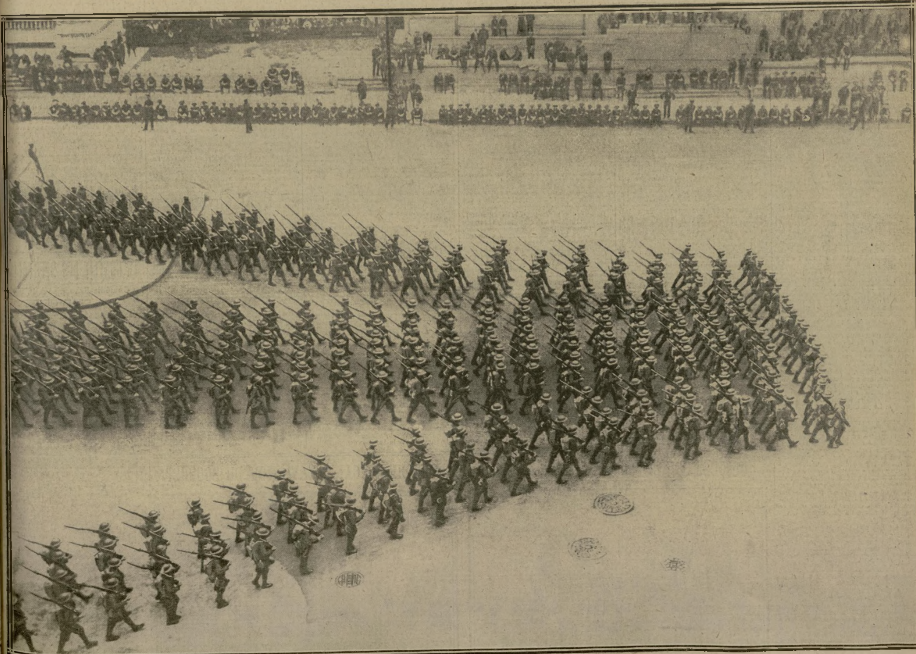
LES TROUPES, AYANT FRANCHI LES TROIS PORTES DE L'ARC DE TRIOMPHE ÉLEVÉ POUR ELLES, SE REFORMENT DANS LA 5 e AVENUE

New-York vient d'avoir, après Paris, Londres et Bruxelles, son cortège de la victoire. La grande ville américaine a fêté avec enthousiasme le retour du général Pershing et de ses vaillants soldats. Le chef du corps expéditionnaire américain en France a défilé à la tête de la première division, celle-là même