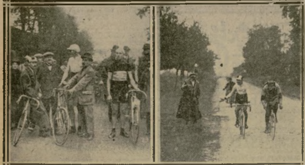
1. AVANT LE DÉPART A VERSAILLES Henri Pélissier, son frère Francis et Jean Alavoine sur la ligne de départ.