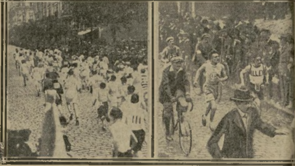
3. — DANS L'AVENUE DE SUFFREN A 300 mètres du départ, le peloton commence déjà à s'égrainer.