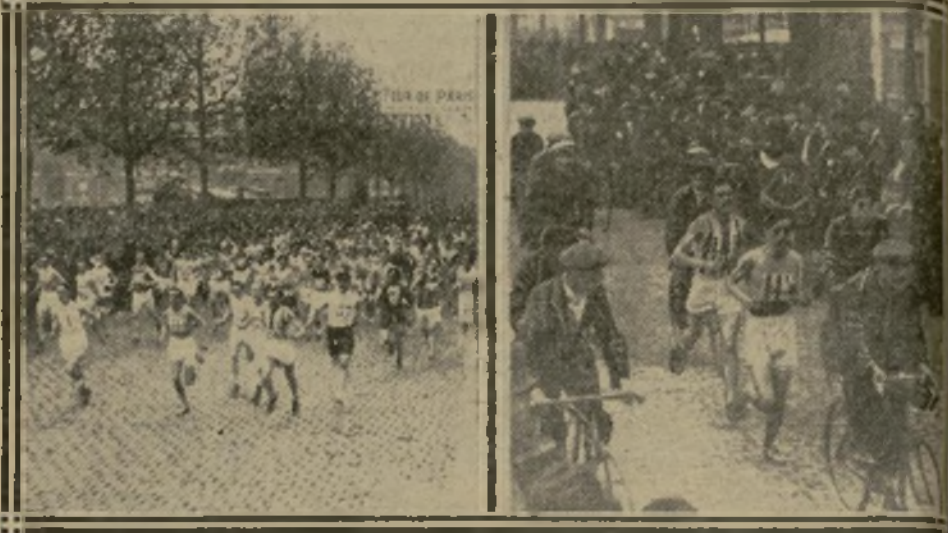
2. LE DÉPART VIENT D'ÊTRE DONNÉ Le lot des coureurs se met en marche dans l'avenue de Suffren.