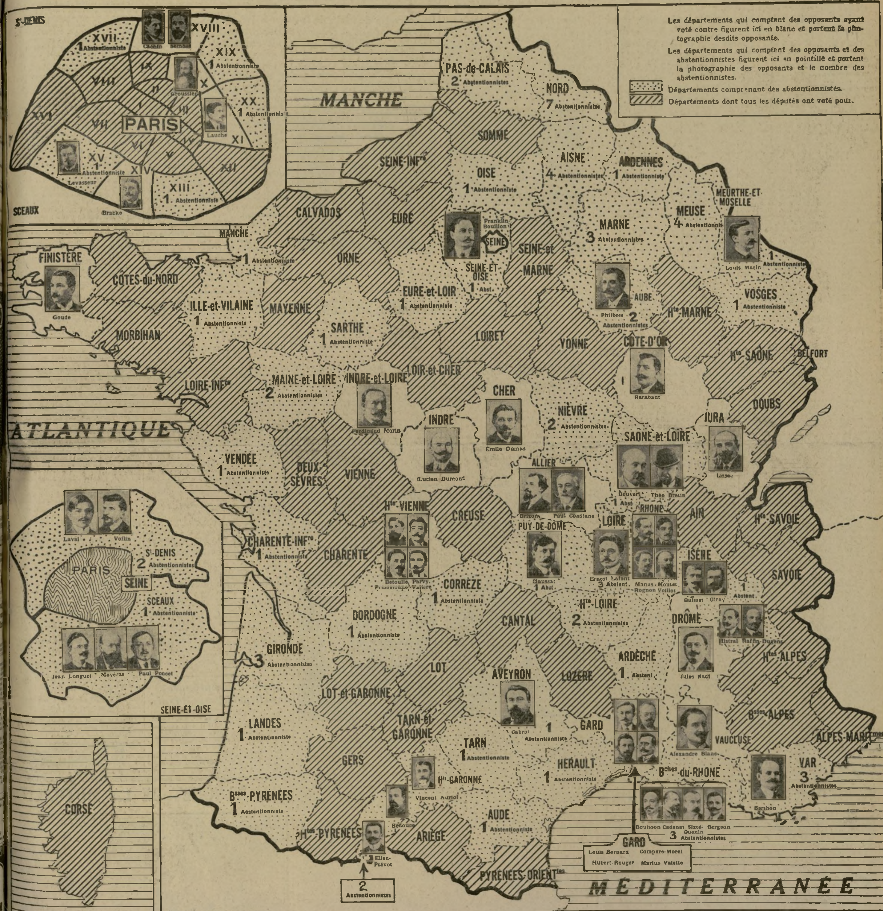
CARTE MONTRANT DE QUELLE FAÇON SE SONT DIVISÉS LES VOTES PAR DÉPARTEMENTS