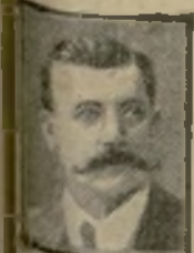
M. Marc Sangnier