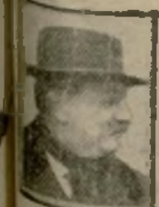
M. Léon Daudet