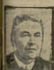
M. Léon Blum