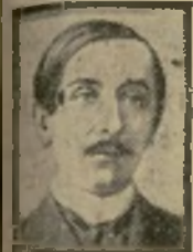
M. Maurice Barrès