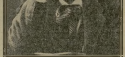
UNE DES DERNIÈRES PHOTOGRAPHIES DU COMPOSITEUR GRANADOS

Granados, qui avait pu rejoindre une embarcation de sauvetage, aperçut sa femme qui se débattait parmi les épaves; aussitôt il se jeta à la mer. On ne le revit point, non plus que son épouse.