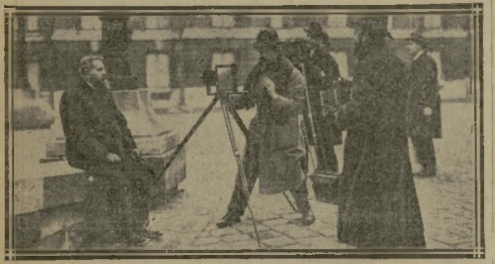
LE D' CHARLES FRANÇOIS SOUS LE FEU CONVERGENT DES OBJECTIFS. Ce député lira à la Chambre la déclaration des Alsaciens-Lorrains (Photographie prise, hier après-midi, dans la cour d'honneur du Palais-Bourbon)

Les travaux parlementaires ne commenceront que le 16 décembre. Un projet de douzièmes provisoires va être incessamment déposé.