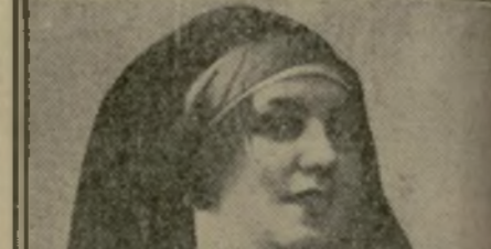
PHOTOGRAPHIE DE LA FEMME QUE L'ON CROIT ÊTRE LA « DAME BLONDE »

On répète sur la scène de l'Opéra les Goyescas, l'œuvre de Granados, qui passera le 17 en répétition générale, et c'est le fils du célèbre compositeur catalan qui, à la place de son père, assume un délicat et minutieux travail de mise au point. Nous-mêmes nous étions présents hier à l'autre que nous l'aurions reconnu, non seulement aux cheveux d'ébène abondants, au teint de bronze, mais à la flamme du regard derrière lequel se dévinait une volonté enthousiaste et une énergie douce.