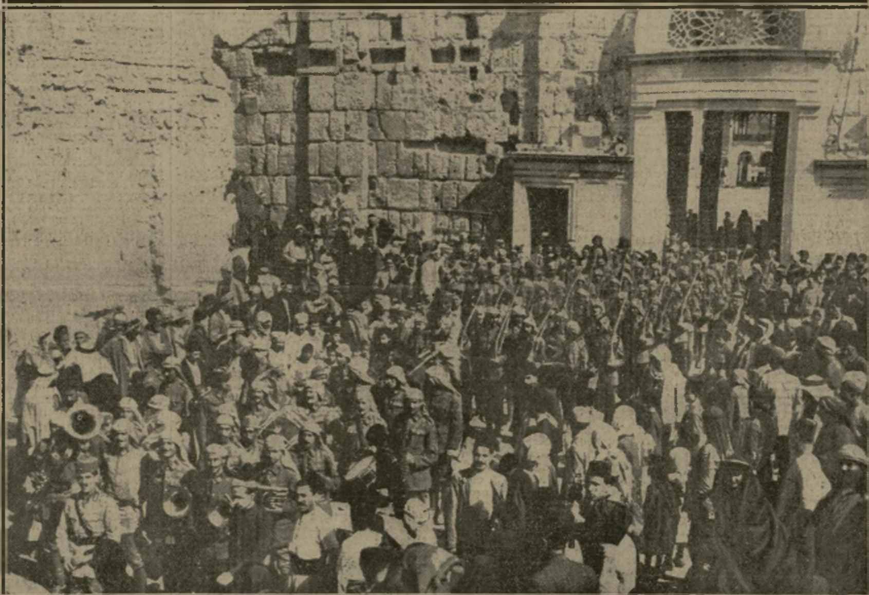
L'ÉMIR ZAID SORT, ESCORTÉ, DE LA GRANDE MOSQUEE DE DAMAS