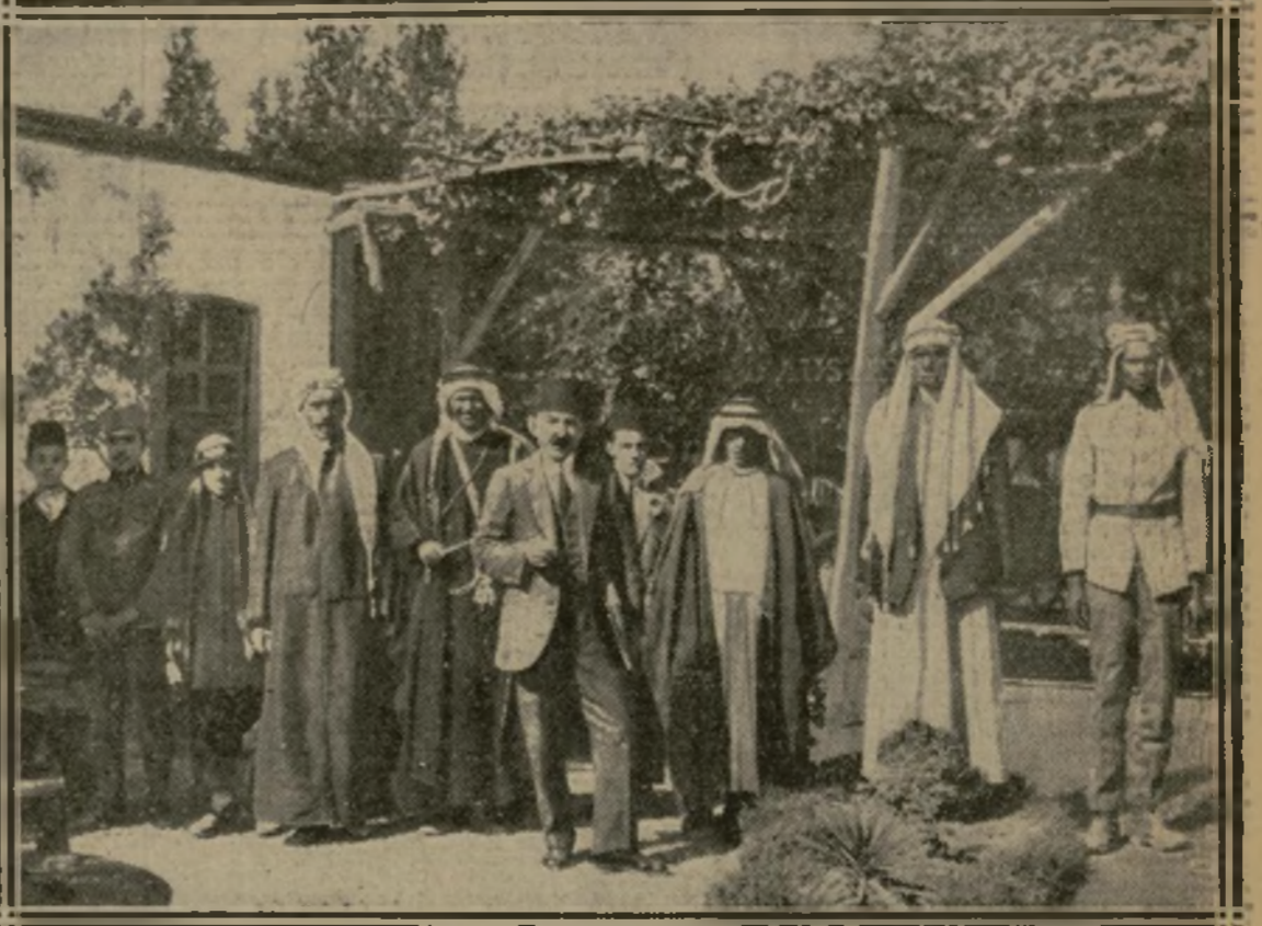
LES SECRÉTAIRES ET GARDES DU CORPS DE L'ÉMIR FAYÇAL