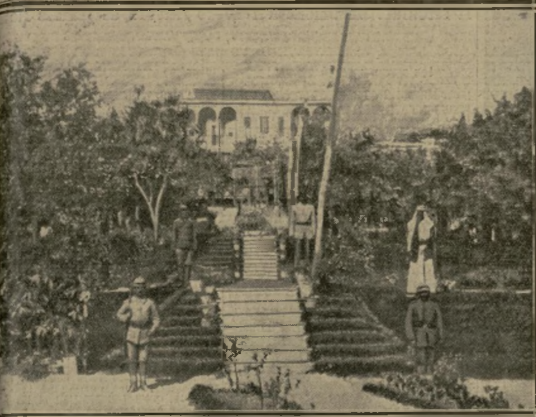
LA RÉSIDENCE DE L'ÉMIR FAYÇAL, A DAMAS