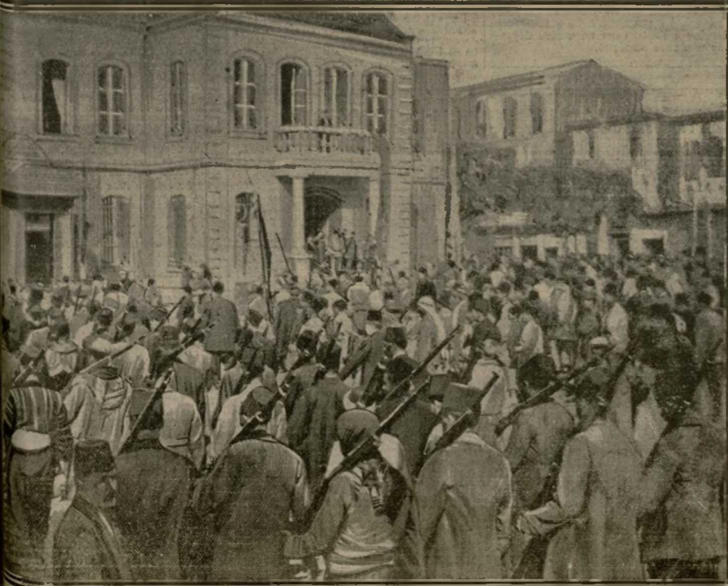
UNE MANIFESTATION DE GENS ARMÉS DEVANT L'HOTEL DE VILLE