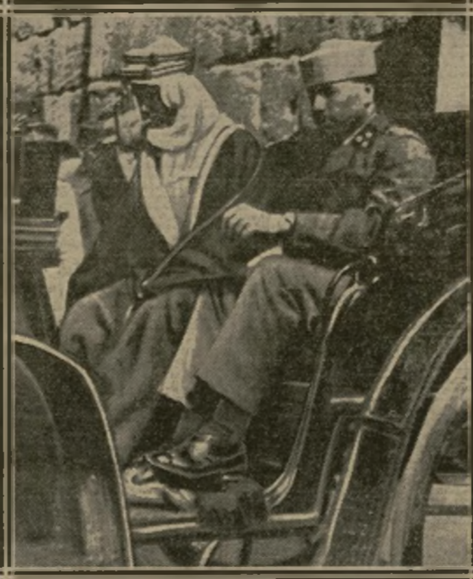
L'ÉMIR ZAID, FRÈRE DE FAYÇAL