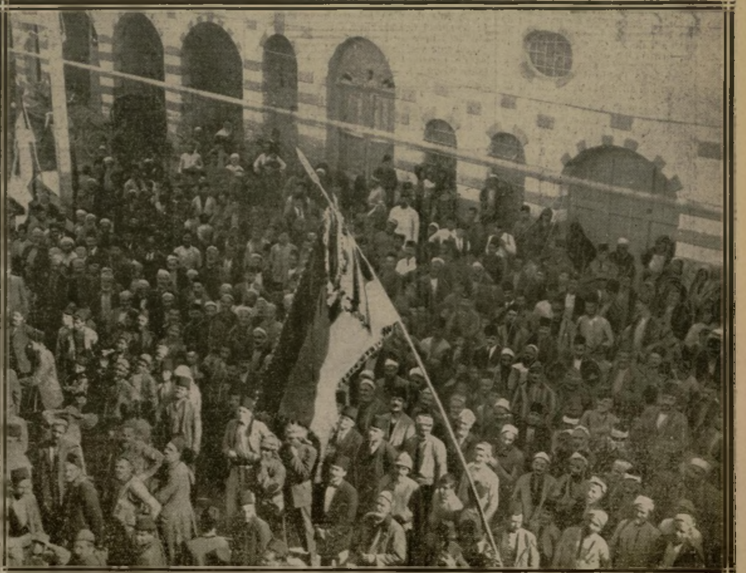
LES MANIFESTANTS BRANDISSENT LE DRAPEAU DE L'ÉMIR FAYÇAL

La situation est complexe en Syrie. Dans l'intérieur, des bandes armées avec les laissés pour compte des alliés sont prêtes, dit-on, à s'opposer par la force à l'occupation, par nos troupes, du territoire administré par Riza pacha. A Damas, des troubles se sont produits récemment à l'occasion du Congrès