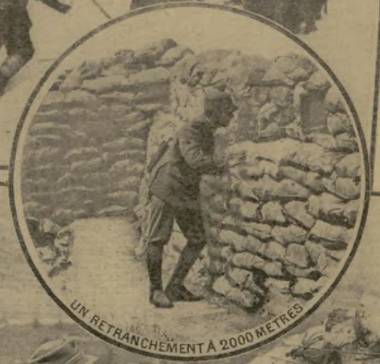
UN RETRANCHÉMENT A 2000 METRES