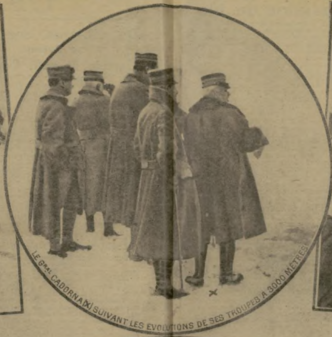
LE GÉN. CADORNA SUIVANT LES ÉVOLUTIONS DE SES TROUPES A 3000 METRES