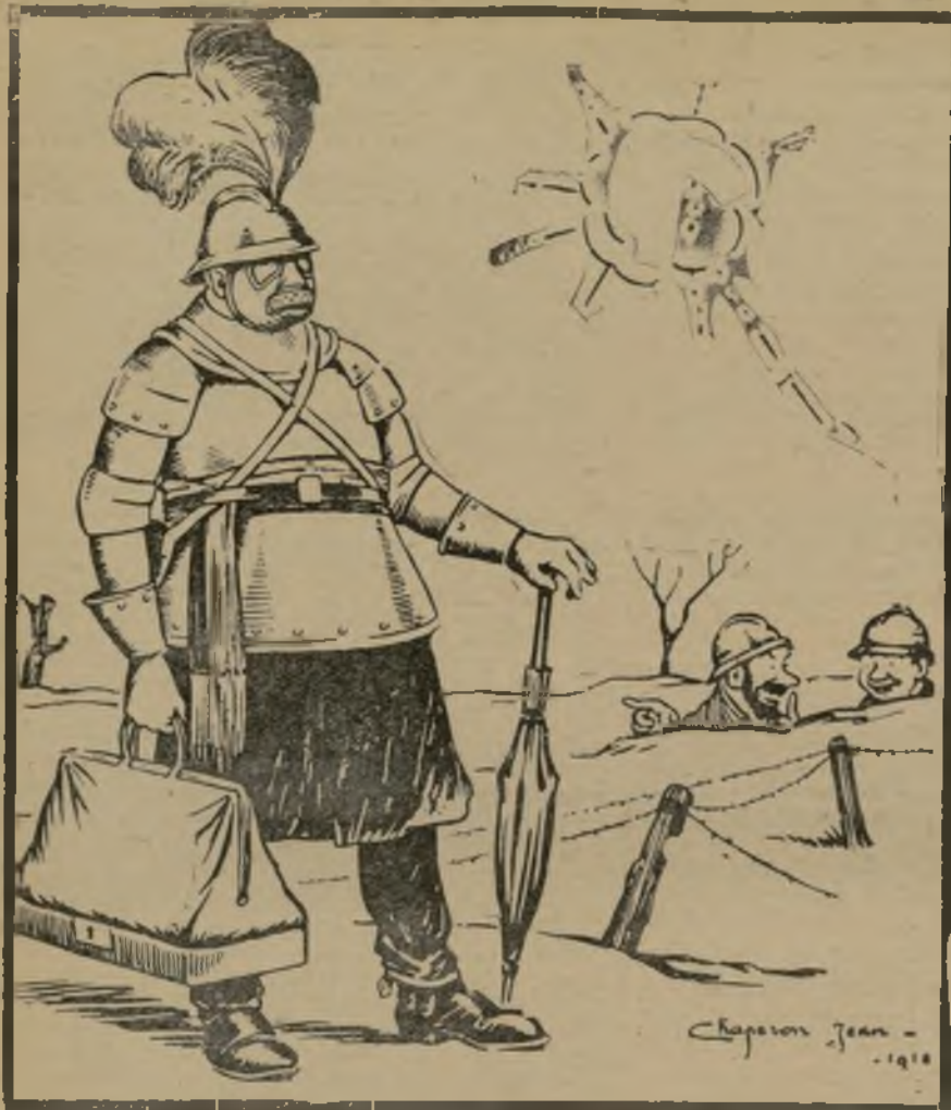
Projet de costume pour commissaires aux armées.