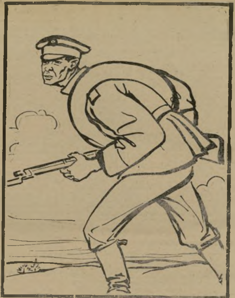
— Moi aussi je veux river mon clou au maréchal Hin- denbourg.