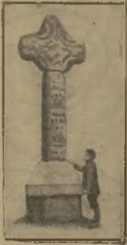
La croix de Downpatrick.

Il y a à Downpatrick une vieille croix celtique dont les débris ont été réédifiés sur un socle formé de deux pierres par les soins de deux évêques irlandais : un évêque protestant orangiste et un évêque catholique nationaliste. Depuis l'érection du signe sacré commun aux deux religions qui sont deux partis très opposés en Irlande, la réconciliation que ce monument semblait consacrer ne s'est pas faite. Cette croix n'est encore qu'un symbole d'espérance. La dernière séance des Communes nous laisse dans l'inquiétude.