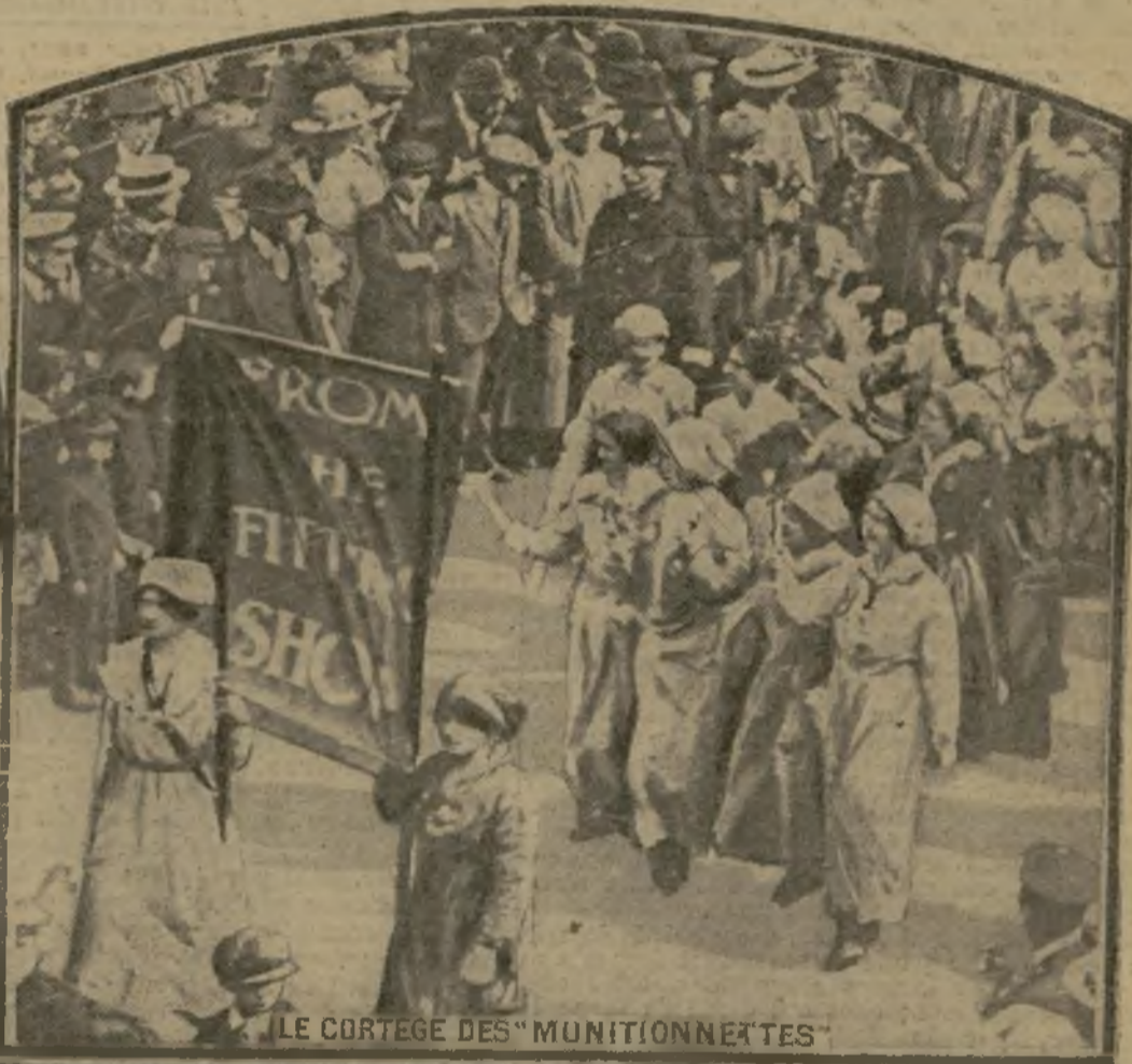
LE CORTEGE DES "MUNITIONNETTES"