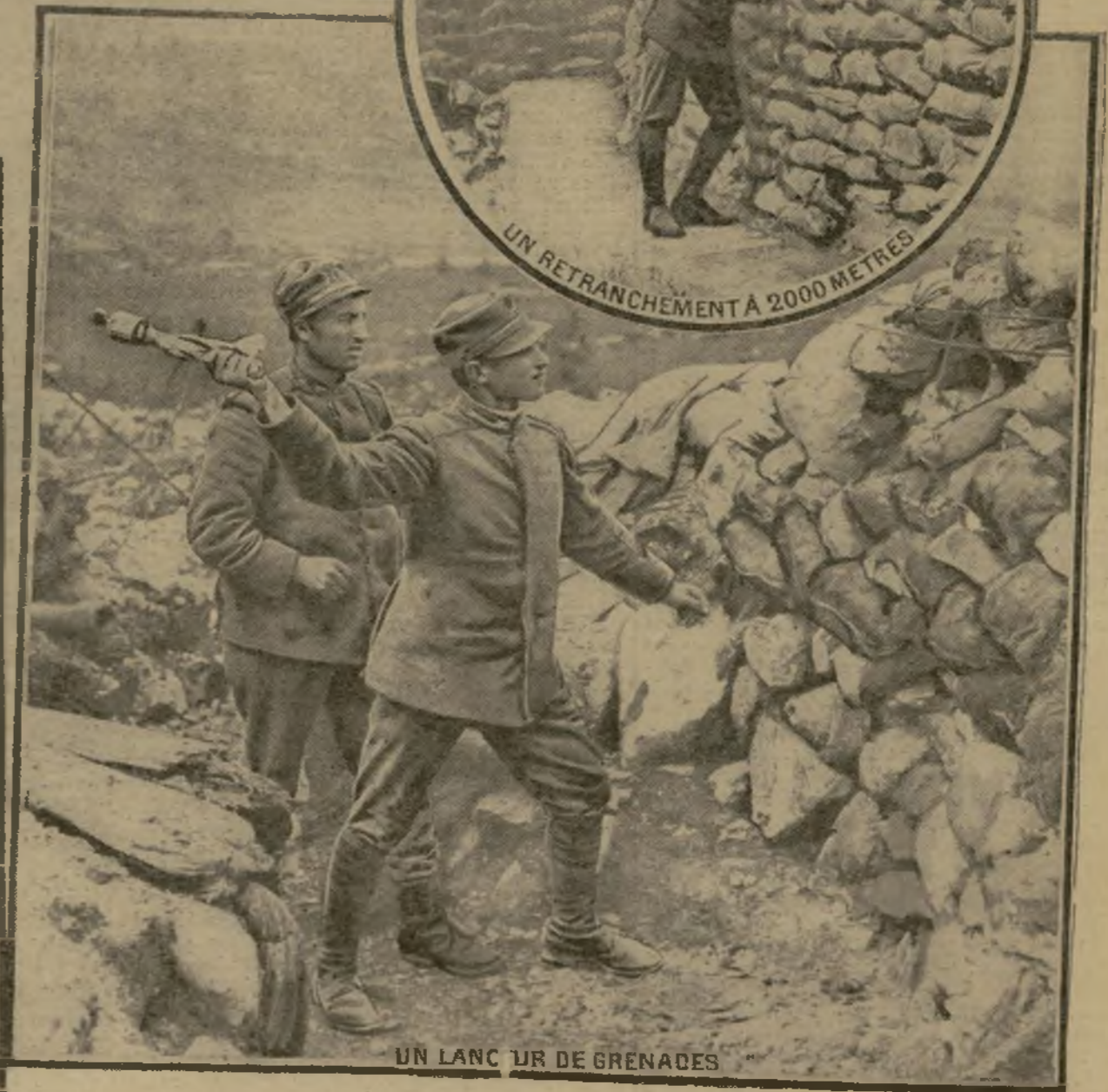
UN LANCIEUR DE GRENADES

La contre-offensive des troupes du général Cadorna vient de remporter de nouveaux et importants avantages sur le front du Trentin. Le Mont Cimone qui, depuis le 1 er juillet était sous le feu des pièces de nos alliés, vient de tomber aux mains des alpins