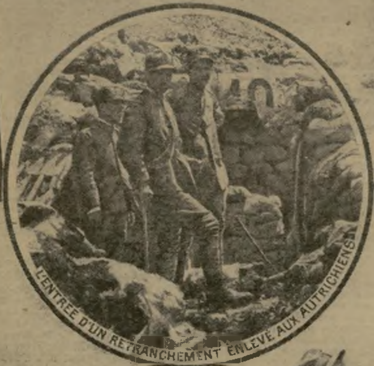
L'ENTRÉE D'UN RETRANCHÉMENT ENLEVÉ AUX AUTRICHIENS