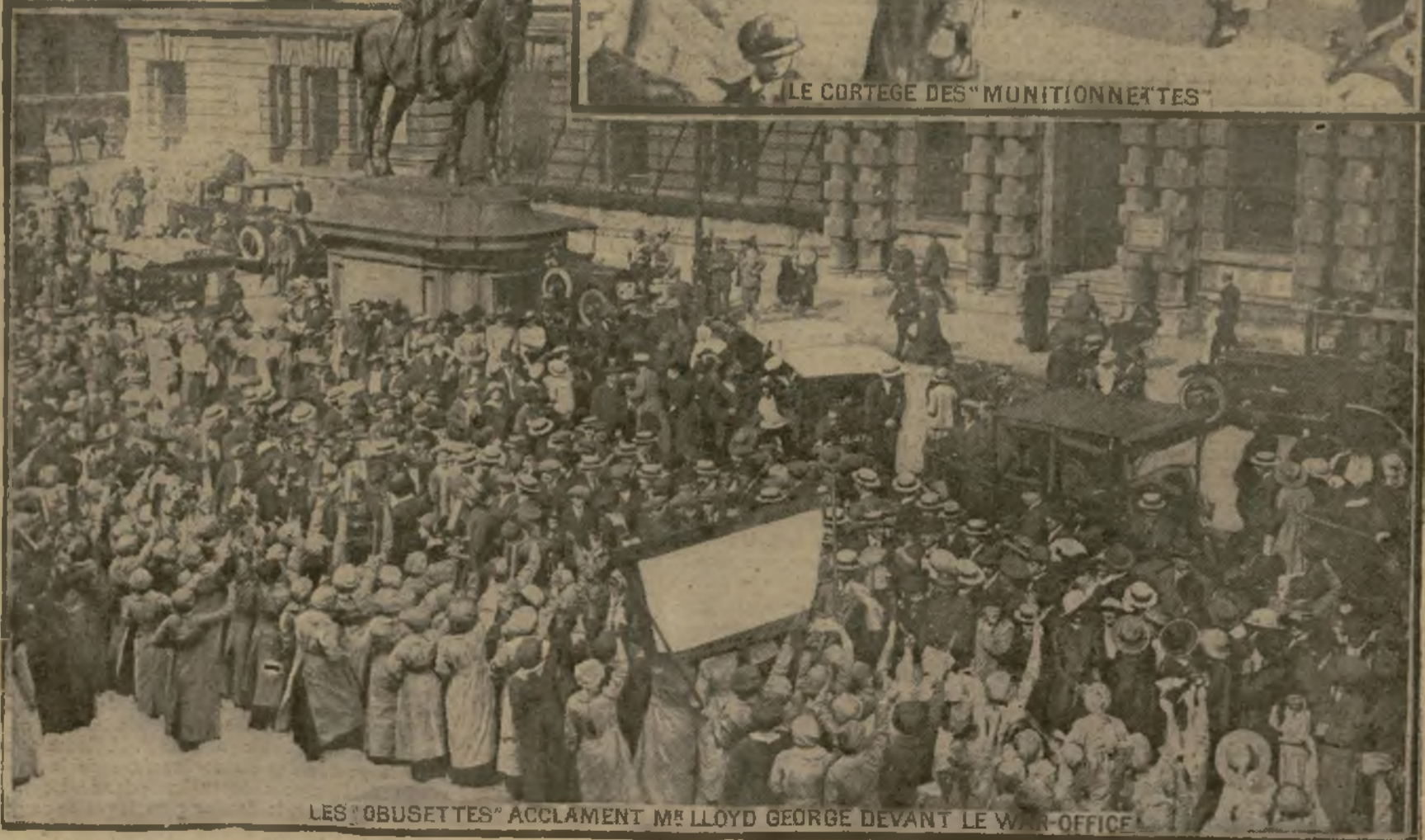
LES "OBUSSETTES" ACCLAMENT M re LLOYD GEORGE DEVANT LE WAR-OFFICE

Quand les femmes manifestent à Berlin, c'est pour s'élever contre la cherté des vivres et demander la paix; quand les Londonniennes manifestent, c'est, au contraire, pour démontrer qu'elles ont toutes le désir de voir la guerre se poursuivre vigoureusement jusqu'à la conclusion triomphale. C'est ainsi qu'on vient de voir à Londres un cortège imposant organisé par Christabel Pankhurst défilé à travers les grandes avenues de la capitale.