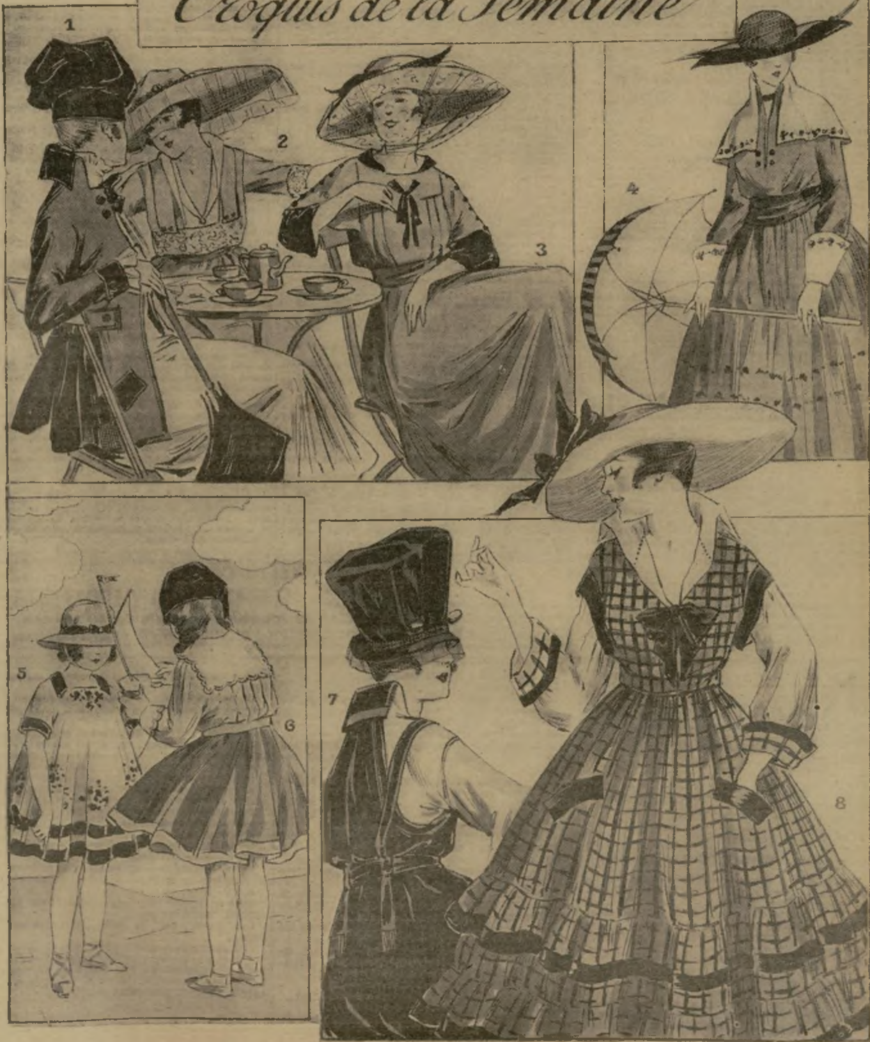
1. Tailleur de jersey : la jupe est en jersey rose, la veste en jersey taupe. Toque et ombrelle taupe. — 2. Robe de voile écaillé garnie de dentelle d'argent, grande capeline de velours vieux bleu. — 3. Petite robe de tricot de soie tourterelle avec parements et col noirs. Chapeau de feutre gris. — 4. Robe de pèlerine de coton mauve brodé. Col et manchettes d'organdi. Chapeau de liseré et velours noir. — 5 et 6. Deux petites robes d'enfant : l'une est en grosse toile blanche garnie de toile et broderie esrize; l'autre en serges bleues et serges blanches avec col festonné. — 7. Robe habillée en taffetas puce avec chapeau de velours du même ton. — 8. Robe de toile de Vichy écossaise garnie de ruban.