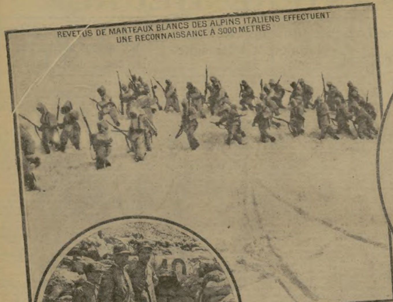
REVÊTUS DE MANTEAUX BLANCS DES ALPINS ITALIENS EFFECTUENT UNE RECONNAISSANCE A 3000 METRES