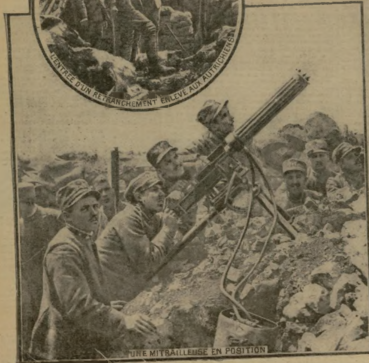
UNE MITRAILLEUSE EN POSITION