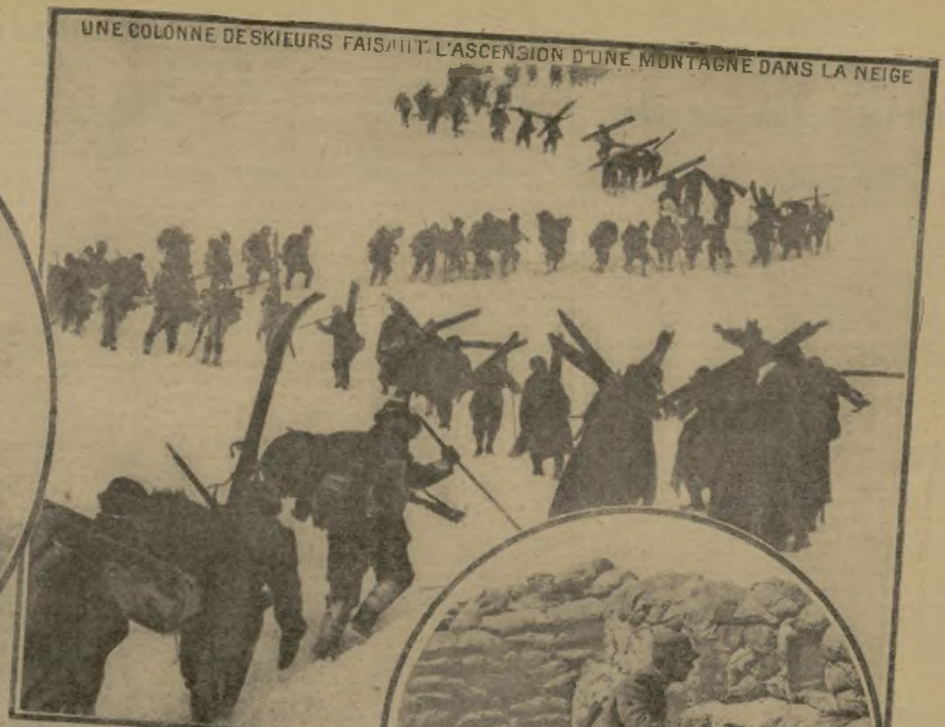
UNE COLONNE DE SKIEURS FAISAIT L'ASCENSION D'UNE MONTAGNE DANS LA NEIGE