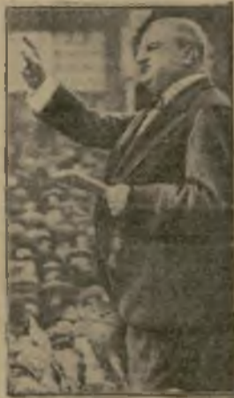
M. JOHN REDMOND

On se retourna vers David Lloyd George, qui justifia encore une fois son surnom de « Ministre de tout ce dont on a le plus besoin ». Ce dont on avait alors besoin c'était un arrangement avec le Sud irlandais, et Lloyd George accepta cette lourde mission. Il s'adjoint sir Herbert Samuel, le ministre de l'Intérieur, en plus de sir Edward Carson, qui avait sur la conscience le soulèvement de l'Ulster, et de Mr John Redmond, l'admirable orateur catholique; et, grâce à la bonne volonté patriotique de ces deux leaders, il réussit à faire accepter le principe du gouvernement autonome de l'Irlande. Six comtés de l'Ulster unioniste se trouvaient exceptés de cet arrangement à première vue boiteux mais qui se justifie quand on sait que non seulement l'Ulster ne pratique pas la religion catholique, mais encore qu'il est, pour la plus grande partie, peuplé d'émigrés écossais et gallois.