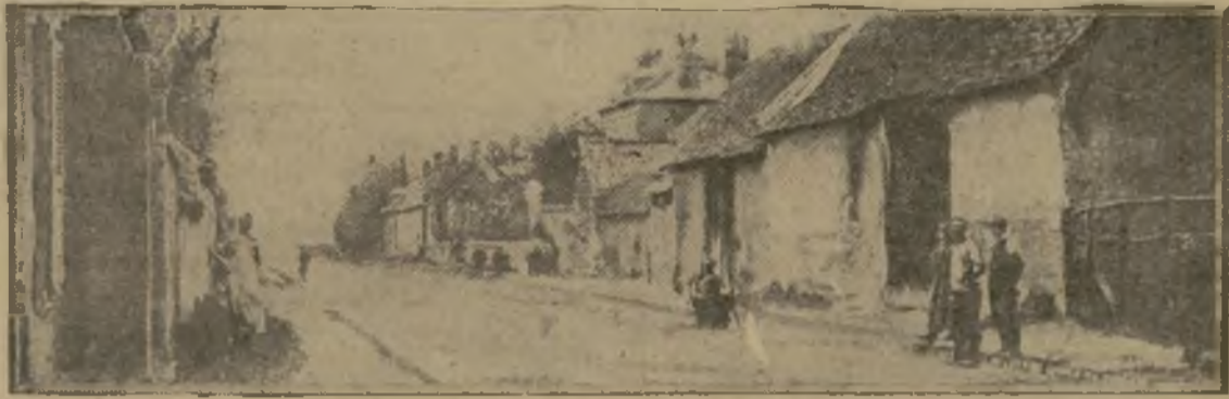
POZIERES : La route d'Albert.

Au nord de la Somme, l'effort anglais n'a pas cessé, depuis hier, de s'exercer puissant, tenace, méthodique. Nos alliés ont achevé, au cours de la nuit du 25 au 26, d'occuper les quelques maisons de Pozières où l'ennemi s'était retranché et se défendait avec des mitrailleuses. Tout le village est en ce moment en leur possession, et les troupes de la métropole, qui avaient mené l'assaut par le sud-ouest, ont progressé à l'ouest de la position, enlevant deux tranchées et faisant des prisonniers, parmi les-