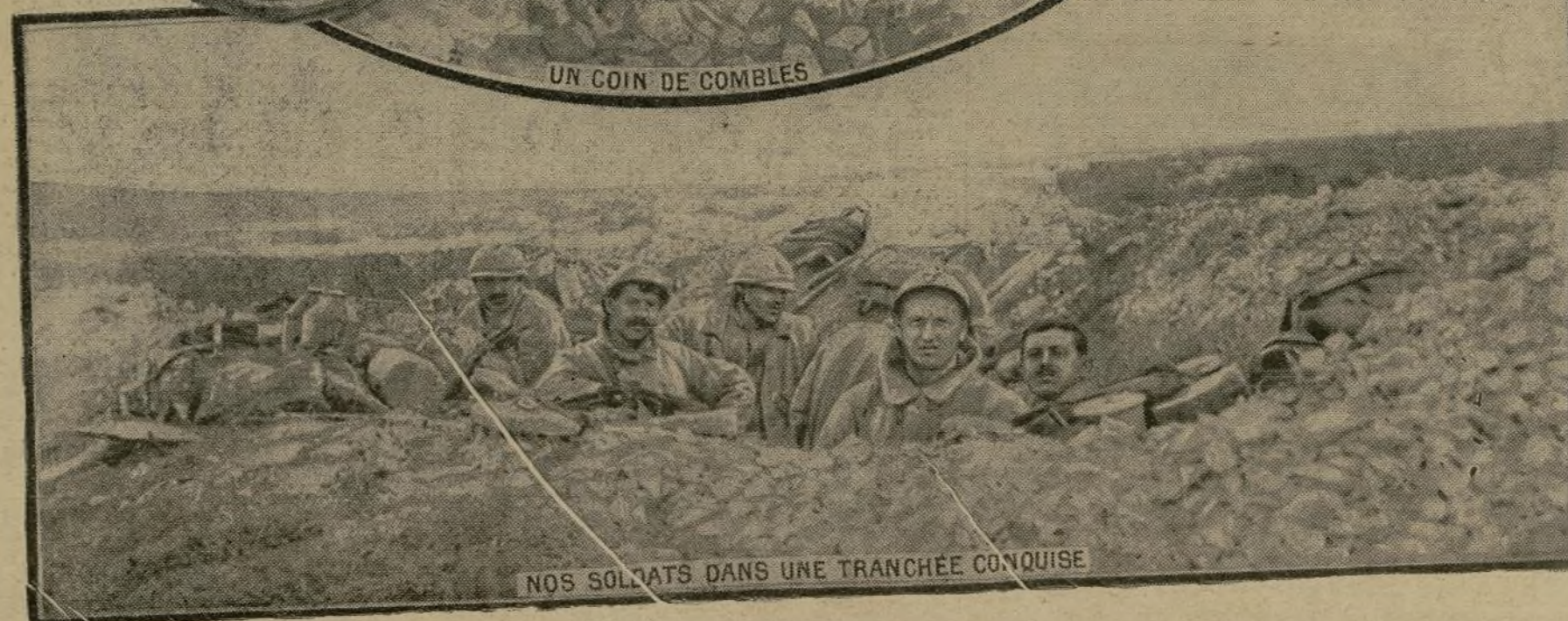
NOS SOLDATS DANS UNE TRANCHEE CONQUISE