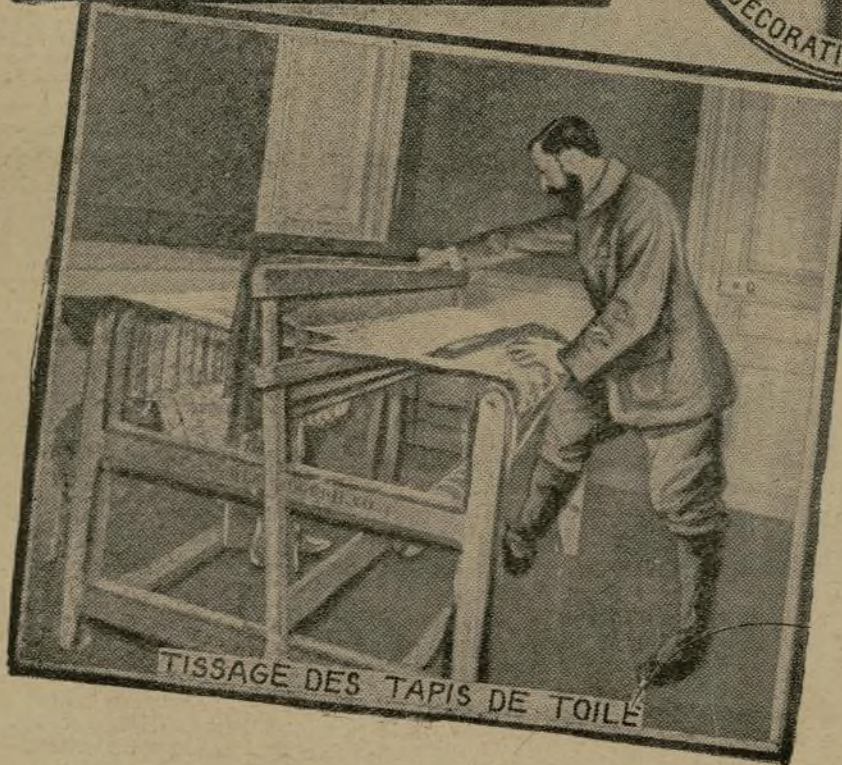
TISSAGE DES TAPIS DE TOILE