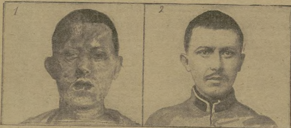
Homme brûlé à la face par l'explosion d'un 155 et traité par l'ambrine : 1. Avant le traitement; 2. Après.