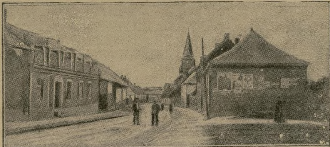
Le Transloy. — La rue de l'Eglise Ayuntamiento de Madrid