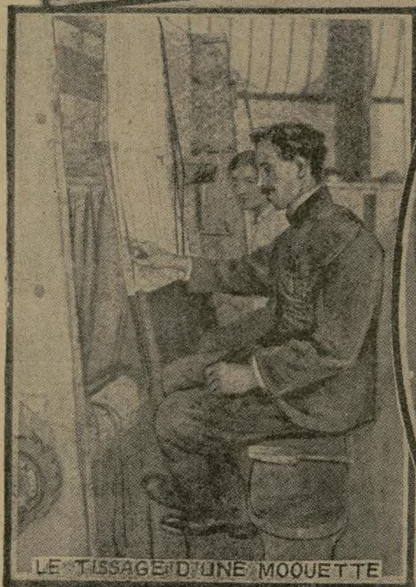
LE TISSAGE D'UNE MOQUETTE