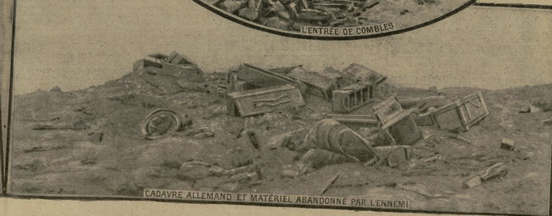
CADAVRE ALLEMAND ET MATERIEL ABANDONNE PAR L'ENNEMI

Parmi les vaillants régiments qui prirent part aux récentes actions de l'Artois, figuraient des unités de la 70 e division, que commandait le général Fayolle, devenu aujourd'hui chef d'armée. A l'issue d'une des dernières batailles, le général tint à passer en revue ces troupes qu'il avait menées au combat un an auparavant, en mai 1915, lors de la prise de Carency et d'Abbeville.