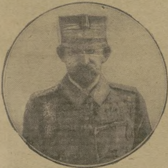
La dernière photographie du roi de Roumanie

En assumant sa part du fardeau dans cette vaste lutte, la Roumanie ne s'est pas inspirée de maximes cyniques et réalistes, elle n'a pas trahi les puissances de l'Europe Centrale, elle a obéi au principe de son idéal national. Il y a dans tous les pays des courants d'opinion puissants qui sont plus instinctifs que politiques. En Roumanie