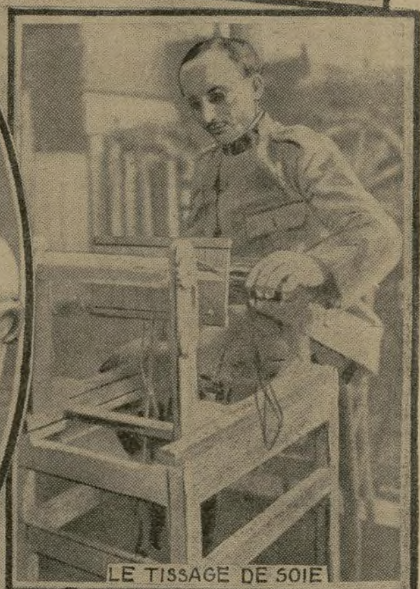
LE TISSAGE DE SOIE