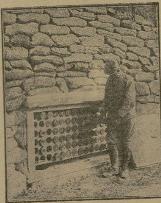
Sur le Carso, le roc est si dur que nos alliés italiens, ne pouvant creuser des abris, sont obligés d'aménager avec des sacs de sable leurs dépôts de munitions

ZURICH, 13 octobre. — Le comte Tisza est arrivé mercredi à Vienne. Il a eu, dans la journée même, d'importantes entrevues avec l'empereur François-Joseph, le baron Burian et le comte Czernin, ancien ambassadeur d'Autriche-Hongrie en Roumanie. (Information.)