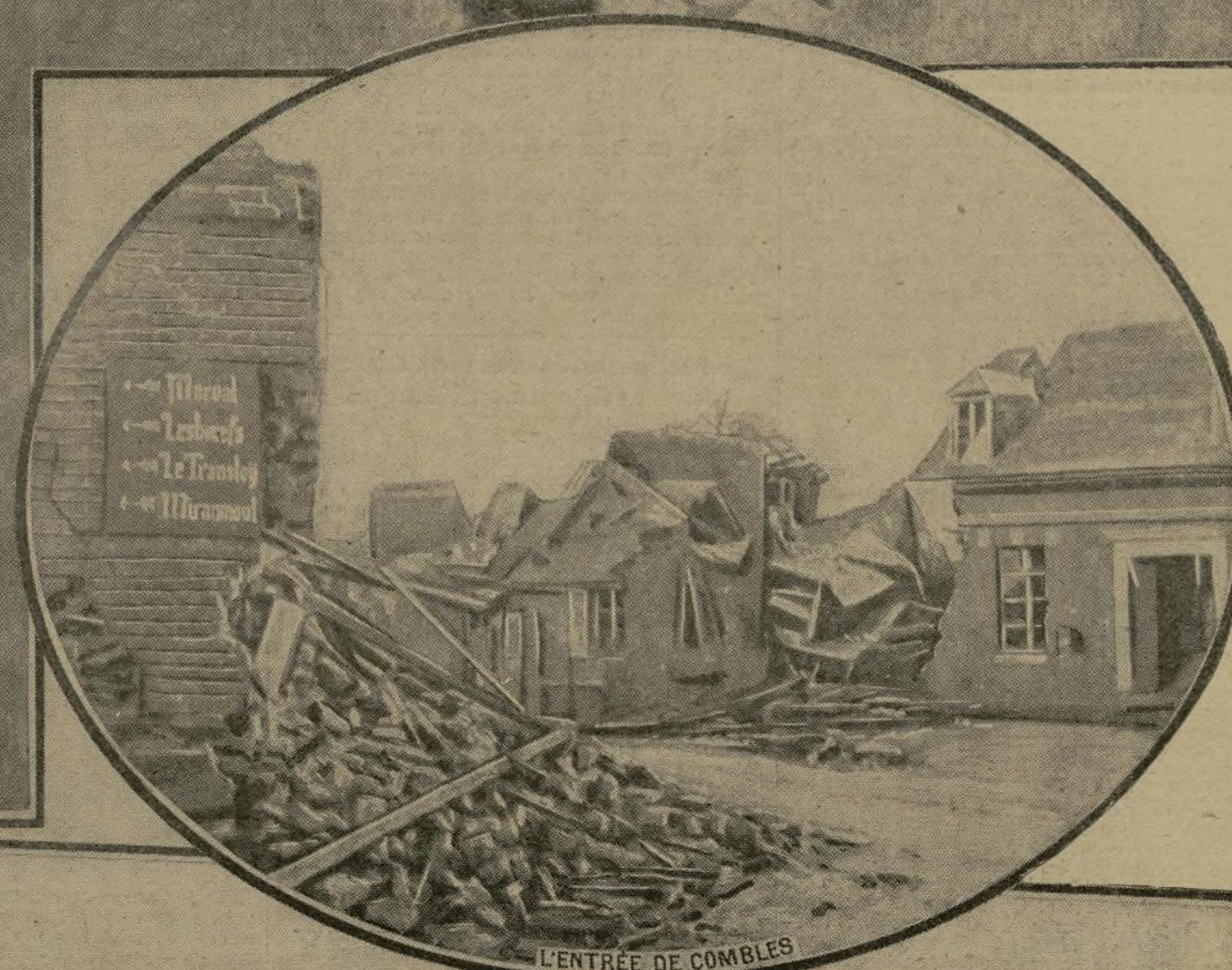
L'ENTRÉE DE COMBLES