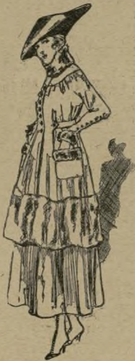
Tailleur de bure canelle garni de castor naturel