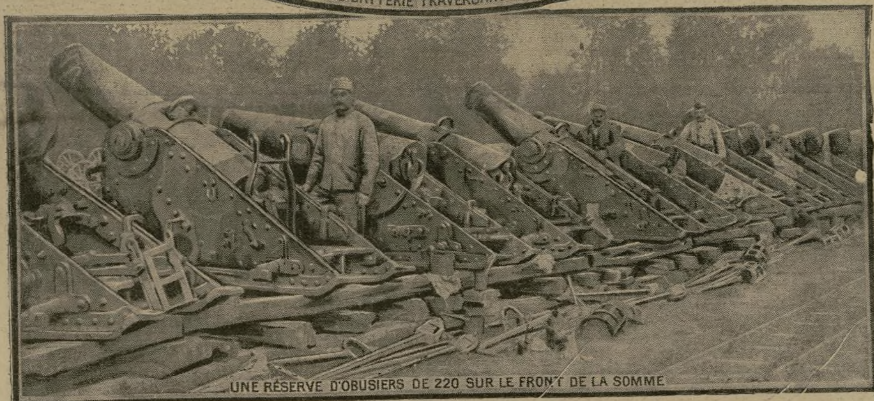
UNE RÉSERVE D'OBUSIERS DE 220 SUR LE FRONT DE LA SOMME

Cette muraille de fer ne fait-elle pas image et n'évoque-t-elle pas avec une forte éloquence le rempart d'artillerie que notre effort persévérant sut dresser face à l'ennemi et à l'aide duquel il l'oblige à reculer pas à pas ? Le général Joffre le redisait hier encore dans un ordre du jour à ses poilus, à l'occasion de l'Emprunt : « Plus la France aura d'argent, plus elle pourra prodiguer les munitions et économiser les vies humaines. »