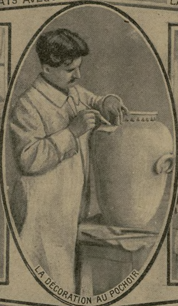
LA DÉCORATION AU POCHOIR