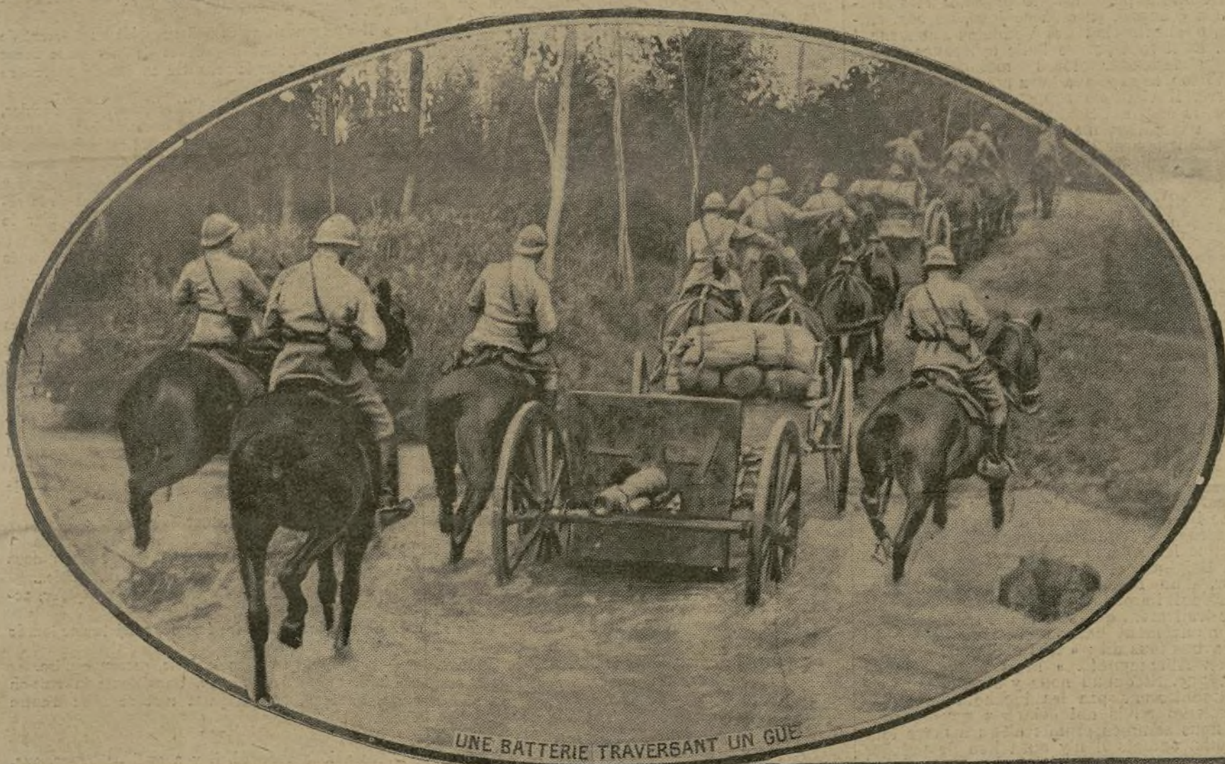
UNE BATTERIE TRAVERSANT UN GUE

CEUX QUI OUUVRENT LES ROUTES DE LA VICTOIRE