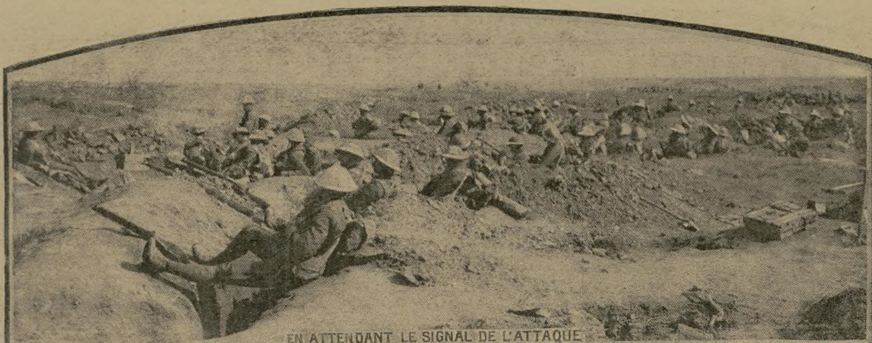
EN ATTENDANT LE SIGNAL DE L'ATTAQUE