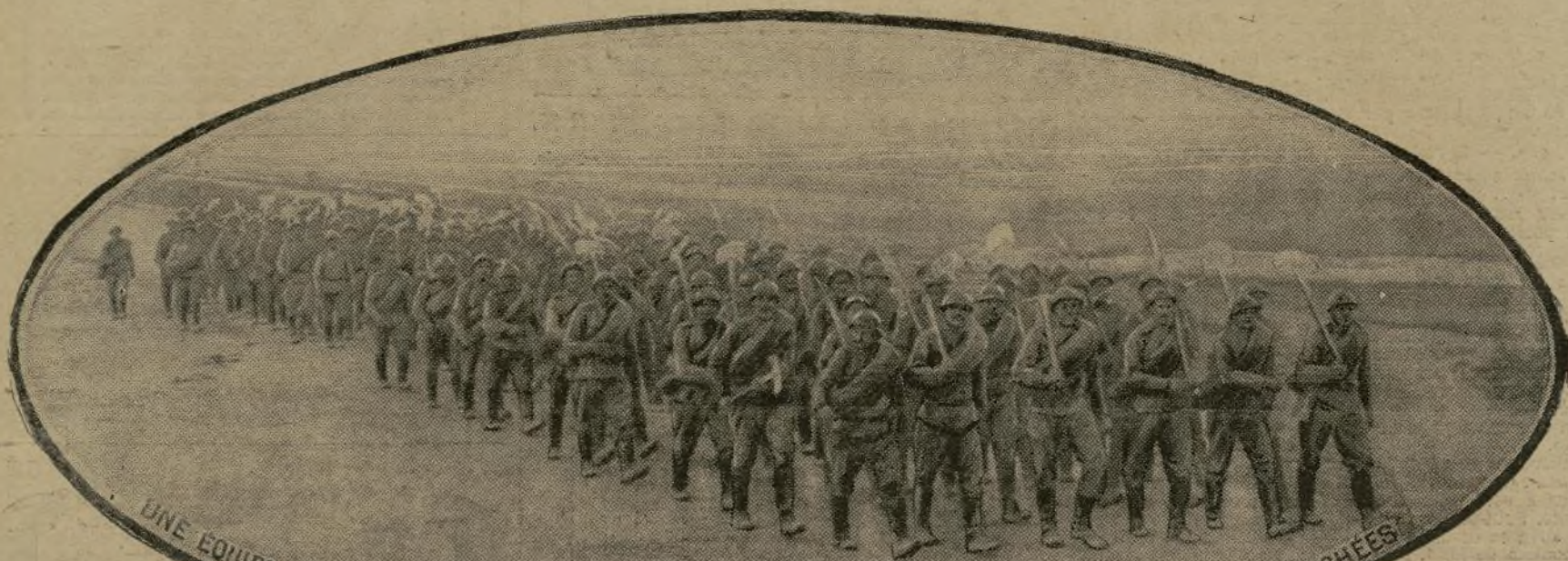
UNE EQUIPE DE SOLDATS RUSSES SE DIRIGEANT VERS LE FRONT OU ILS VONT CREUSER DES TRANCHEES