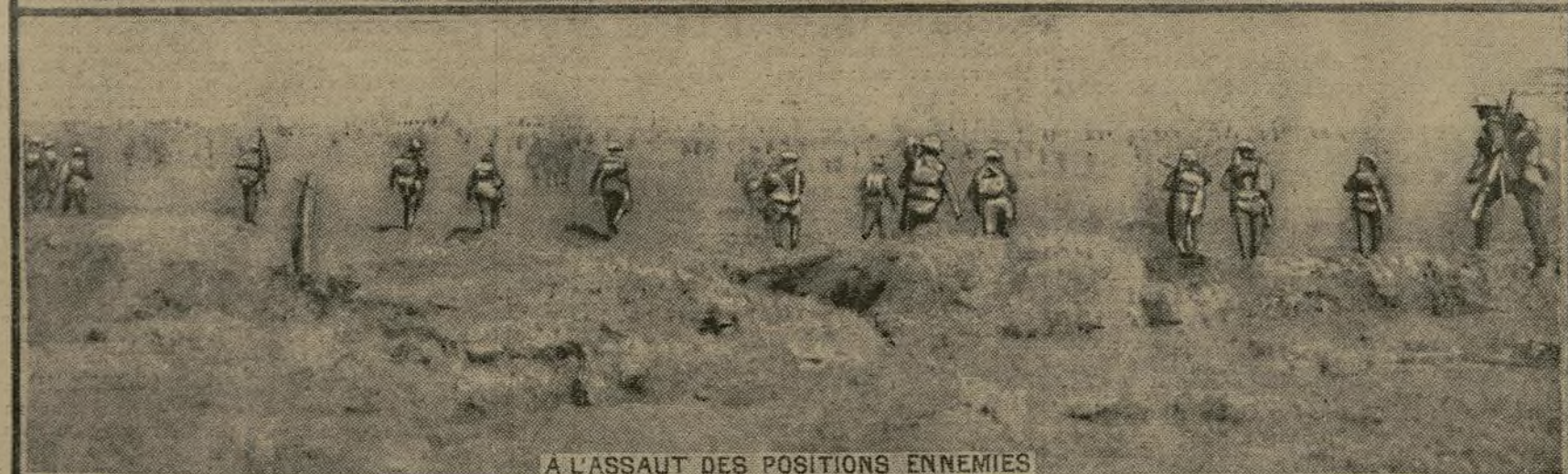
A L'ASSAUT DES POSITIONS ENNEMIES