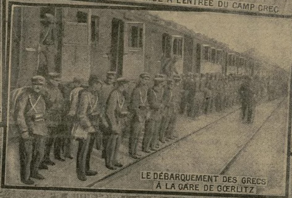
LE DÉBARQUEMENT DES GRECS À LA GARE DE GÖRLITZ