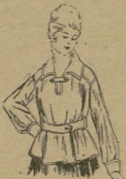
Casaque de crépon de laine vieux bleu

La casaque, qui n'est en somme qu'une blouse trop longue posée sur la jupe et plus ou moins serrée par une ceinture, est fort à la mode cette année. Elle est très facile à faire et les femmes qui aiment coudre se risquent volontiers à son exécution. Celle-ci