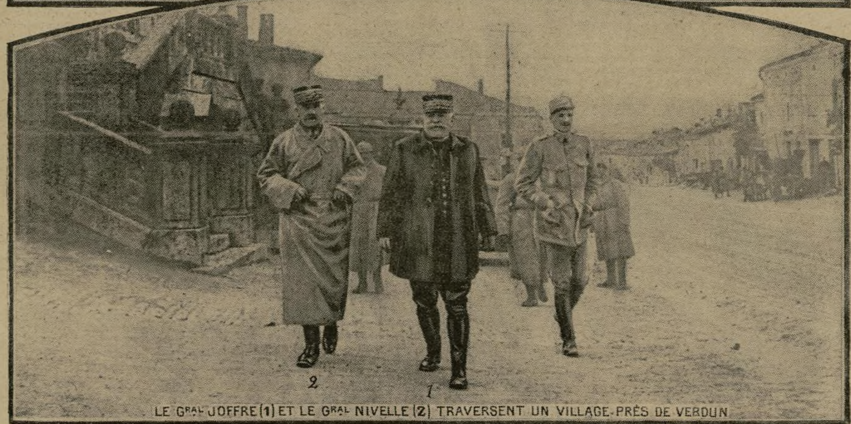
LE GRAL JOFFRE (1) ET LE GRAL NIVELLE (2) TRAVERSENT UN VILLAGE PRÈS DE VERDUN

Depuis que l'offensive de la Somme a pris l'importance que l'on sait, les Allemands ont été contraints de renoncer à leur intention de s'emparer de Verdun. Les dernières actions importantes engagées dans le secteur de la Meuse se sont toujours traduites par des succès à l'actif de nos troupes. Le général Joffre s'est rendu, il y a peu de jours, dans cette région. Il s'y rencontra avec le général Nivelle et eut, une fois de plus, l'occasion de lui renouveler l'expression de la gratitude nationale envers les sublimes héros qui ont interdit à l'ennemi de réaliser son rêve présomptueux.