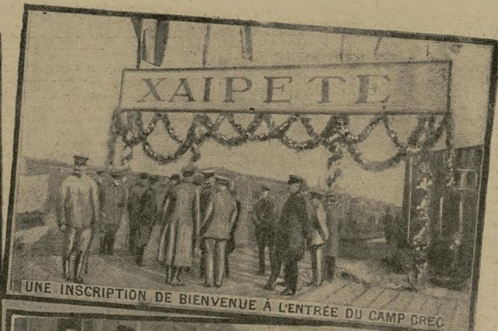
UNE INSCRIPTION DE BIENVENUE A L'ENTREE DU CAMP GREC