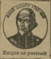
Exiger ce portrait

C'est surtout chez la Femme que cette nécessité devient une loi. En effet, la Femme est exposée à un grand nombre de mala-dies, depuis l'âge de la Formation jusqu'au Retour d'Age, et nulle ne doit ignorer que la JOUVENCE de l'Abbé SOURY, préparée avec des plantes dont les poi-sons sont rigoureuse-ment exclus, guérit tou-jours sans poisons ni opérations les Maladies Intérieures : Métrites, Fibromes, mauvaises Suites de Couches, Tu-meurs, Cancers, Hémor-ragies, Pertes Blanches; elle régularise la cir-culation du Sang, fait disparaître les Varices, les Hémorrhoides, les Maladies de l'Estomac, de l'Intestin et des Nerfs.