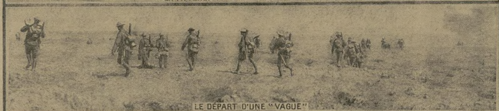
LE DÉPART D'UNE "VAGUE"