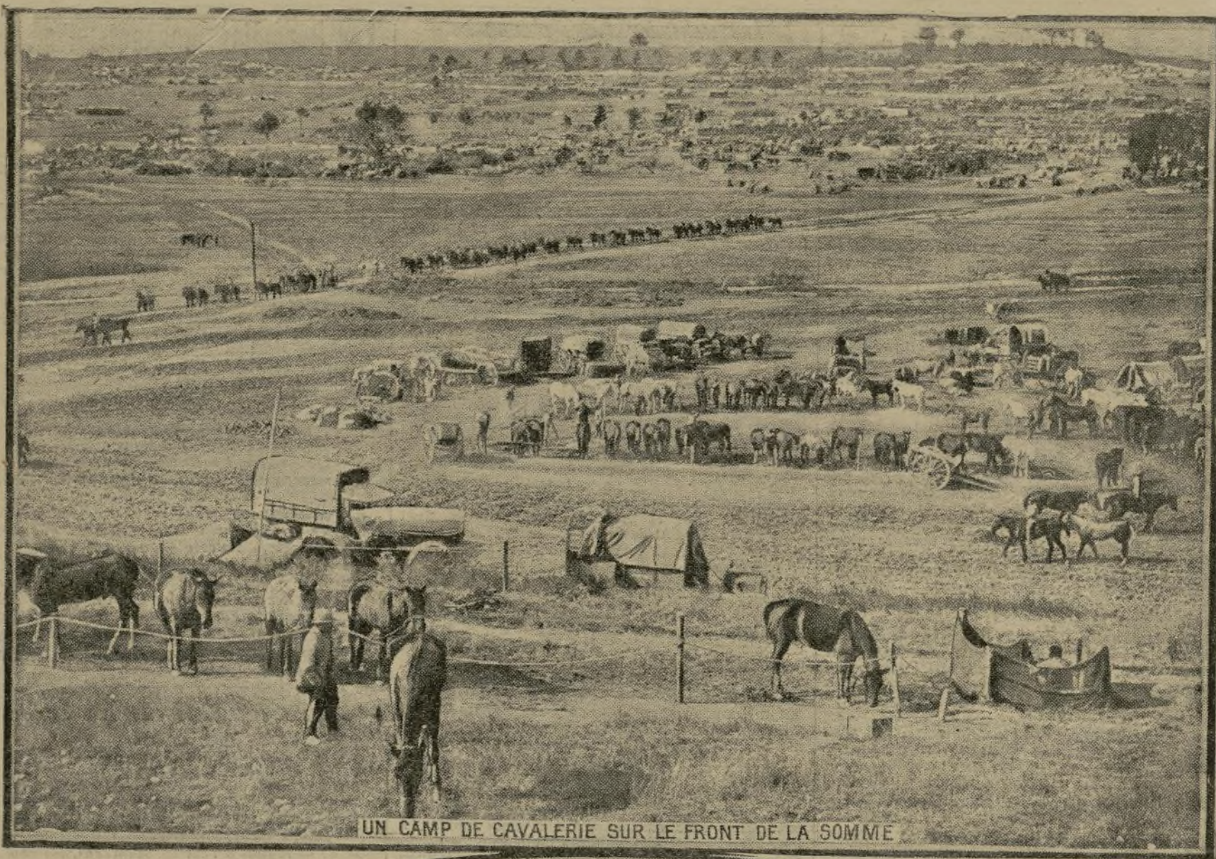
UN CAMP DE CAVALERIE SUR LE FRONT DE LA SOMME