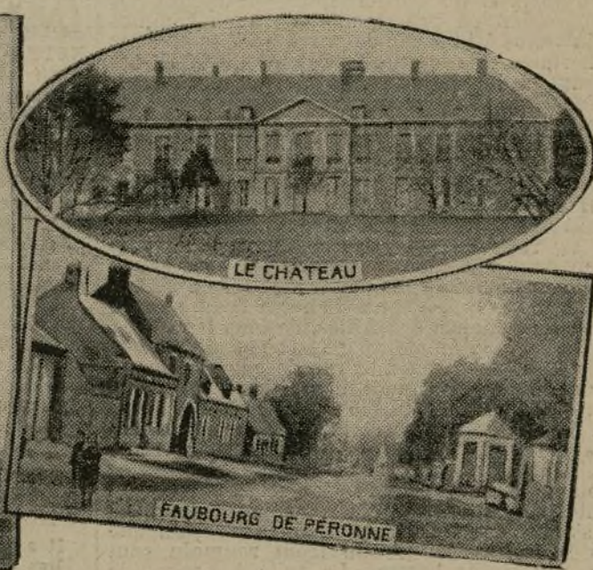
LE VILLAGE DE SAILY-SAILLISEL

Les combats du 18 octobre ont mis nos troupes en possession de Saily-Saillisel, et la journée du 19 leur a permis de consolider les positions conquises. L'ennemi a réagi avec vigueur : il a lancé plusieurs contre-attaques qui ont été toutes repoussées. Nos troupes ont maintenu complètement leurs gains.