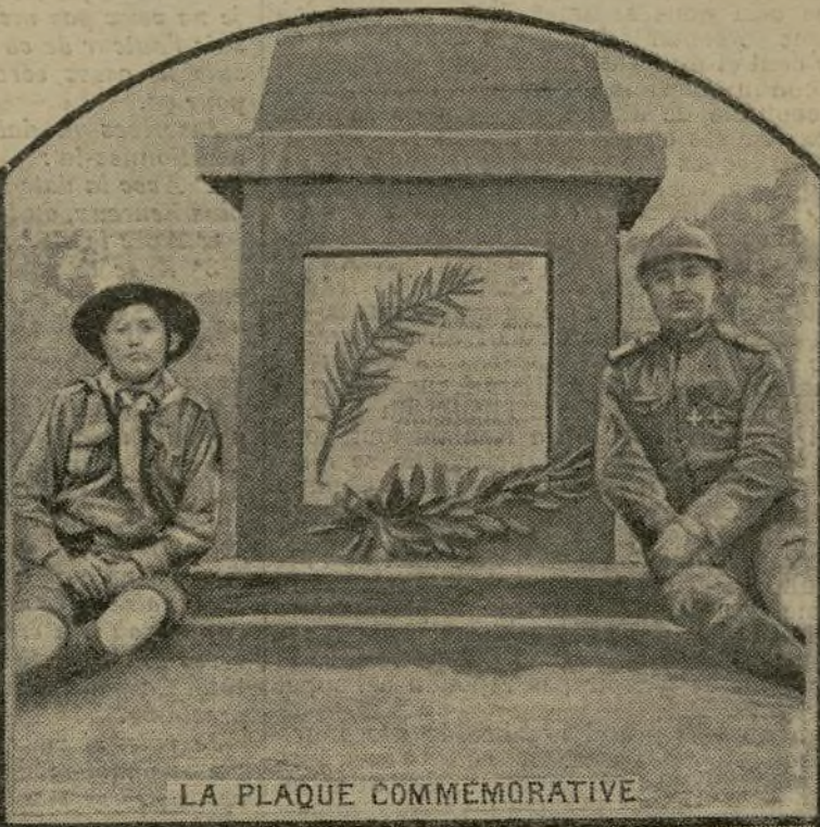
LA PLAQUE COMMÉMORATIVE