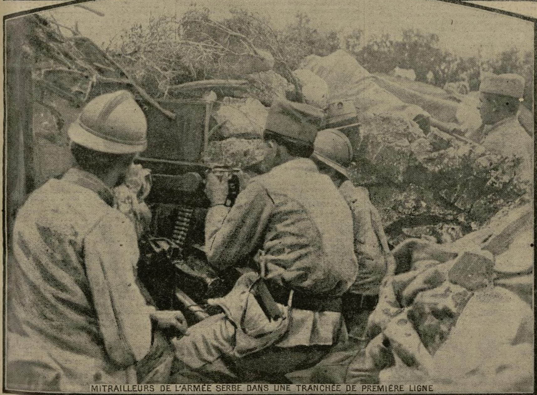
MITRAILLEURS DE L'ARMÉE SERBE DANS UNE TRANCHEE DE PREMIERE LIGNE

Sur les fronts français et serbe, la bataille de Macédoine reste toujours aussi intense et les troupes du prince Alexandre viennent, malgré la résistance opiniâtre de l'ennemi, de remporter de sensibles avantages sur les effectifs bulgares opérant dans la zone montagneuse du Dobropotje, tandis que par ailleurs, sur la rive gauche de la Crta, elles s'emparaient du village de Brod.