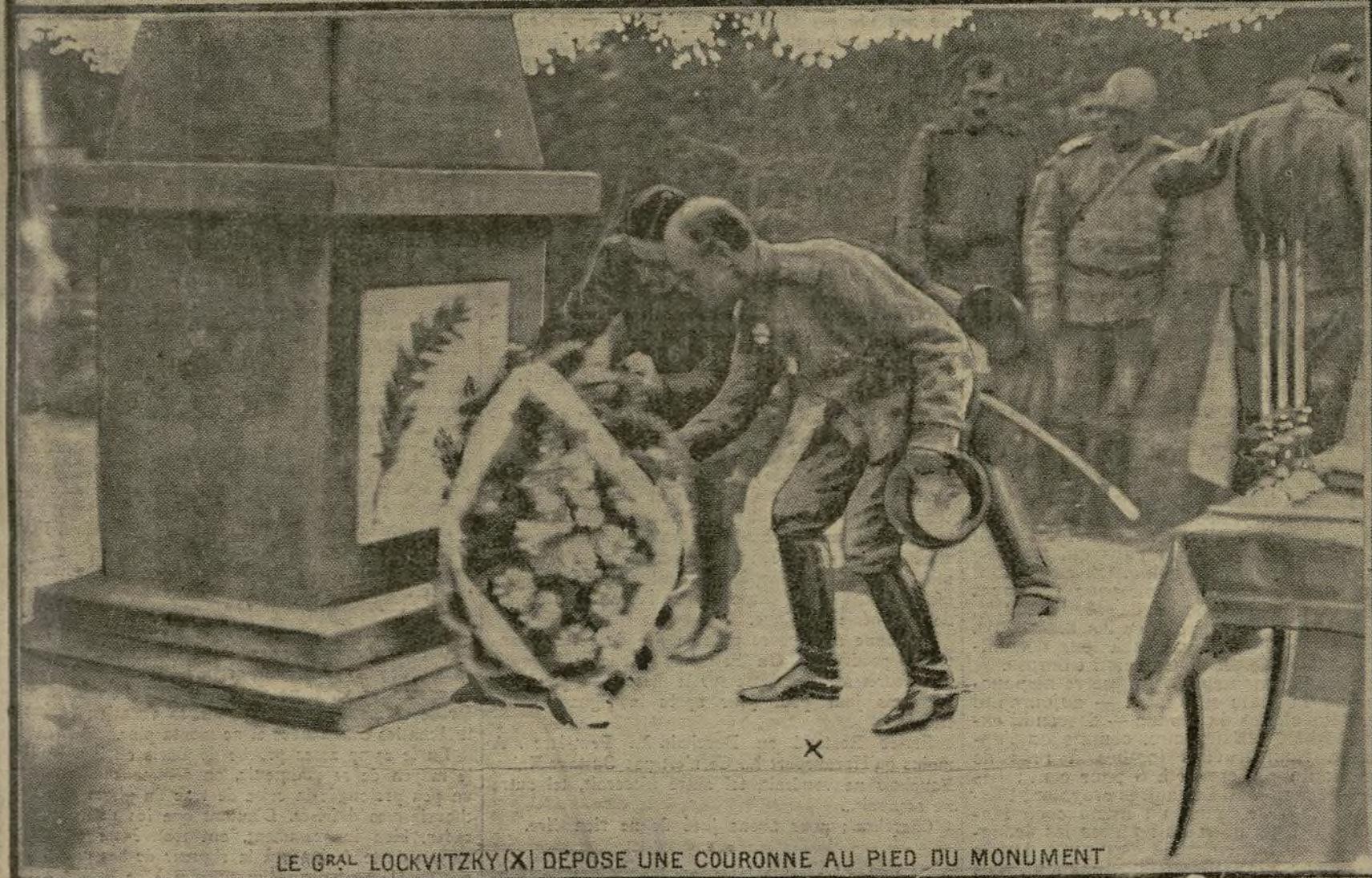
LE GRAL LOCKVITZKY (X) DÉPOSE UNE COURONNE AU PIED DU MONUMENT

Les boy-scouts français de Châlons-sur-Marne ont eu une pensée des plus nobles : ils ont réuni les fonds nécessaires à l'édification d'un monument commémoratif qui rappellera désormais, sur le sol de la Champagne, l'héroïsme des soldats russes tombés dans nos rangs pour la cause commune. Ce monument a été inauguré le 12 septembre dernier, et, autour de la plaque portant la palme glorieuse, ont été rapprochées les fleurs offertes par ces jeunes patriotes et par un général russe, au nom de ses troupes.