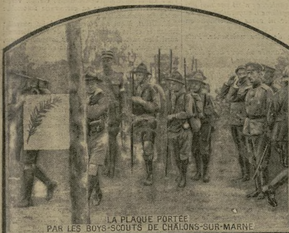
LA PLAQUE PORTÉE PAR LES BOYS-SCOUTS DE CHÂLONS-SUR-MARNE