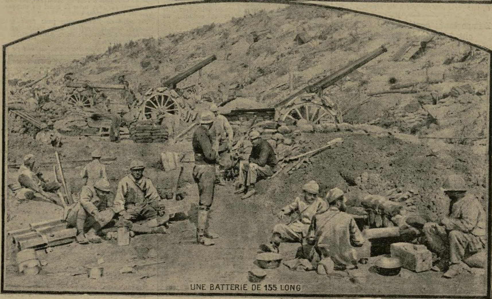
UNE BATTERIE DE 155 LONG

Tandis que notre artillerie martèle de plus en plus les lignes ennemies sur le front de la Somme, notre infanterie ajoute les succès aux succès. Les derniers furent la prise de Saily-Saillisel et une importante avance entre La Maisonnette et Biaches. A l'arrière du front, notre cavalerie est installée dans des camps où les hommes, dont la plupart ont déjà fait le service de fantassin dans les tranchées, poursuivent leur entraînement.