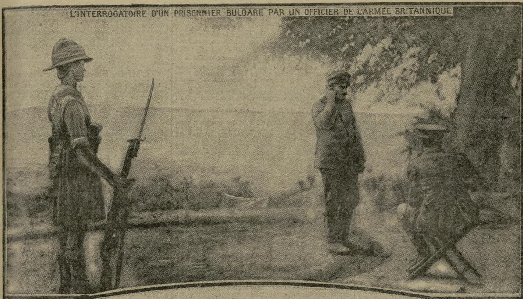
L'INTERROGATOIRE D'UN PRISONNIER BULGARE PAR UN OFFICIER DE L'ARMÉE BRITANNIQUE