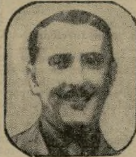
LIEUTENANT NOËL DE ROCHEFORT

Le lieutenant Noël de Rochefort a été tué le 16 septembre, au cours d'une mission de chasse. Plusieurs fois cité à l'ordre de l'armée, chevalier de la Légion d'honneur, médaillé militaire, décoré de la croix militaire anglaise, le lieutenant Noël de Rochefort était hautement estimé de ses chefs.