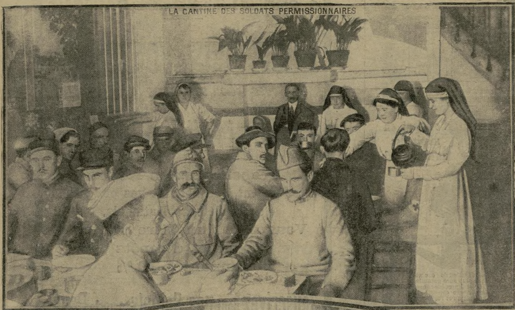
LA CANTINE DES SOLDATS PERMISSIONNAIRES