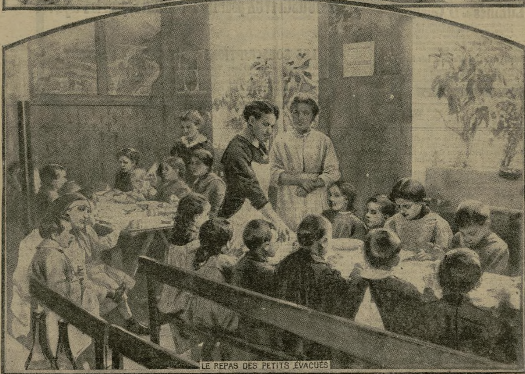
LE REPAS DES PETITS ÉVACUÉS

Dans le quartier de Saint-Germain-des-Prés, une nouvelle cantine-modèle vient d'être inaugurée par Mme Poincaré. On y distribue depuis hier des soupes populaires, des repas aux soldats permissionnaires, ainsi qu'aux enfants des régions évacuées. Nos poilus de passage y trouvent même des dortoirs. Les repas leur sont servis par des dames patronnesses qui sont, en majorité, des universitaires. Tout permissionnaire, pendant son séjour, y touche une allocation quotidienne de cinquante centimes.