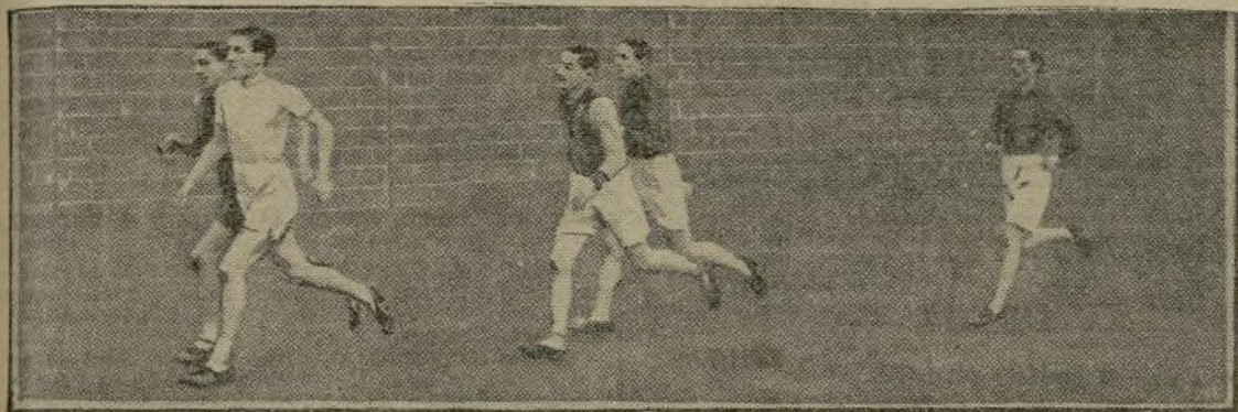
FETE SPORTIVE DE CLICHY. — Un passage de la course de 2.000 mètres.