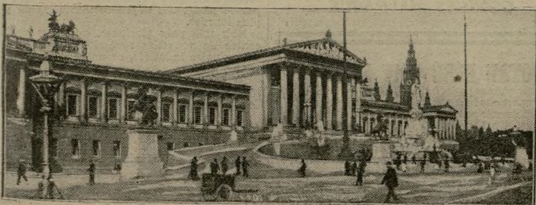
Le Reichsrat, parlement autrichien, clos depuis 1915