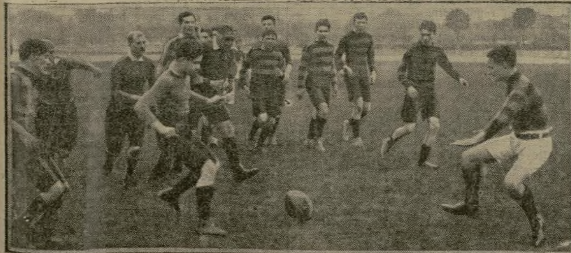
FOOTBALL RUGBY. — Stade Français contre Vétro-Sport Alfortien.

Le Prix d'Ouverture (F.C.A.F.). — La première épreuve officielle de la F.C.A.F. a été courue hier matin à Clamart. Quarante-quatre coureurs, représentant six clubs, étaient engagés. Le parcours mesurait 5 kilomètres.