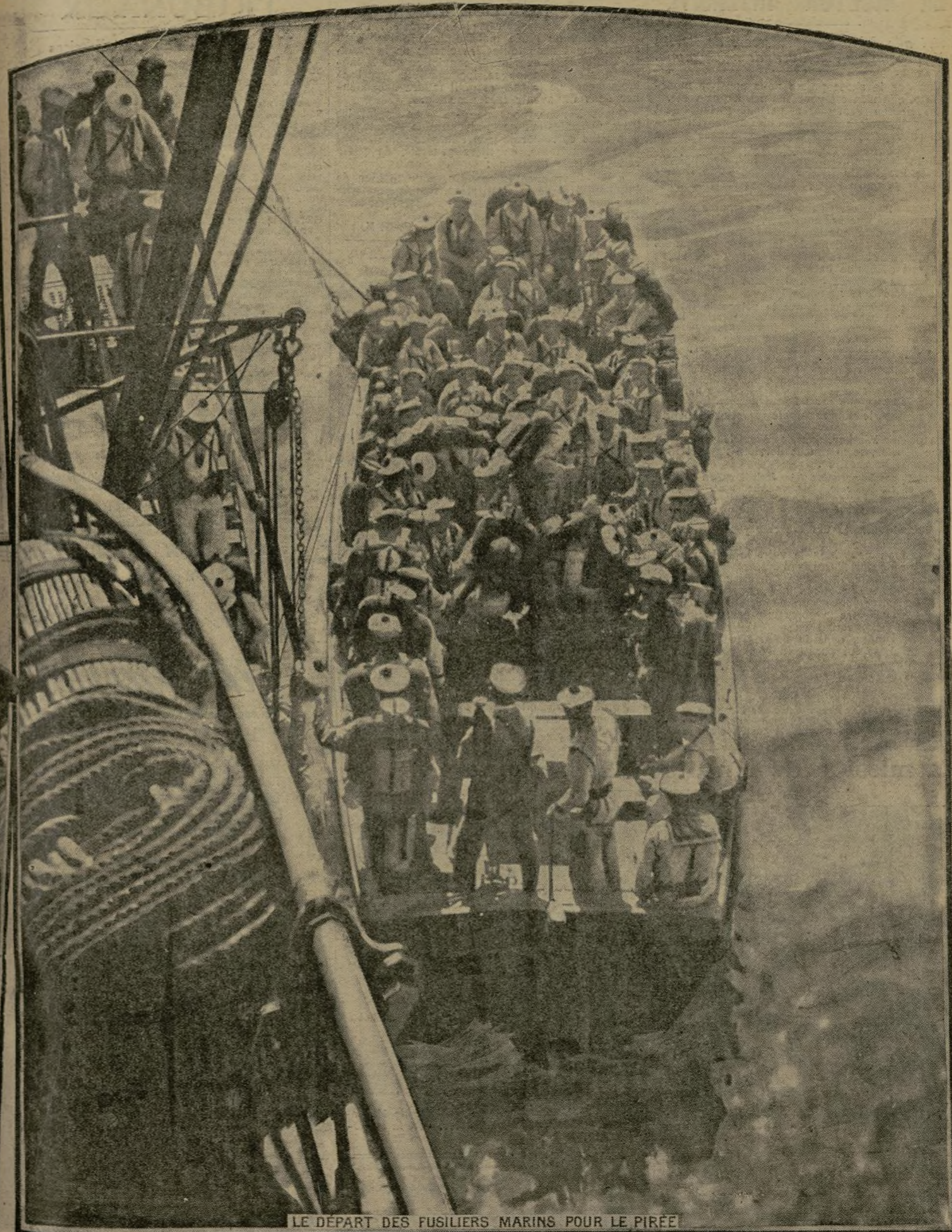
LE DÉPART DES FUSILIERS MARINS POUR LE PIRÉE

On n'a pas oublié que, à la suite de manifestations contre l'Entente, et dont les promoteurs — en grande partie réservistes germanophiles — se portèrent jusque sous les fenêtres de notre légation à Athènes, l'amiral Dartige du Fournet ordonna le débarquement d'un contingent de marins qui, aussitôt, assurèrent la police de la ville et l'exécution des mesures énergiques