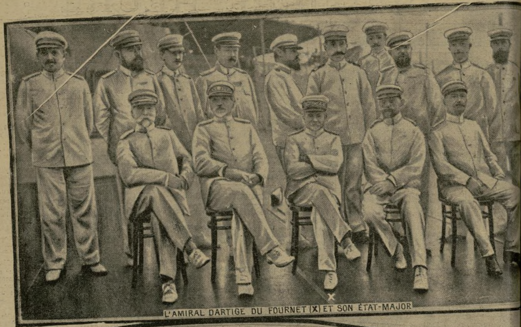
L'AMIRAL DARTIGE DU FOURNET (X) ET SON ÉTAT-MAJOR