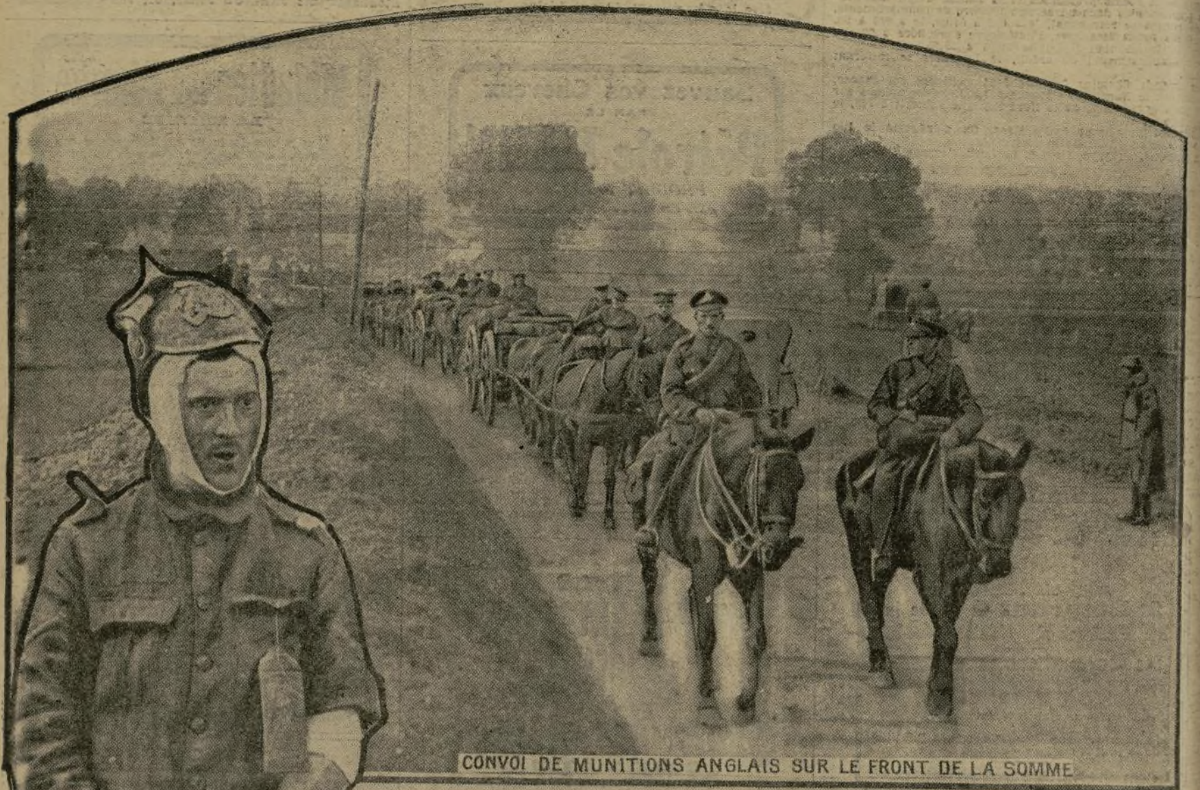
CONVOI DE MUNITIONS ANGLAIS SUR LE FRONT DE LA SOMME