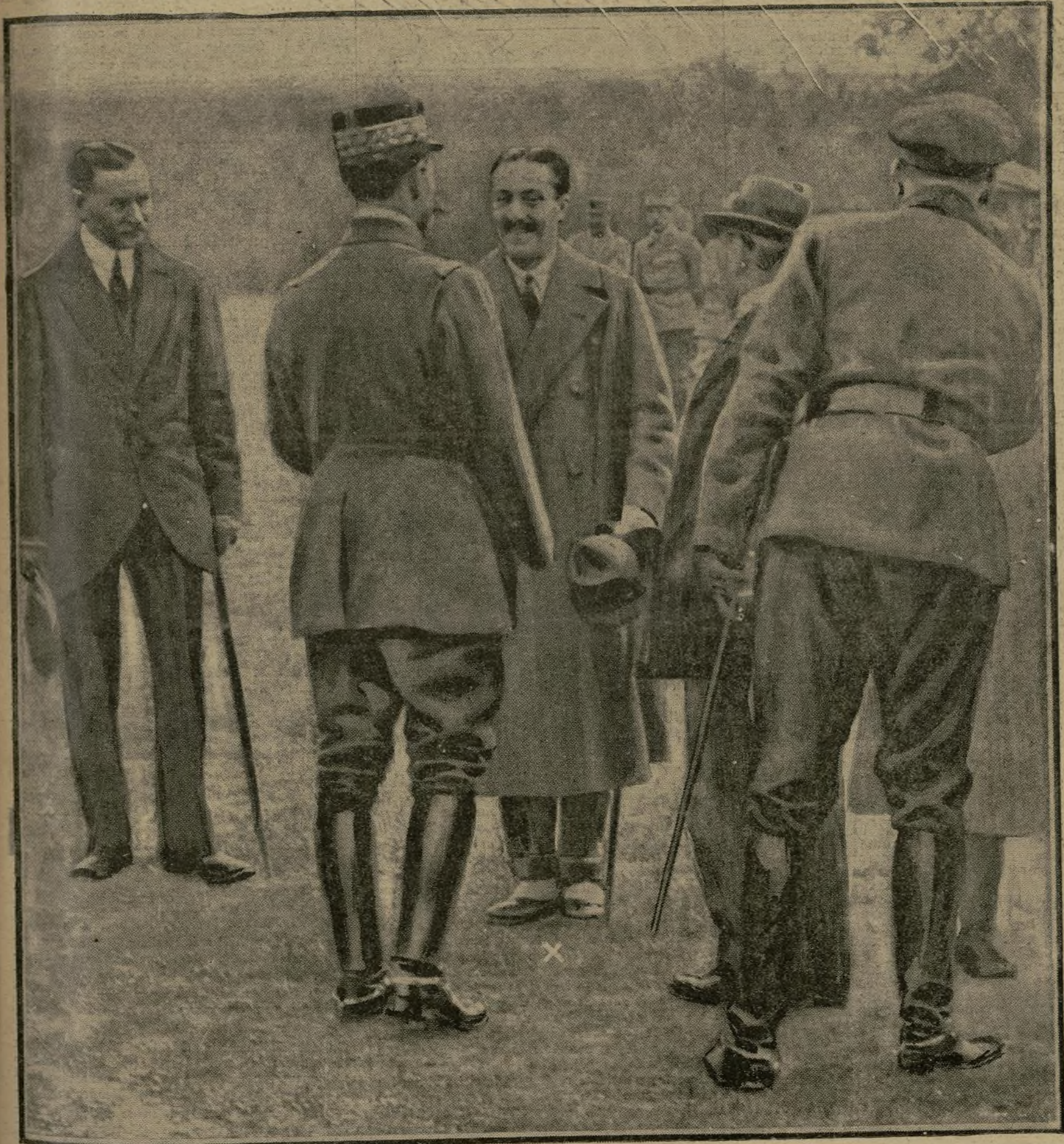
La mission espagnole actuellement à Paris a pour président le duc d'Albe (+), qui, retenu à l'étranger, n'a pu arriver dans notre capitale en même temps que ses collègues. Il y a peu de temps, le duc fit un séjour en France, au cours duquel il visita le front occidental, et fut reçu, en Champagne, par le général Gouraud, avec lequel on le voit ici échangeant une cordiale poignée de mains.