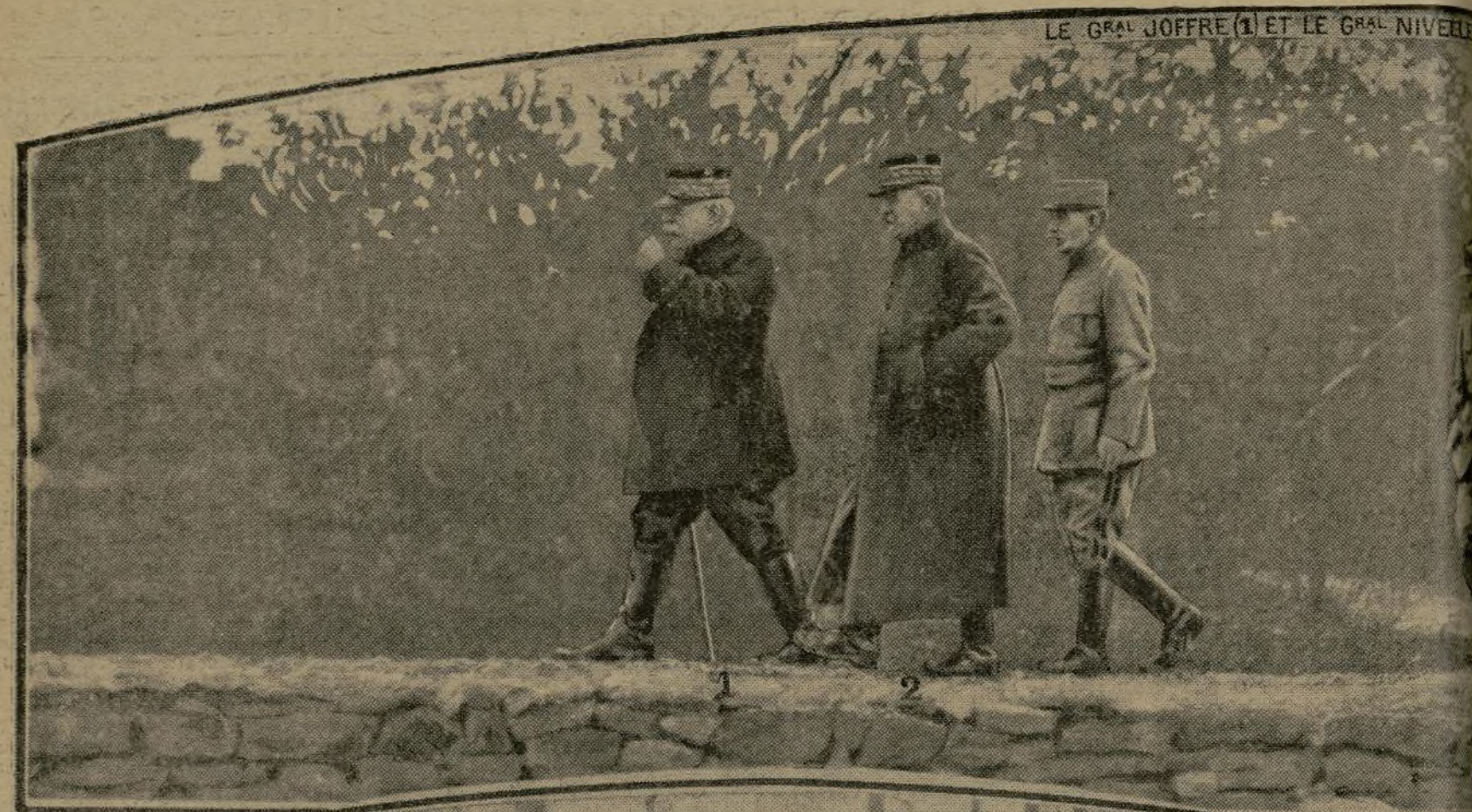
LE GRAL JOFFRE (1) ET LE GRAL NIVELLE (2) EN ROUTE SUR LE TERRAIN DE L'ACTION