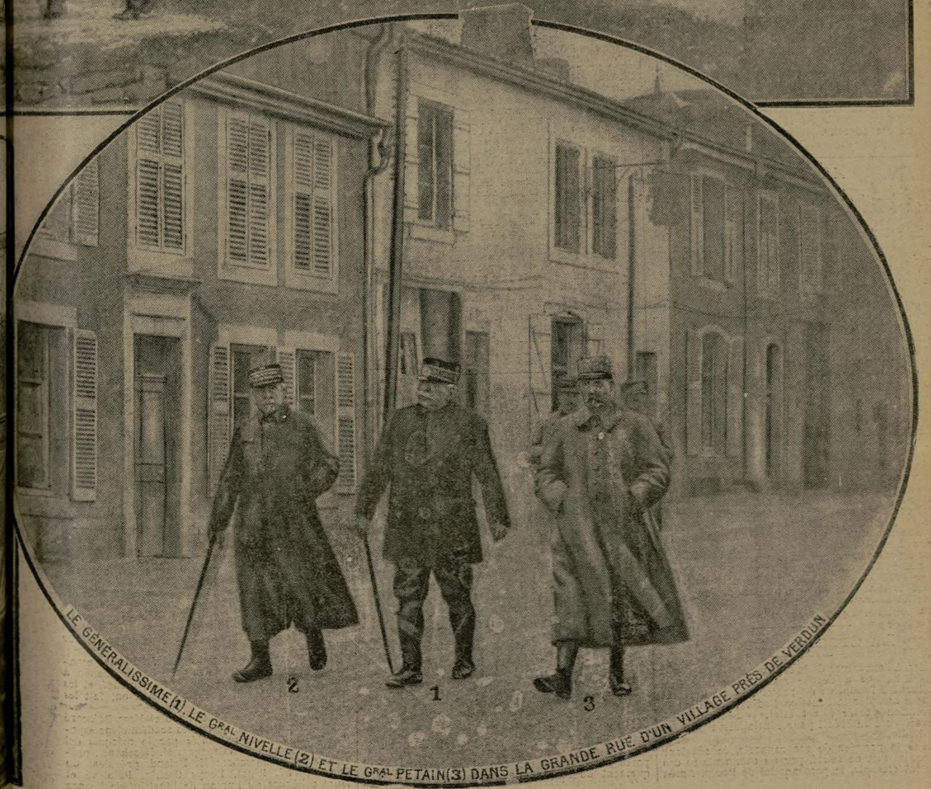
LE GENERALISSIME (1), LE GRAL NIVELLE (2) ET LE GRAL PETAIN (3) DANS LA GRANDE RUE D'UN VILLAGE PRES DE VERDUN

Les plans de l'offensive foudroyante qui vient de permettre à nos irrésistibles soldats de la Meuse de reprendre en sept heures ce que les Allemands nous avaient arraché, bribe à bribe, en cinq mois, ont été conçus par les généraux Nivelle, commandant la 2 e armée; Mangin, à qui fut confiée la conduite de l'attaque, et Pétain, chef du groupe des armées du Centre. Un conseil fut tenu,