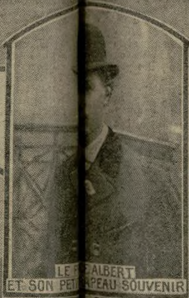
LE PRINCE ALBERT ET SON PETIT SOUTIEN