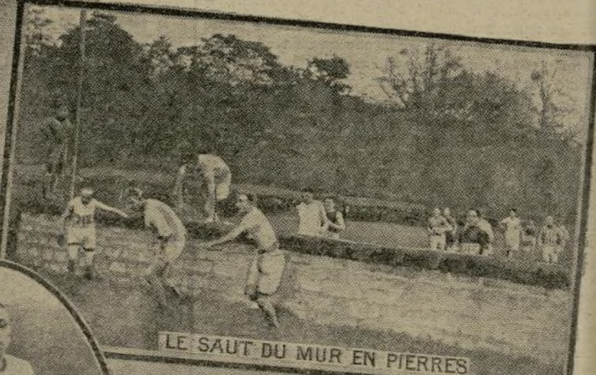
LE SAUT DU MUR EN PIERRES