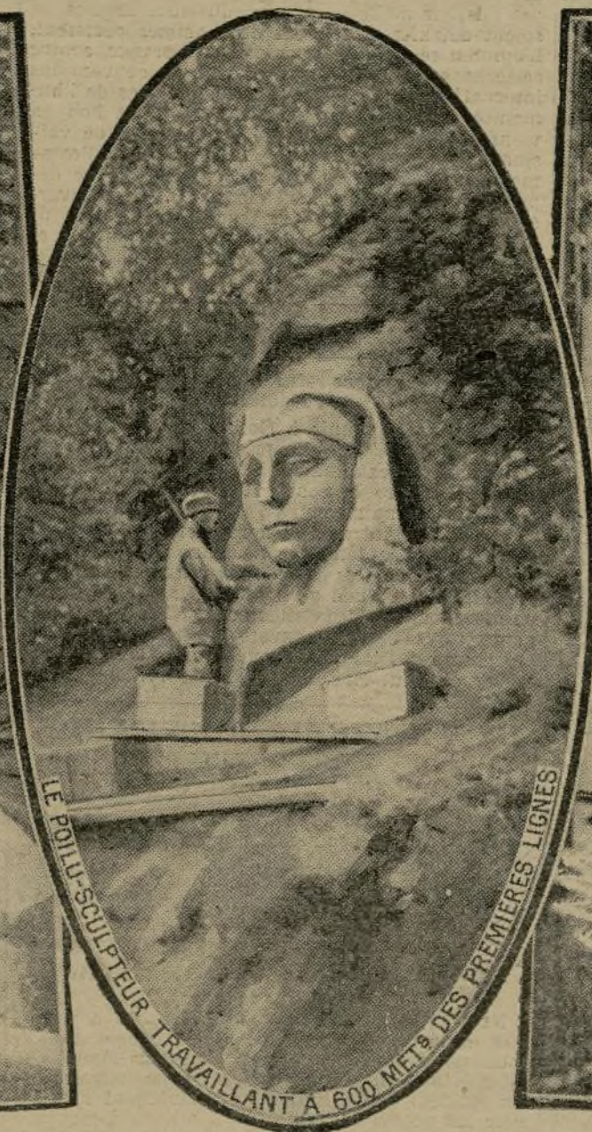
LE POILU-SCULPTEUR TRAVAILLANT A 600 METS DES PREMIERES LIGNES