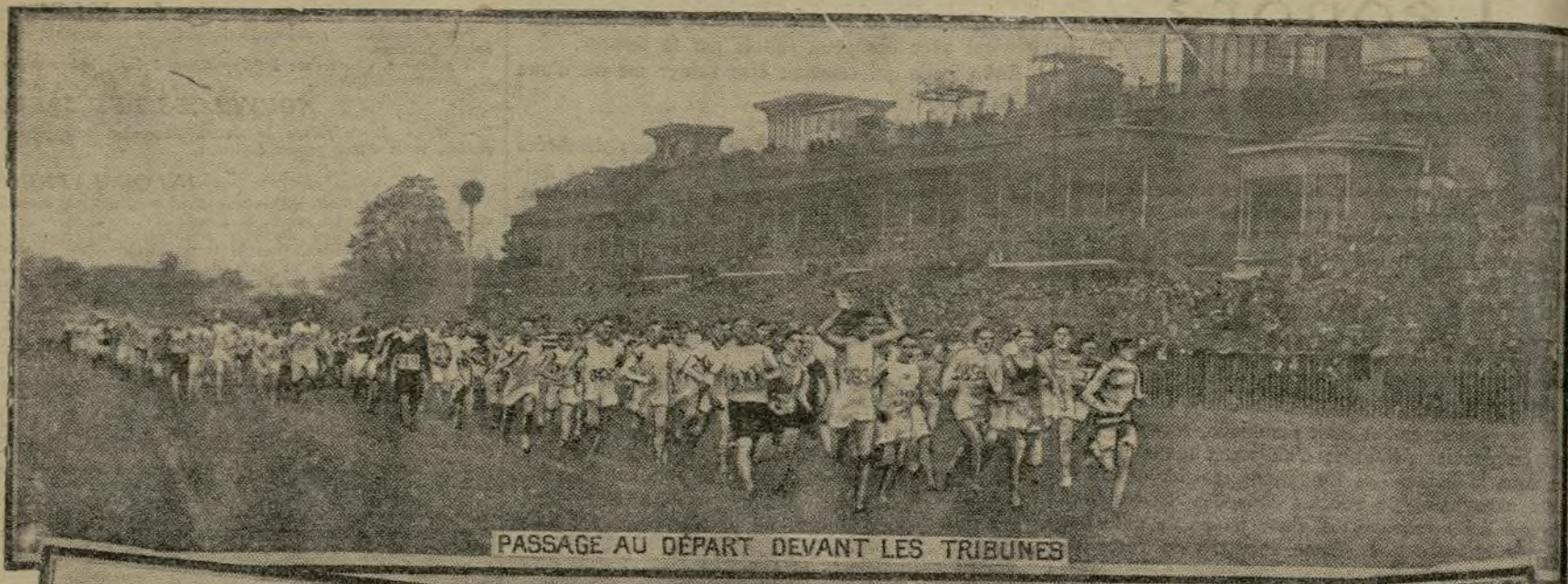
PASSAGE AU DÉPART DEVANT LES TRIBUNES