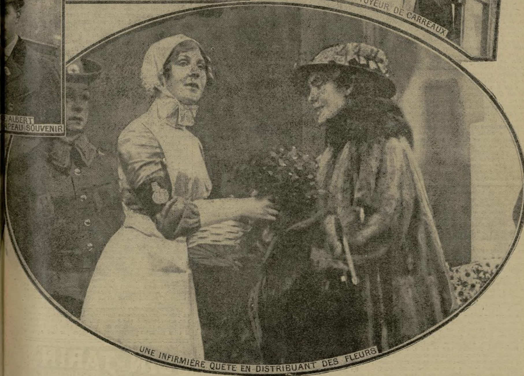
UNE INFIRMIERE QUETE EN DISTRIBUANT DES FLEURS

Parmi les « journées de la guerre » organisées en Angleterre, celle qui, le 19 octobre dernier, eut un si grand succès sous la désignation « Our Day » — Notre Jour — fut l'une des plus réussies. La vente des drapeaux — il en fut acheté plus de 400.000 à Londres — était faite au bénéfice de la Croix-Rouge. On vendit également ce que nos alliés appellent des « reliques de zeppelins ».