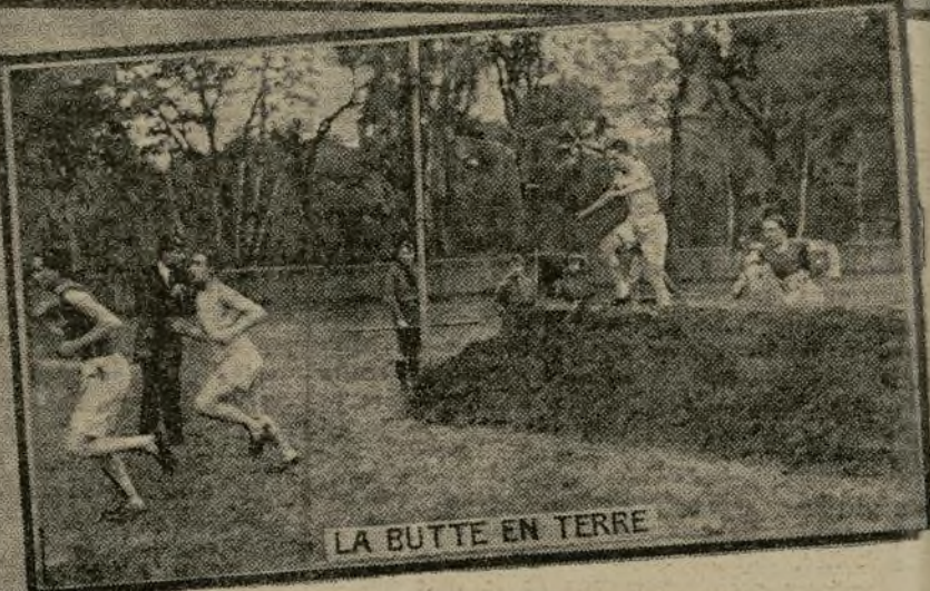
LA BUTTE EN TERRE