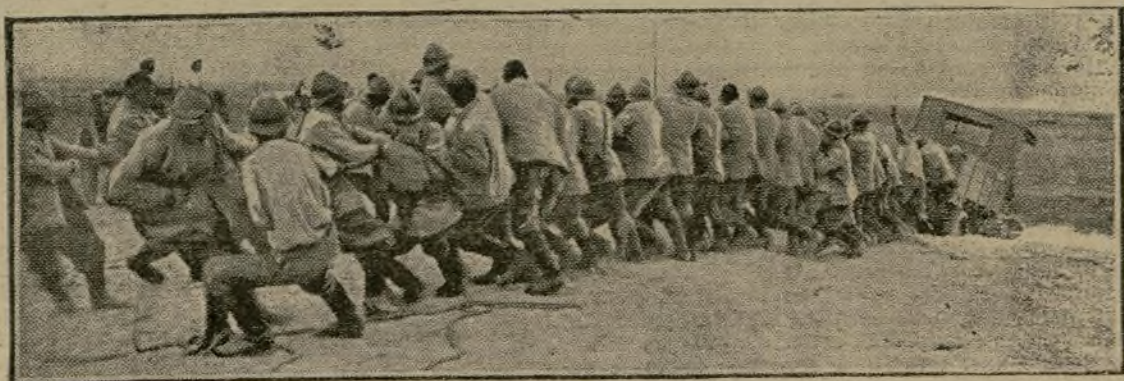
La question du ravitaillement n'est pas une des moindres difficultés qu'ont à surmonter les soldats de l'armée d'Orient. Sur les routes de Macédoine, la circulation est souvent difficile sinon périlleuse, ainsi qu'en témoigne ce cliché montrant des soldats serbes occupés à tirer d'une position critique un camion automobile.

Du rapprochement de tous ces faits résulte une impression favorable. Ce n'est encore qu'une impression, mais un point est acquis : c'est que les Austro-Allemands rencontrent devant eux une défense des plus énergiques. On peut entrevoir le jour où la situation, compro-