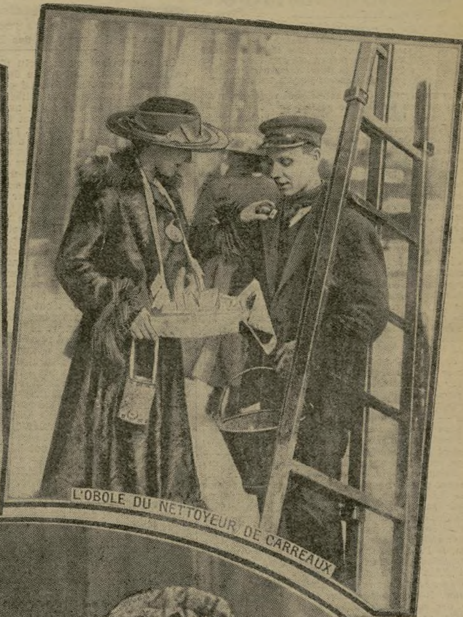
L'OBOLE DU NETTOYEUR DE CARREAUX