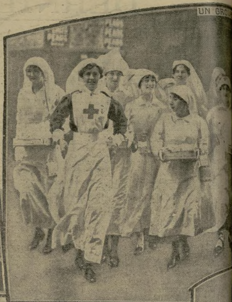
UN GROUPE DE QUETEUSES