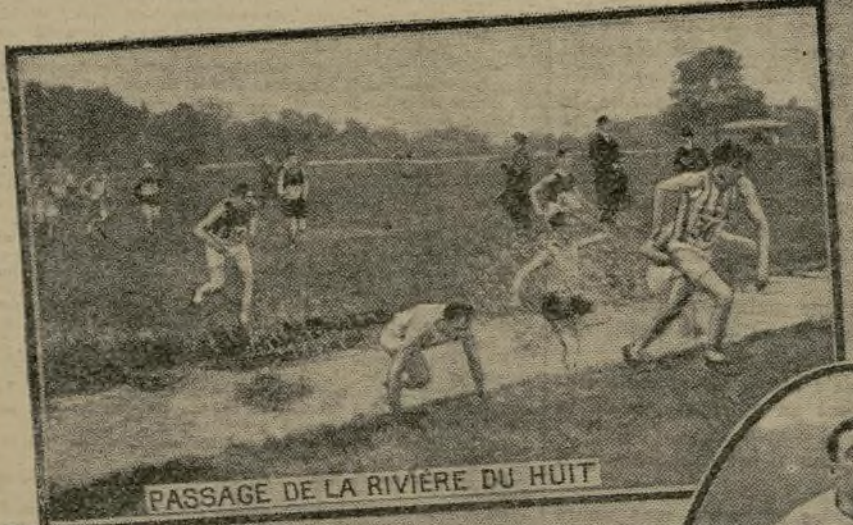
PASSAGE DE LA RIVIÈRE DU HUIT