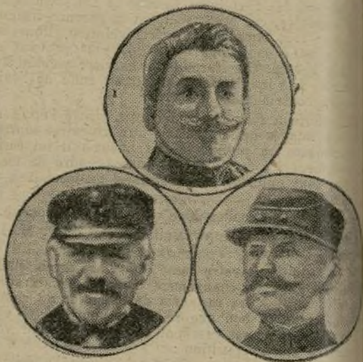
CEUX QUI COMMANDAIENT LES HÉROS DE L'YSER. En haut, le général MEYSNER; à gauche, l'amiral RONARC'H; à droite, le général JACQUES.