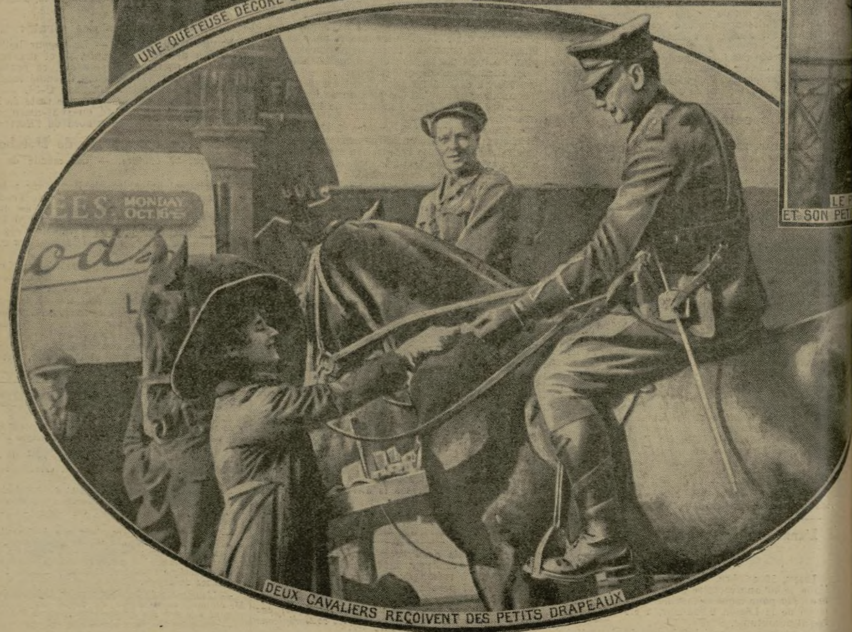
DEUX CAVALIERS RECOIVENT DES PETITS DRAPEAUX