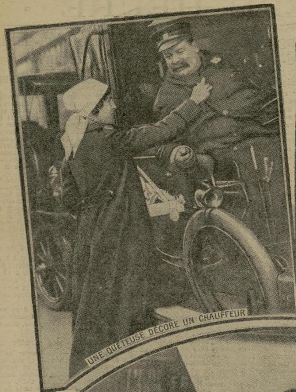
UNE QUETEUSE DECORE UN CHAUFFEUR