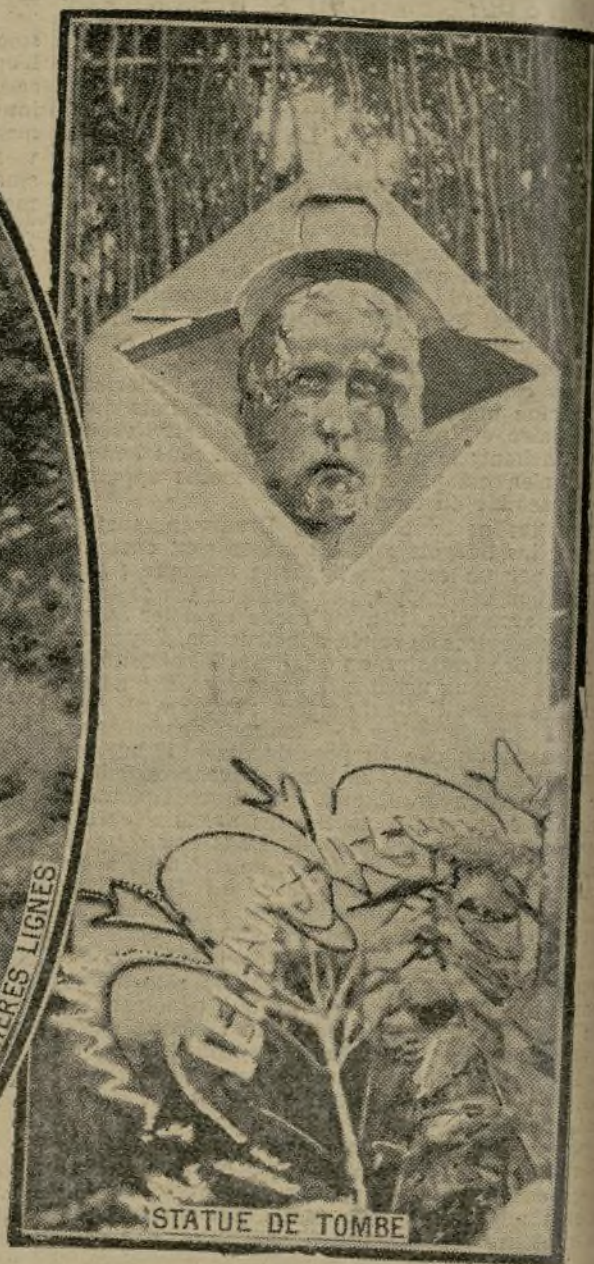
STATUE DE TOMBE

Près des lignes ennemies, sur notre front, un sculpteur de grand talent, poilu toujours vaillant à la bataille, se délasse des fatigues de la guerre, aux moments de repos, en dégagant d'énormes blocs de craie des figures expressives : on voit ici deux aspects d'un sphinx qui est une réelle œuvre d'art, et une pierre tumulaire destinée à la tombe d'un camarade.