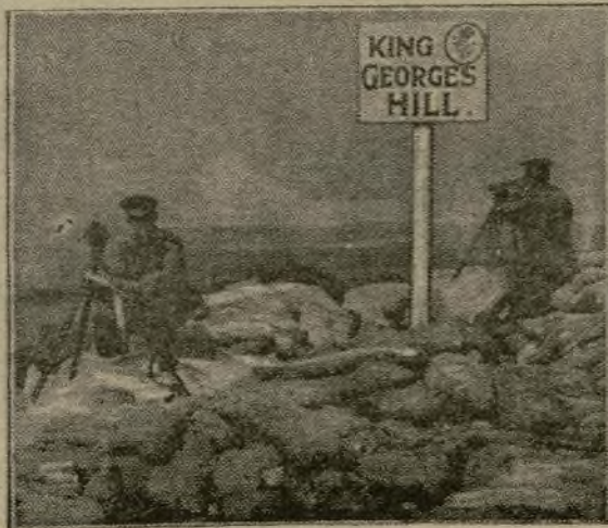
« LA COLLINE DU ROI GEORGE »

COPENHAGUE, 29 octobre. — Le Lokal Anzeiger apprend que le maréchal Hindenburg est arrivé hier soir à Berlin, avec le général von Ludendorff. Le chef d'état-major et le quartier-maître général ont eu une longue et importante entrevue avec le kaiser et le chancelier. (Radio.)