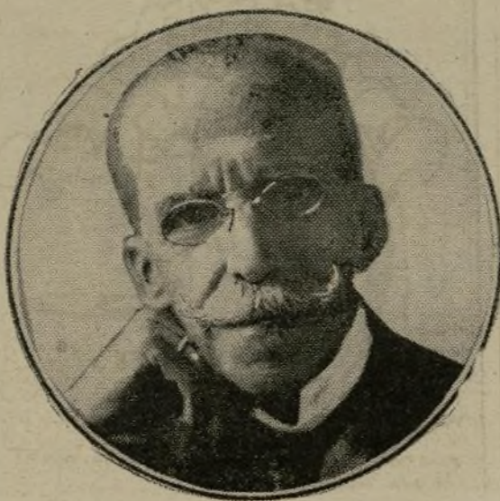
M. RUY BARBOSA

Un télégramme de Rio-de-Janeiro nous informe que l'Académie des Lettres du Brésil vient de réélire comme président M. Ruy Barbosa, dont l'active propagande en faveur de l'Entente a eu un si grand retentissement dans toute l'Amérique latine.