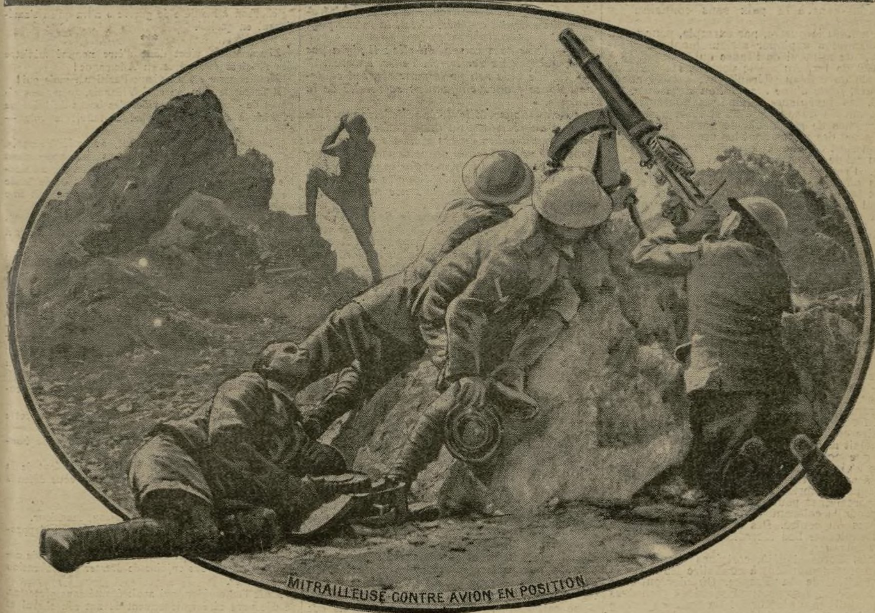
MITRAILLEUSE CONTRE AVION EN POSITION

Au moment où les troupes serbes, françaises, russes et italiennes formant l'aile gauche de l'armée d'Orient poursuivaient l'offensive qui devait être couronnée par la prise de Monastir, nos alliés britanniques, dans le secteur de la Strouma, déclanchaient une série d'attaques dont le résultat fut la conquête d'importantes positions fortifiées et de plusieurs villages. Du même fait, les Bulgares se virent dans l'impossibilité d'envoyer des renforts au secours de ceux des leurs qui défendaient la capitale de la Macédoine du Sud.