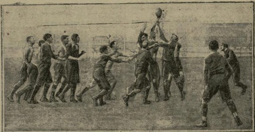
FOOTBALL-RUGBY. — Stade français contre militaires britanniques